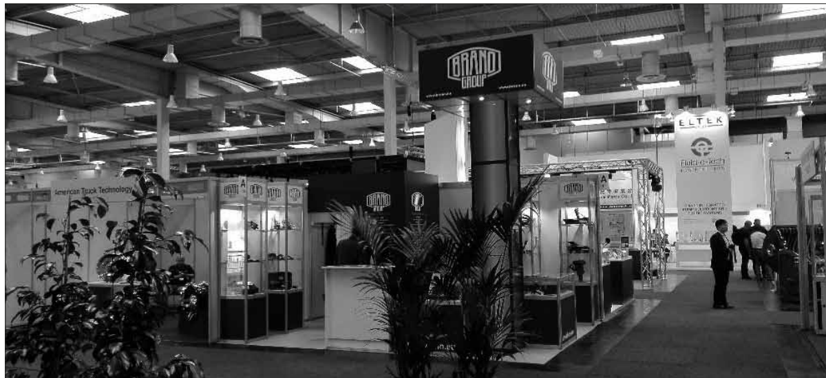
Takový byl prezentační stánek BRANO GROUP v Hannoveru