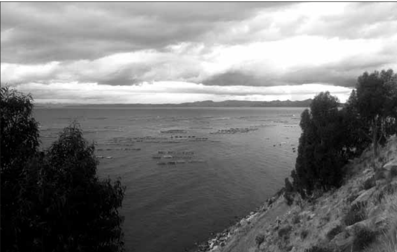
Největší jezero Jižní Ameriky Titicaca. Rozkládá se na území Peru a Bolívie. Indiáni se po jezeře plaví ve svých pověstných rákosových lodích.