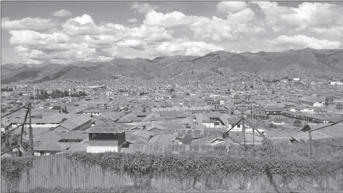
Celkový pohled na kdysi slavné město