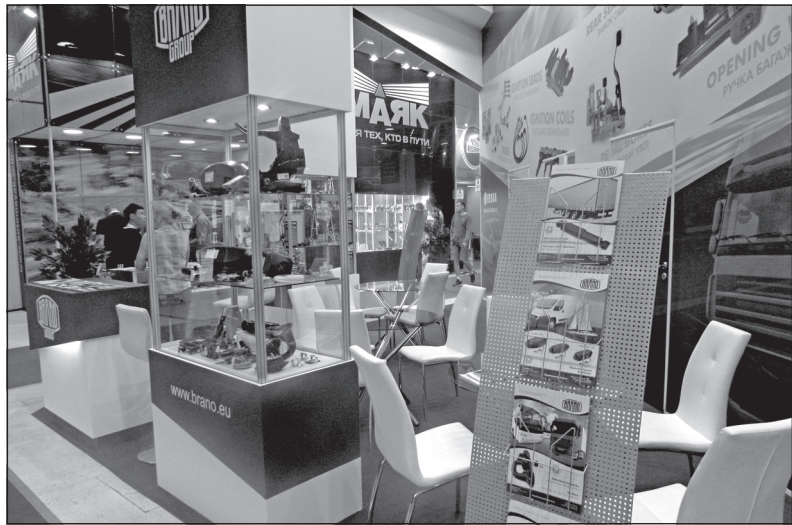
Pohled na vystavované exponáty