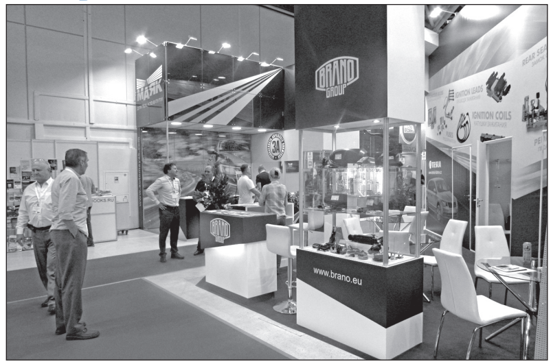
Rohový stánek BRANO GROUP v Moskvě