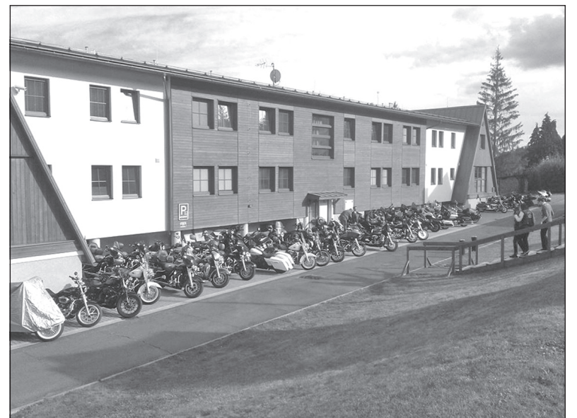
Každý z motocyklů budil pozornost