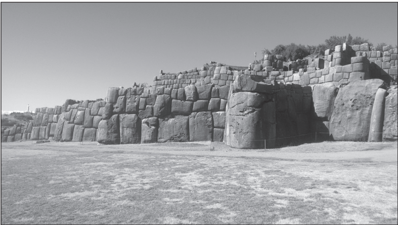
Saqsaywaman, pevnost nad Cuzcem

Prvním krokem k tomu, dostat se tam, kam chceš, je rozhodnutí nezůstat tam, kde právě jsi.