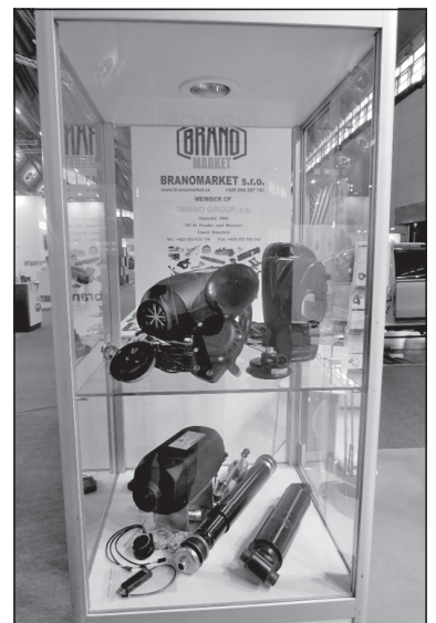
Pohled na vystavované exponáty

jmu, termín nastěhování atd.) na personálním útvaru nebo útvaru Služeb BRANO a.s. v Hradci nad Moravicí. S důvěrou se na nás obraťte.