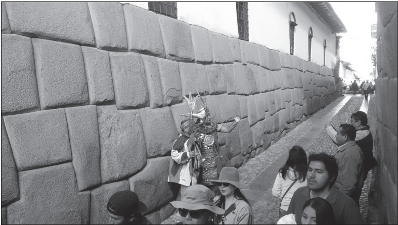
Dokonale opracovaný kámen v ulici Cuzca