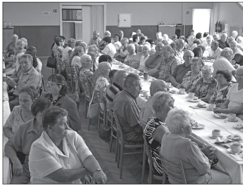
Spokojení branečtí senioři