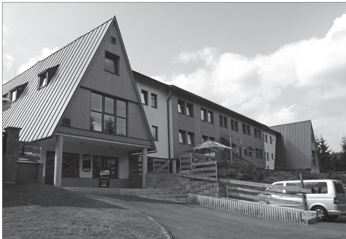
Hotel BRANS stojí za návštěvu v každém ročním období