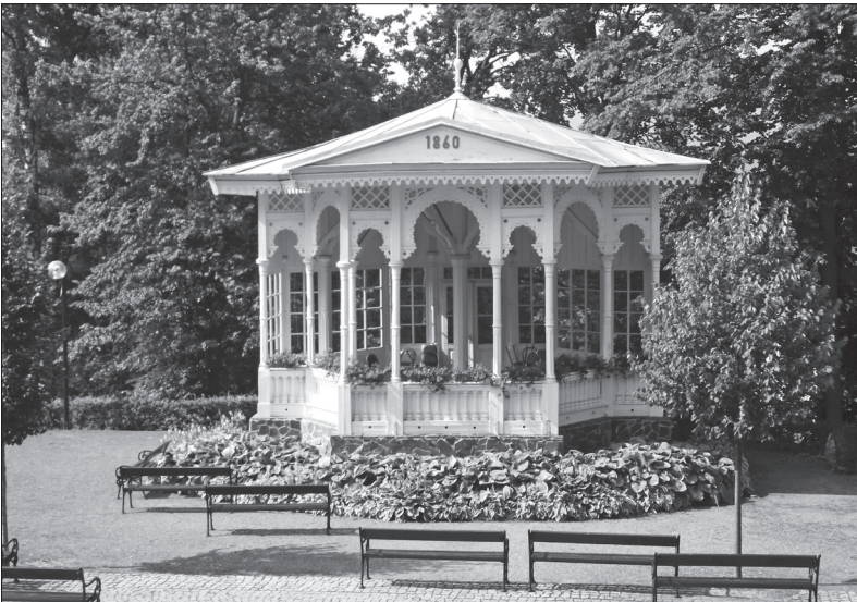
Věřili byste, že tento altán pochází z roku 1860?