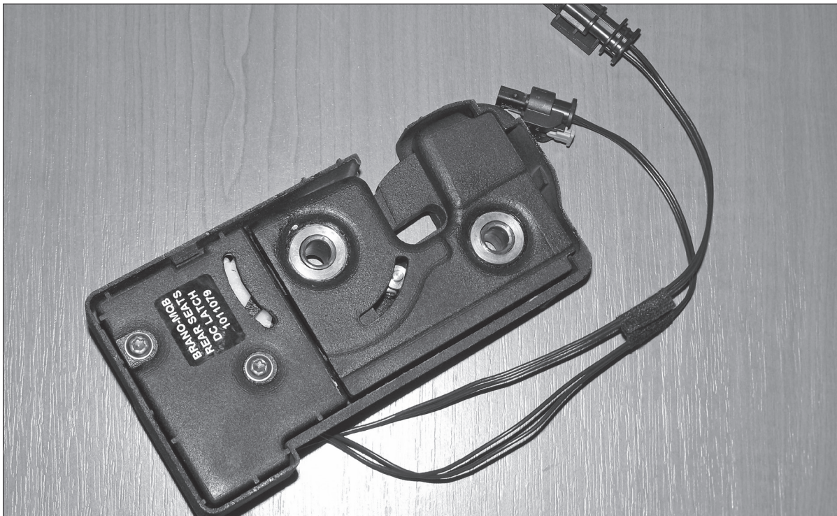
Elektrický zámek sedačky s integrovaným modulem