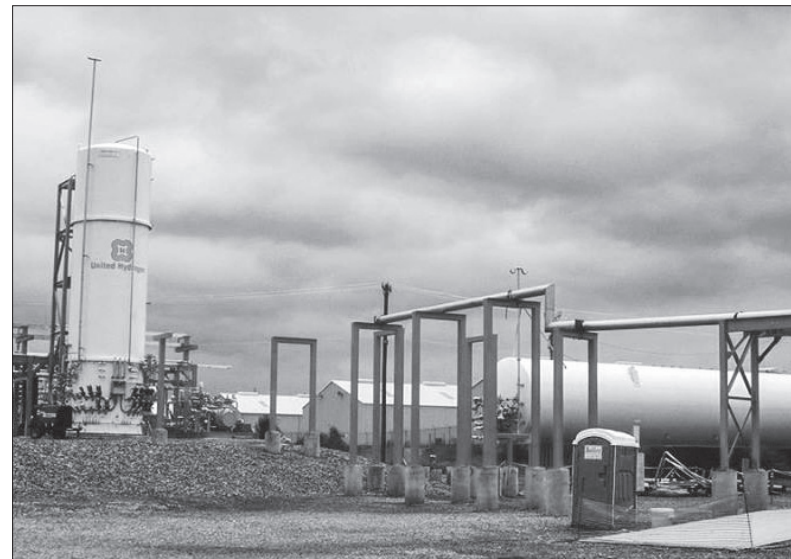
Pohled na areál firmy United Hydrogen Group v Tennessee v USA