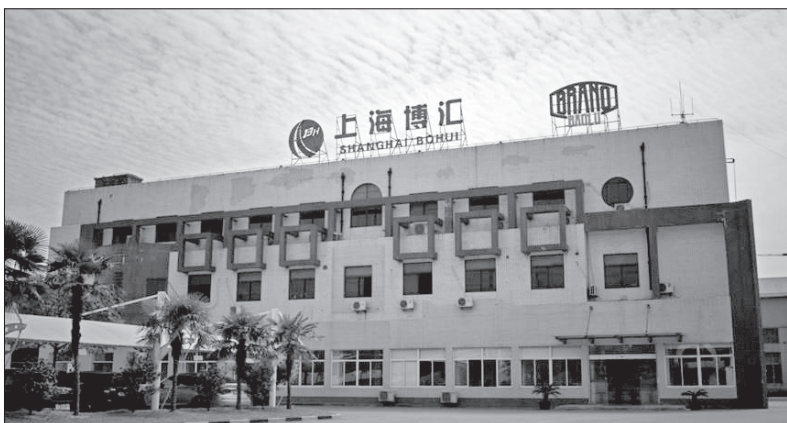
Stávající objekt BRANO v Číně