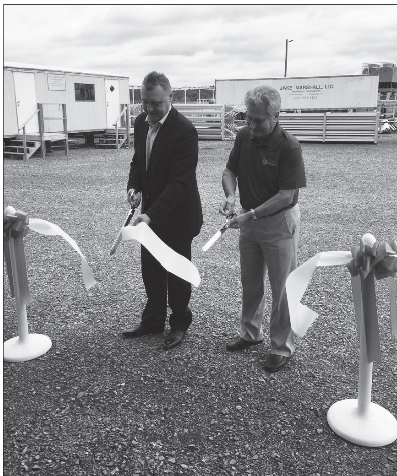
Slavnostní přestřižení pásy a závod je otevřen

ky. V roce 2016 se jedním z hlavních investorů stala právě společnost BRANO TECHNIK s.r.o. (dceřiná organizace BRANO GROUP), která v současné době ve vlastnické struktuře disponuje podílem 44%.