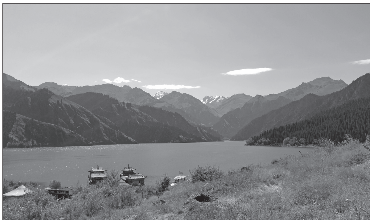
V oblasti najdete i jezero Heavenly Lake. Pro Čiňany posvátné místo v provincii Xinjiang