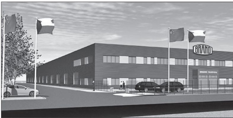
Vizualizace podoby nového závodu