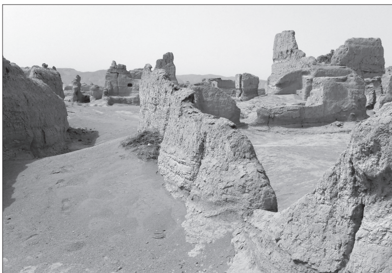
Skalní město pouště Gobi. Krásné, že...