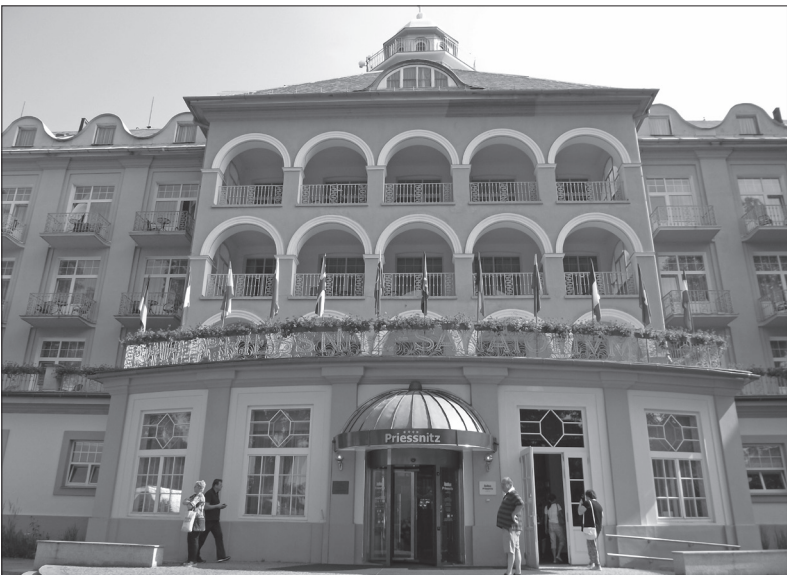
Priessnitz, hlavní lázeňská budova