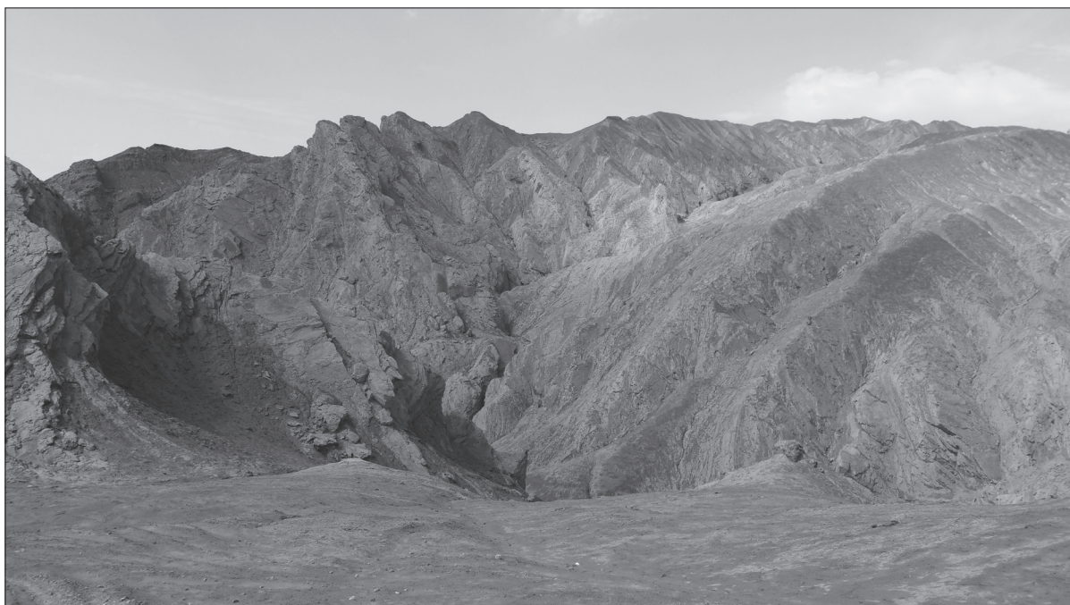
V poušti Gobi není nouze o velká pohoří