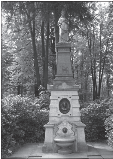
Jeden z pomníků na začátku lázeňské kolonády