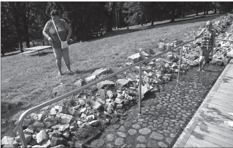
Jeden z venkovních bazénků pro hydroterapii

Možností jak prožít svůj volný čas je celá řada. Jednou z nabízejících se variant je navštívit areál lázní v Jeseníku. Priessnitzovy léčebné lázně Jeseník jsou balzámem pro unavené tělo i mysl.