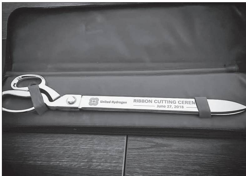
Dnes již historický suvenýr, nůžky, kterými byla přestřižena páska při otevírání továrny

USA. Dále je také v plánu výstavba minimálně tří jednotek na výrobu kapalného H 2 ve spolupráci se společností OLIN Corporation napříč celými USA.