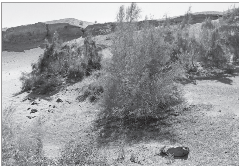
Také v poušti je nějaká ta zeleň