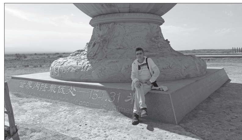
V propadlině Turpan, 154 m pod úrovní hladiny moře. Teplota zde dosahuje 50 stupňů Celsia