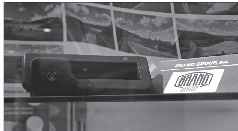
Součástí časové schránky bude i náš griffmaster