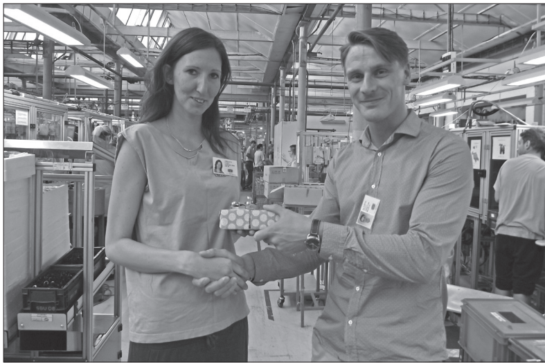
Předávání výhry vítězce soutěže