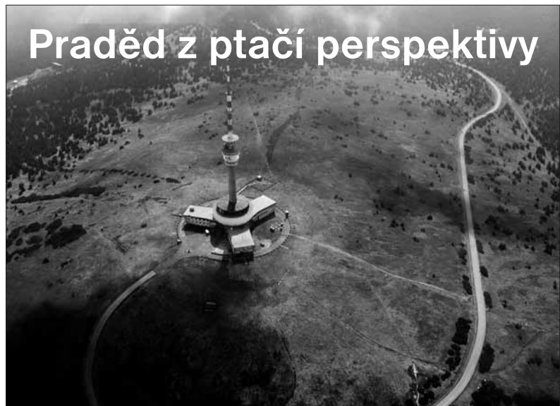
Letecký pohled na nejvyšší horu Jeseníků Praděd. Tohle běžně neuvidíte.