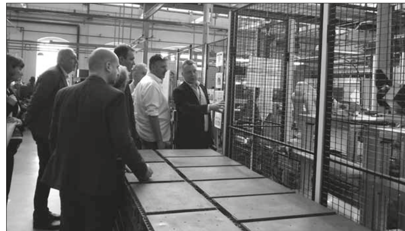
Na SBU DS u linky KHD 13