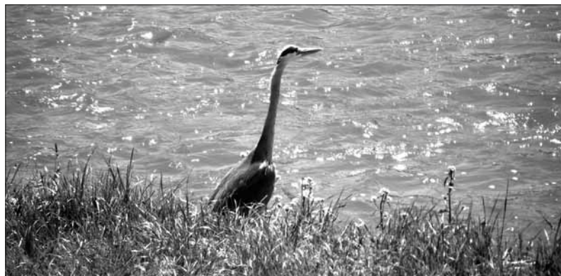
Volavka na řece Opavě. Tuto volavku jsem viděl už z dálky, ale sotva jsem došel do vzdálenosti, ze které se dalo fotit, odletěla na protější břeh. Pomyslel jsem si, že je to ztracené. Ovšem okolnosti se brzy změnil. Po protějším břehu šel směrem k volavce muž venčící psa. Nejspíš ptáka ani neviděl. Rozhodl jsem se počkat s foťákem připraveným v ruce a vyplatilo se. Volavka psa zaregistrovala, na nic nečekala a opět přiletěla na můj břeh. Chvilu v klidu monitorovala situaci a já mohl pořídit několik záběrů.