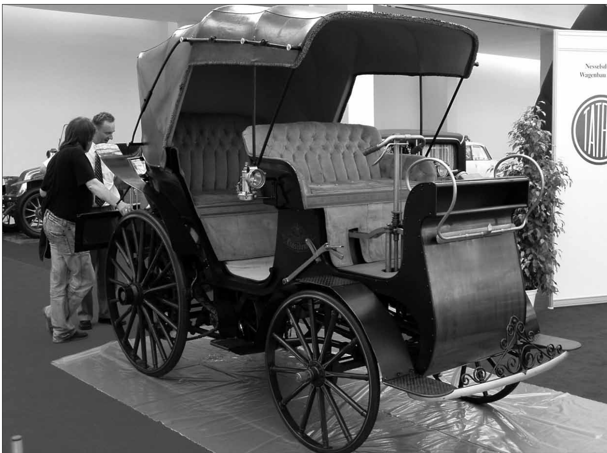
Před 120 lety byl vyroben první osobní automobil na území českých zemí. V Kopřivnici roku 1898 tak spatřil světlo světa vůz značky Praxident. Prakticky se tak začala psát historie českého automobilového průmyslu.

Pieninské pohorie patří k nejmalebnějším a nejznámějším horským pásmům v Polsku. Charakteristické je neobyčkle špičatými skalními útvary. Mezi polským Čorštynem a slovenskou Štiavnicí se táhne ústřední masív zvaný jako Pieniny Vlastní (nejvyšší vrchol Tři koruny - 982 m n. m.), na západě jsou Pieniny Spišské a na východě Pieniny Malé. Pohorím protéká pieninský Průlom Dunajce, jedna z největších a nejkrásnějších horských řek na polsko - slovenských hranicích.