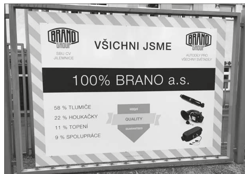
Nový program SBU CV Jilemnice