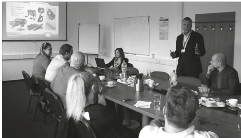
Seznámení s firmou v zasedací místnosti