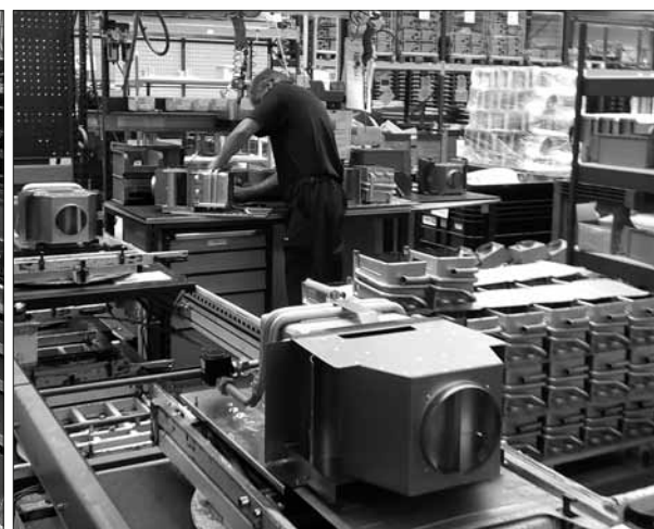
SBU Heating Uničov se rovněž modernizuje a má své úspěchy

SBU Heating zaujímá na českém a slovenském trhu jednu z vedoucích pozic v prodeji plynových a elektrických kotlů a plynových průtokových ohřivačů vody. Trhy na východě (Rusko, Ukrajina) byly nejen udrž-