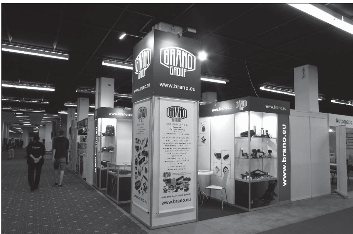
Prezentační stánek BRANO GROUP na veletrhu v Bratislavě