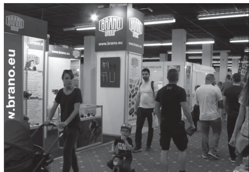
Na veletrhu v Bratislavě nebyla o návštěvníky žádná nouze