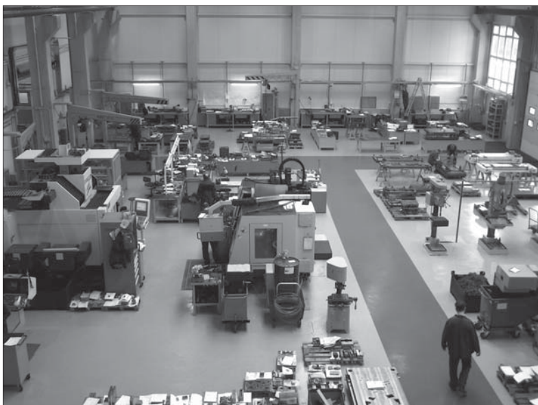
Celkový pohled na interiér hradecké nástrojárny