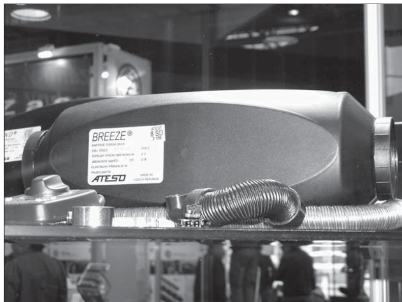
Na veletržích je o topení velký zájem