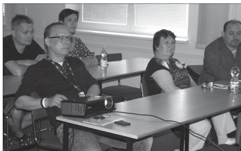
Delegáti pozorně sledují jednání