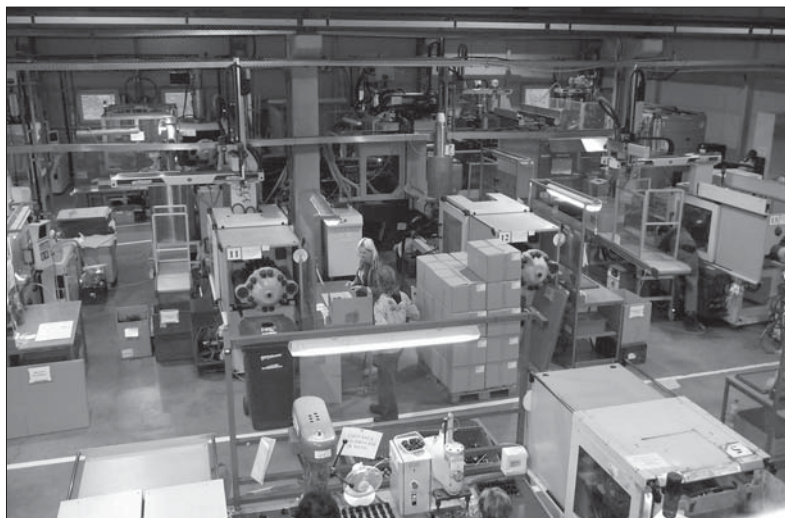
SBU Plasty je rovněž v soutěži Inovační firma Zlínského kraje