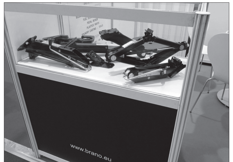
Část vystavovaných exponátů

alizaci ve standardních výstavních prostorách, to byl další krok k oživení a zatraktivnění veletrhu směrem k návštěvníkům.