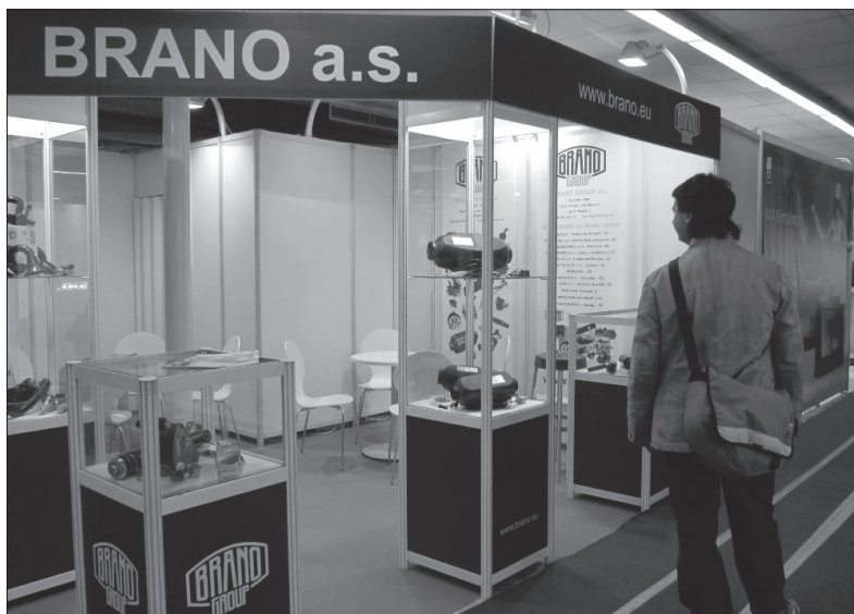
Prezentační stánek BRANO v Srbsku

miče pérování a nezávislá topení, dlouhodobě lze pozorovat zvýšený zájem o zvedáky. I když u prodeje topení jsme předpokládali lehké zvýšení zájmu, překvapilo, že byl až takový. U tlumičů lze předpokládat uspokojivé prodeje dlouhodobě, hlavně v závislosti na nedostatečném zásobování náhradními díly na trhu. Vzhledem k velikosti místního trhu