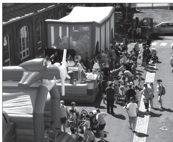
Den otevřených dveří spojený s Mezinárodním dnem dětí proběhne v BRANO a.s. v pátek 1. června. Přijďte se svými rodinami na tuto tradiční akci.

lonky, hasičské auto. To vše najdete v braneckém areálu v pátek 1. června, tedy letos přesně na Mezinárodní den dětí. Prohlídka jednotlivých provozů a pracovišť je již samozřejmostí. (mp)