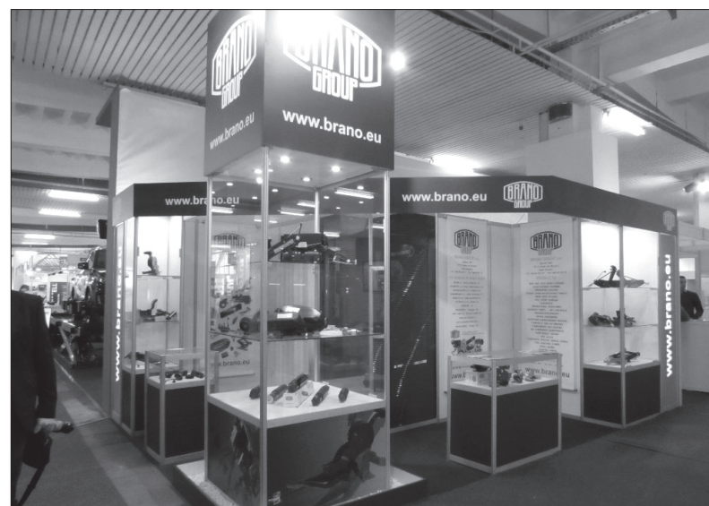
Takto se skupina BRANO GROUP prezentovala v Chorvatsku