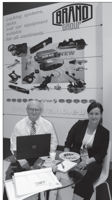
Naši zástupci na veletrhu

„Turecko zůstává pro české firmy ve většině případů velmi dobrým trhem, ať už se jedná o dodržování