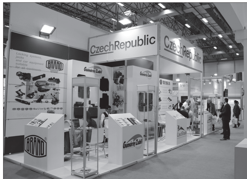
BRANOMARKET prezentoval na společném stánku

Istanbul je tradičním obchodním centrem, které zaujímá v současné době 8. příčku na žebříčku evropských měst, který byl vytvořen podle toho, jak jsou vstřícná k podnikání. Navíc s HDP ve výši 449 miliard dolarů a 31 tisíci dolary HDP na jednoho obyvatele výrazně dominuje okolním regionům nejen v Asii, ale i v Evropě. Karel Sedláček