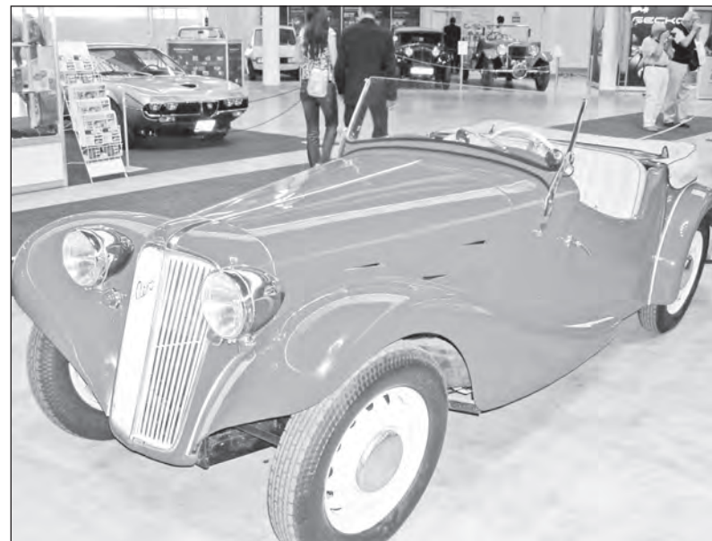
Aero - kdysi tradiční česká značka