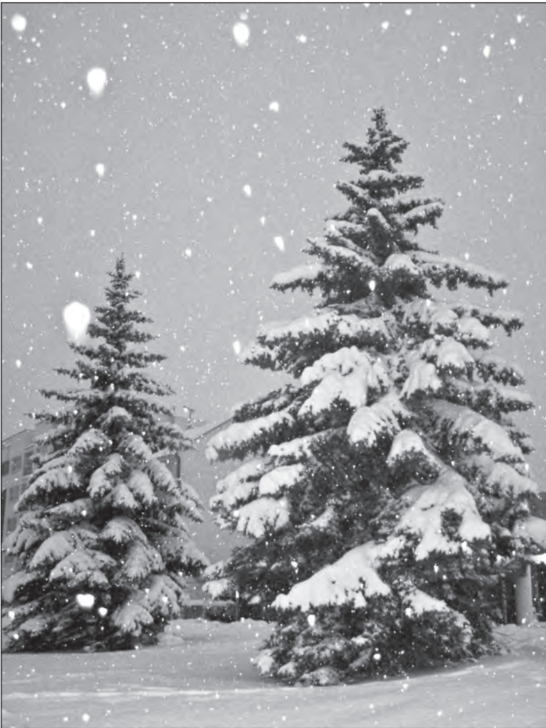
Zimní příroda umí být pohádková, stačí se jen dobře dívat