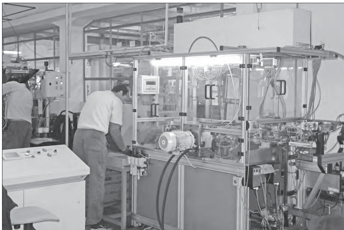
V listopadu úspěšně pokračoval audit

Uplatnění u nás najdou konstruktéři, technologové, projektoví manažeri, nástrojníci, obráběči CNC strojů, soustružníci, seřizovači, montážní dělníci. Šikovní lidé u nás mají otevřenou cestu k vybudování slušné profesní kariéry.