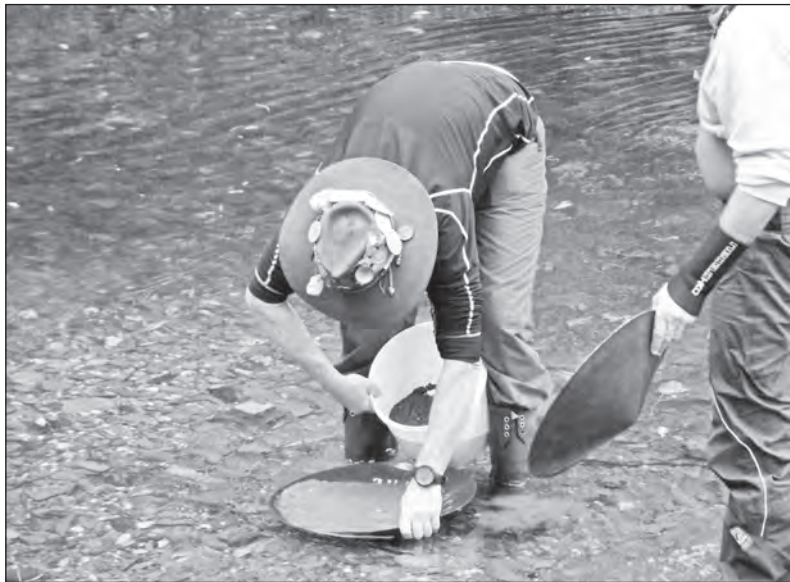
Mistr světa v rýžování zlata v akci