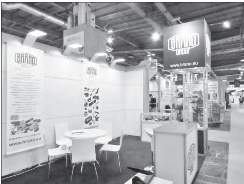
Prezentační stánek BG v Paříži

S více než deseti zeměmi, jako je Belgie, Německo, Španělsko, USA a další, které představují svou řadu produktů na prodej dílů pro automobily, autobusy, lehká užitková vozidla, těžká nákladní vozidla, dvoukolky, tříkolky, čtyřkolky, zemědělská a stavební vozidla, se výstava transformuje na globální platformu pro výměnu technického know-how. Zatímco speciální demonstrační pavilony, obchodní schůzky a konference využívají kongregace rozhodujících činitelů a techniků, ocenění automobilové inovace v automobilové technologii je věcí drobných i větších výrobců, prodejců i nákupců. Celosvětový veletrh pro automobilový průmysl, jak si výstava Equip Auto říká, by neměl chybět v kalendáři automobilových výstav na jihozápadě Evropy. Více než 1800 vystavovatelů a výrobců je i přes stále se zmenšující počet zů-