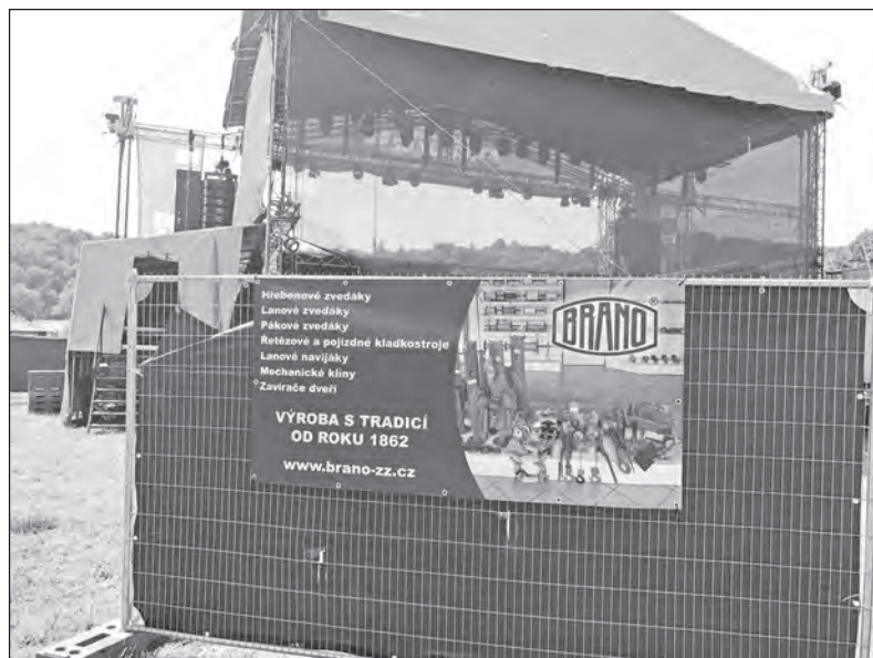
Výbornou prezentaci měla SBU ZZ letos v létě, a to na festivalu Moravské hrady v Hradci nad Moravicí. Spolupráce s organizátory bude pokračovat i v příštím roce