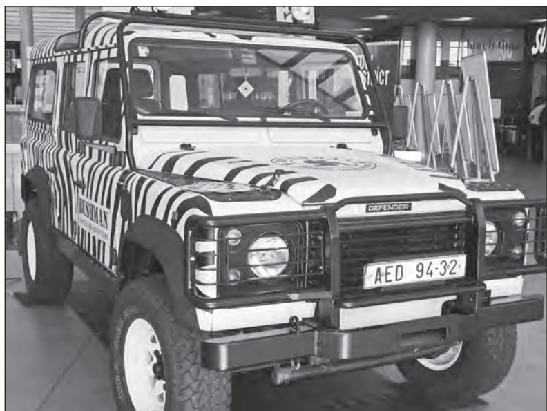
Vůz Defender v expediční úpravě. Zebra na kapotě jasně odpovídá na otázku, kam byl vůz vyslán. Defender je robustní vozidlo a do Afriky se hodí