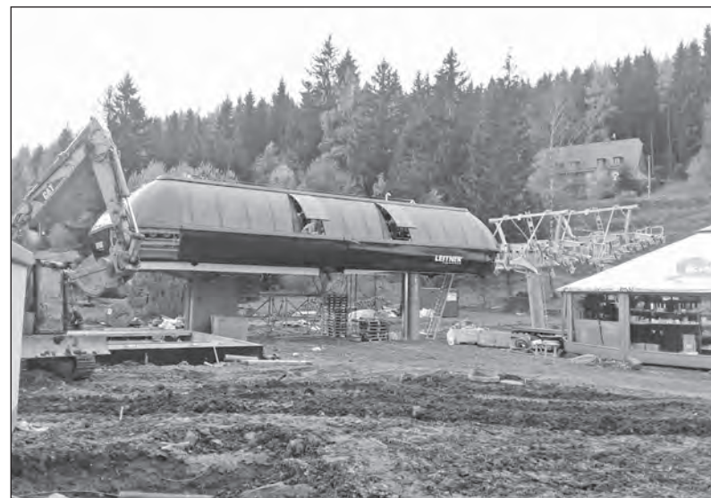
Snímek pocházející z počátku listopadu. Právě probíhaly práce na instalaci nové šestisedačky v lyžařském areálu Kopřivná, hned vedle hotelu BRANS v Malé Morávce