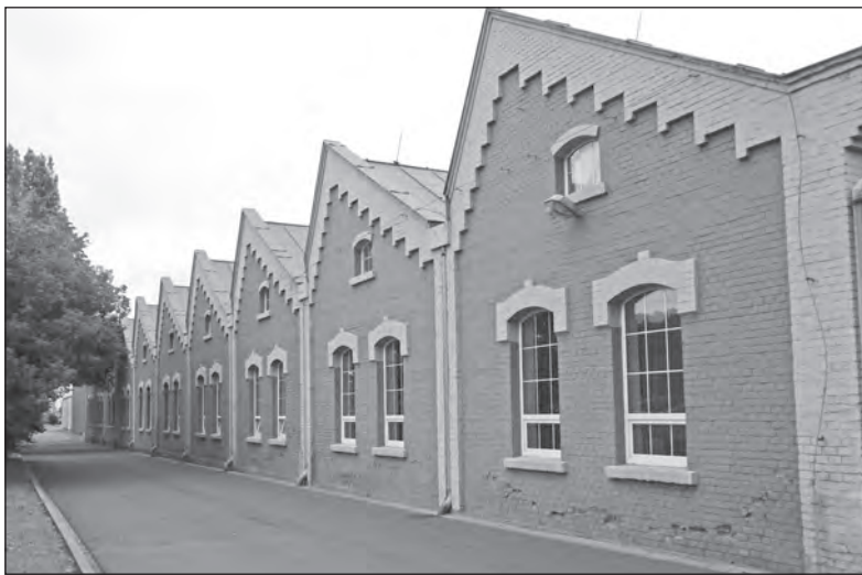
Rok 2017 byl pro BRANO a.s. úspěšný