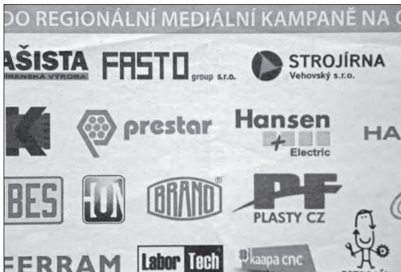
BRANO mezi účastníky kampaně nechybí

BRANO GROUP je jedním z partnerských firem regionální mediální kampaně Dobrá profese. Tato kampaně probíhá na Opavsku a je součástí zdejších novin týdeníku Region Opavsko.