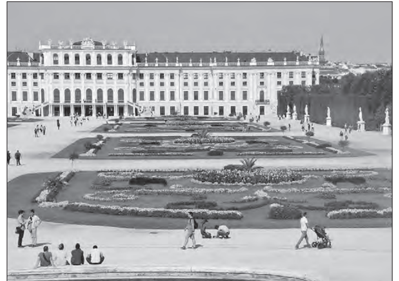
I takový pohled se naskytl účastníkům zájezdu