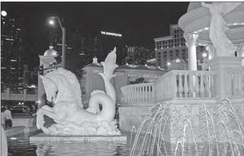
O fontány a vodotrysky není nouze