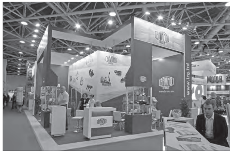
Stánek BRANO GROUP v Moskvě