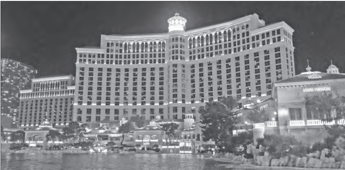
Obří hotelové komplexy, kasina a luxus. To je Las Vegas v Nevadě