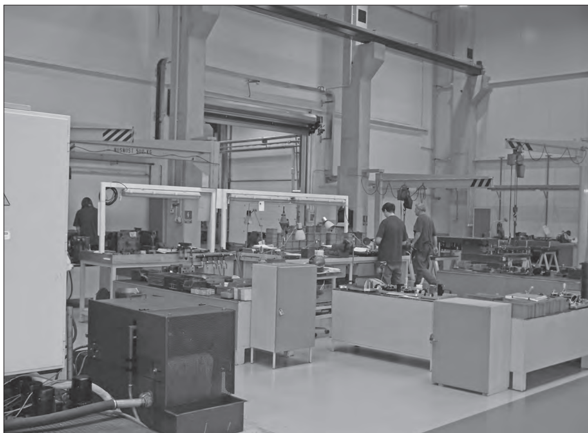
SBU TOOLS se dočká nových moderních strojů

V SBU TOOLS rovněž dochází k dílčím změnám v personálním obsazení dvou funkcí. V Hradci nad