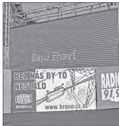
Jedna z reklam SBU ZZ na Moravských hradech

V roce 2018 pak budou moci zaměstnanci z řad zaměstnanců našeho podniku získat vstupenky nejen na kterýkoli z festivalů Moravské hrady, ale rovněž na ty, které se uskuteční na obvyklých místech v české části naší republiky. „S ohledem na skutečnost, že z letošního festivalu máme mnoho kladných ohlasů, bude SBU ZZ spolupracovat s výše uvedenou agenturou i v příštím roce,“ dodává Lucie Vajdová. (mp)