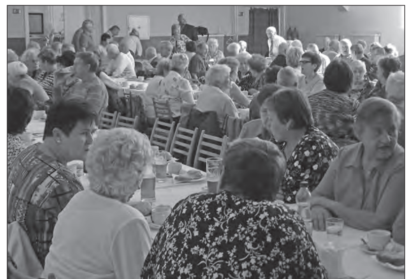
Plný sál seniorů - bývalých zaměstnanců

Odboráři, kteří odcházejí do důchodu a chtějí být i nadále členy odborů, necht' se nahlásí v kanceláři ZO OS KOVO BRANO.