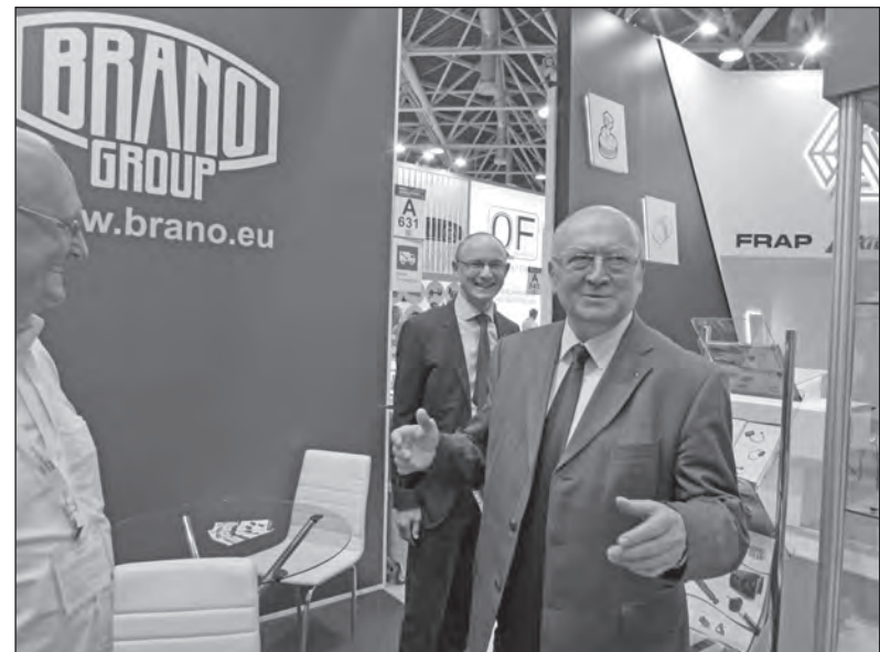
Stánek BG navštívil i velvyslanec Vladimír Remek