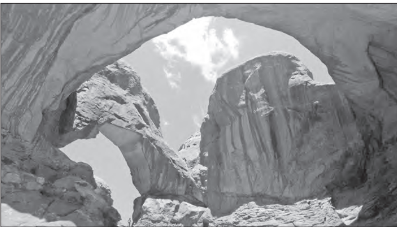
NP Arches je rovněž v Utahu