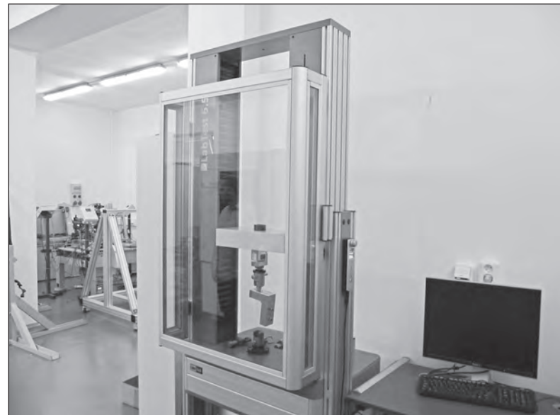
Nová moderní trhačka

Jde o čistě branecký vývoj,“ dodává Libor Kuděla.