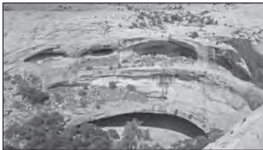
SP Goosenecks a dřívější indiánská obydlí