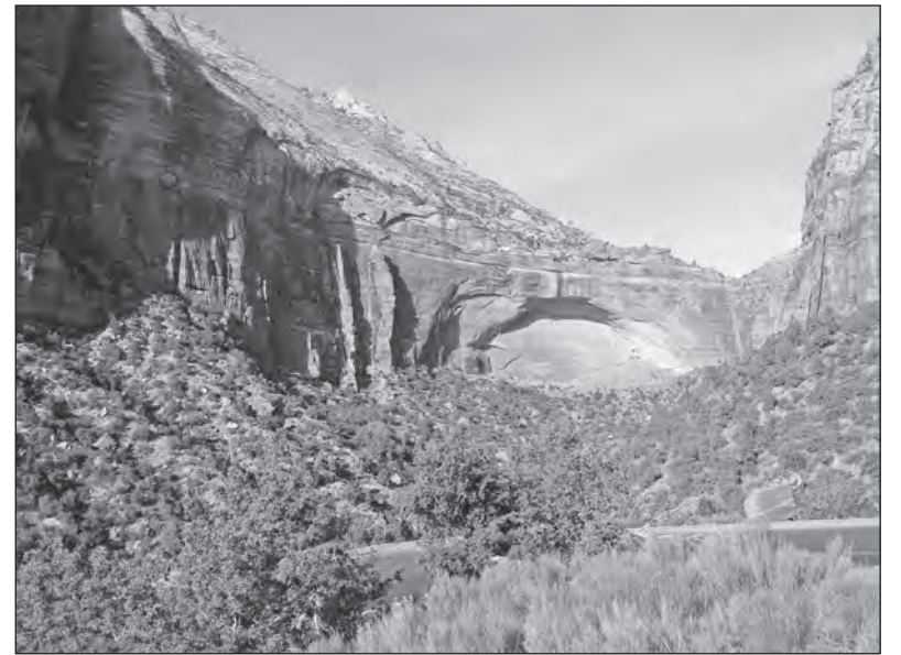
NP Zion v Utahu