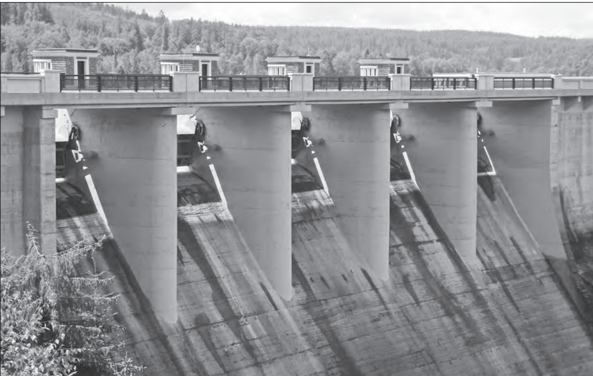
Kružberská přehrada po rozsáhlé rekonstrukci

Obec Kružberk a nedaleká Kružberská přehrada patří již léta k nejoblíbenějším rekreačním oblastem Opavska. Tato místa najdeme v malebné krajině Oderských vrchů na hranici Přírodního parku Moravice. Lidé sem jezdí především za pěší turistikou a cykloturistikou. Několikrát do roka se také pořádají oficiální sjezdy řeky Moravice, takže i vodáci si mohou přijít na své.