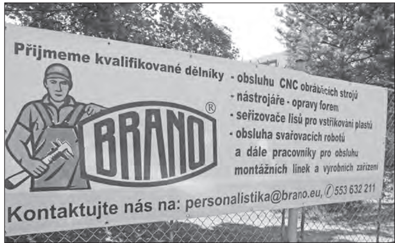
BRANO má své brány otevřené pro všechny šikovné lidi. Doporučte nového zaměstnance