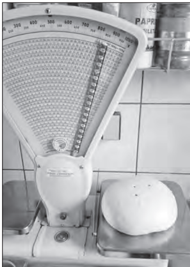
Borůvkový knedlík – dělová koule

Přijďte za námi. Ano, tato slova nejlépe vystihují podstatu věci. Všechny branecké odborové organizace (Hradec nad Moravicí, Rakovník, Jilemnice) jsou připraveny vyslechnout si vaše náměty, nápady a třeba i kritiku. Přijďte a povězte nám co zlepšit, co dělat jinak. Dveře jsou otevřené. My odboráři se nebráníme nápadům a vyslechneme každého. Zapojte se i vy.