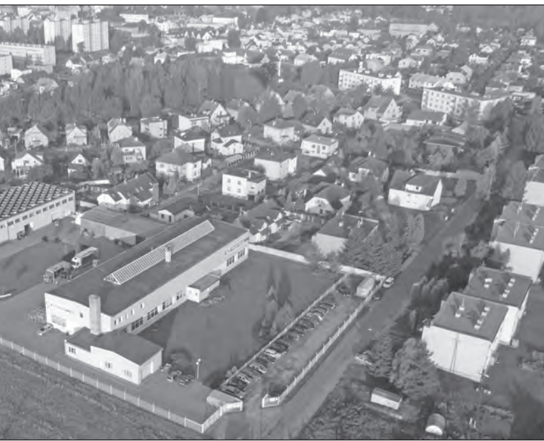
PROF SVAR v Mnichově Hradišti jako na dlani. I tady se dějí velké změny, a to na všech stranách

Za období 1.–6. 2017 bylo vyrobeno 756 468 ks osobních automobilů (+ 5,1 %). Značka ŠKODA se podílí 60,8 %, HYUNDAI 24,9 % a výrobce TPCA 14,3 %. Za leden až červen 2017 bylo vyrobeno celkem 2 318 ks