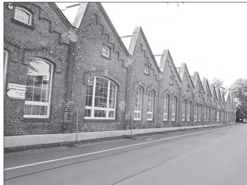
Zemský archiv Opava shromáždil o BG spoustu materiálu

Věděli jste, že velké množství informací o BRANO GROUP má k dispozici Zemský archiv Opava? Podklady jsou přístupné.