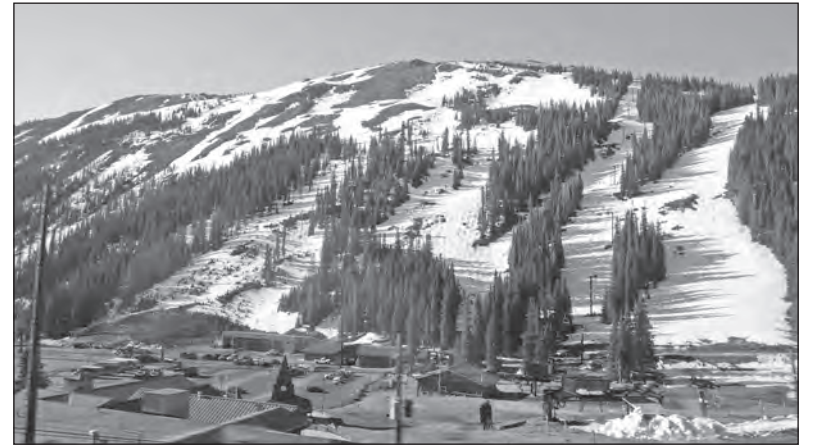
Rocky Mountains, věčně zasněžené vrcholky