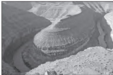
SP Goosenecks je nezapomenutelný