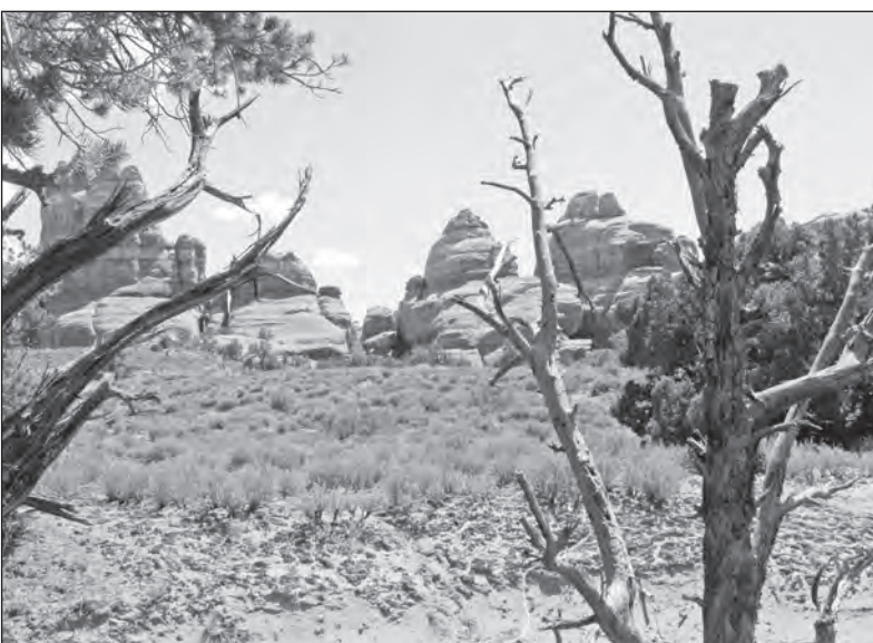
NP Canyonlands na jihu Utahu