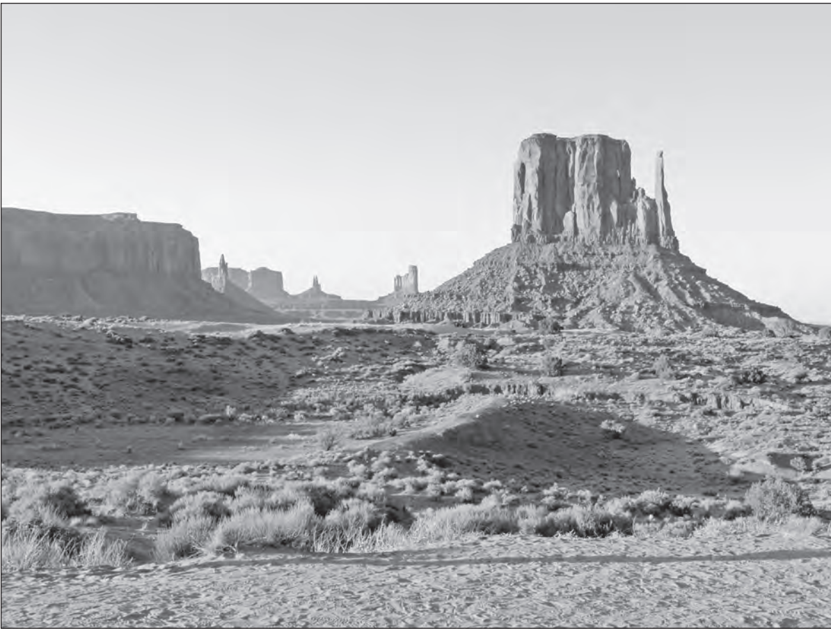
Monument Valley leží na hranici států Utah a Arizona

Další fotky budou následovat v některém z příštích čísel Novin BG.