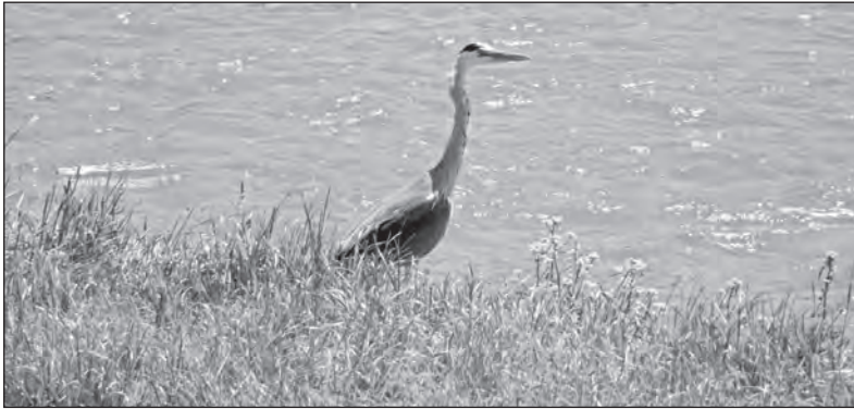
Volavka na řece Opavě. Když je štěstí a podaří se fotoúlovek