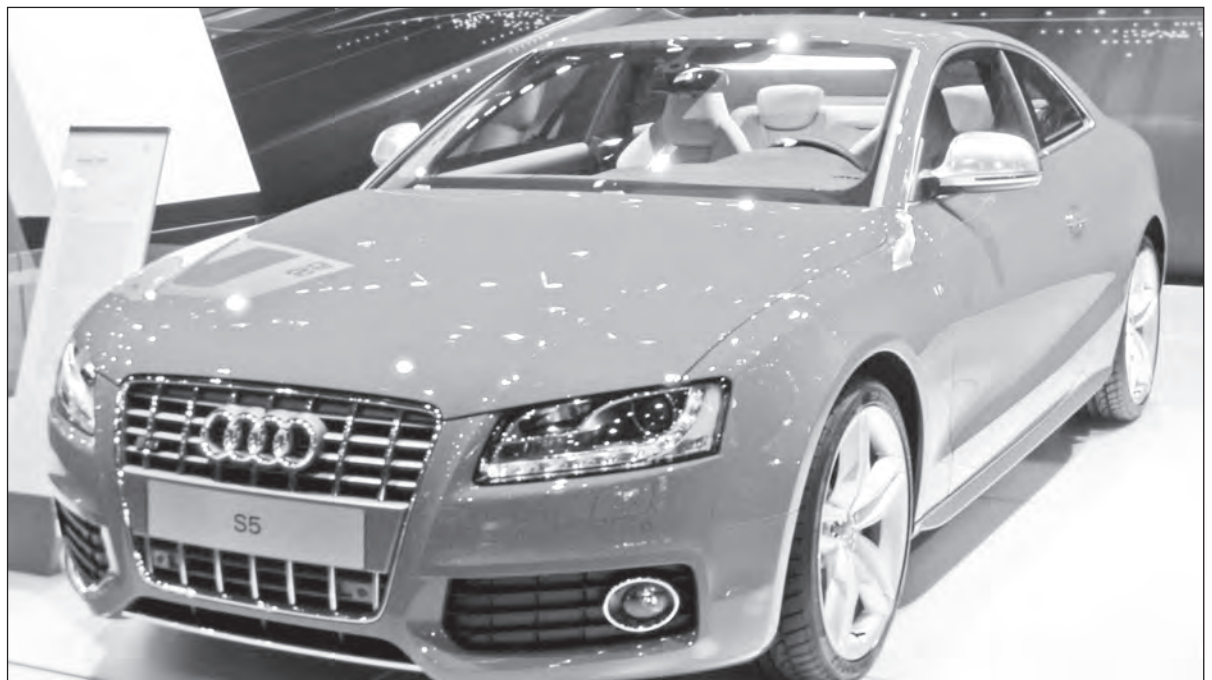
Kapota již nemusí znamenat pro chodce fatální nebezpečí (ilustrační snímek)