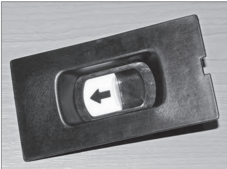
Dětská pojistka pro nouzové otevírání

Hradecká vývojová skupina v současné době opět pracuje na velmi zajímavých projektech. Některé jsou nové, jiné se týkají pokračování již dřívějších úkolů. K úspěchům mimo jiné patří projekty, které jsou realizovány pro automobilku Škoda Auto.