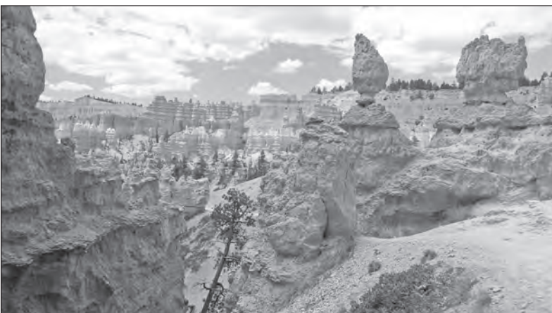
Bryce Canyon má stovky vápencových věží