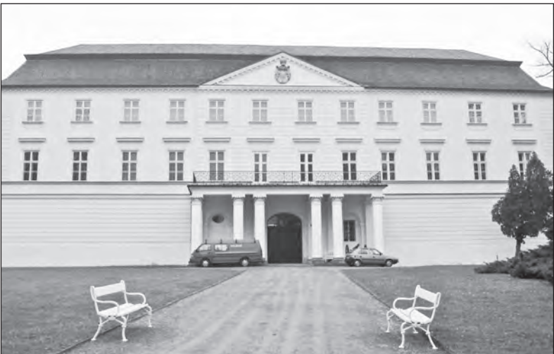
Zámek v Hradci nad Moravicí, bývalé sídlo knížat Lichnovských