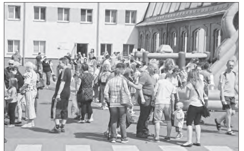
Den otevřených dveří spojený s Mezinárodním dnem dětí se v BRANO a.s. uskutečnil v pátek 2. června od 14 hodin. Přijďte se svými rodinami do areálu firmy