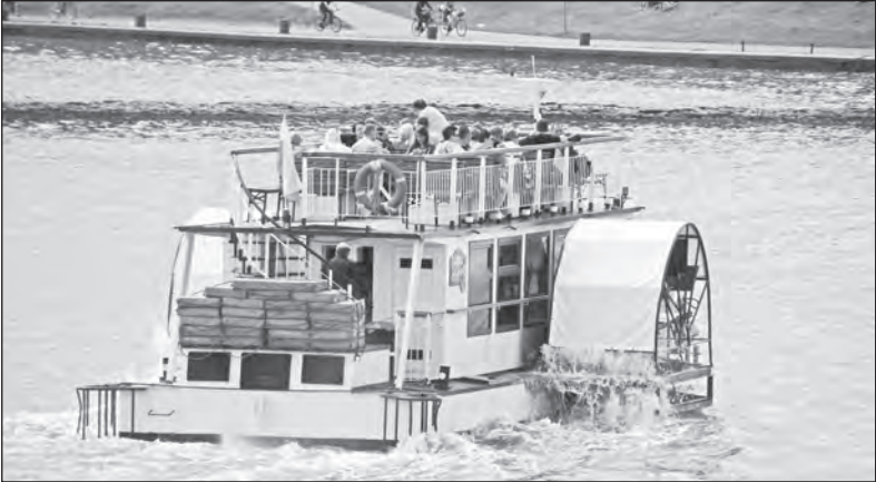
Kolesovým lodím ještě neodzvonilo. Tato pluje na řece Visle v Krakově v Polsku