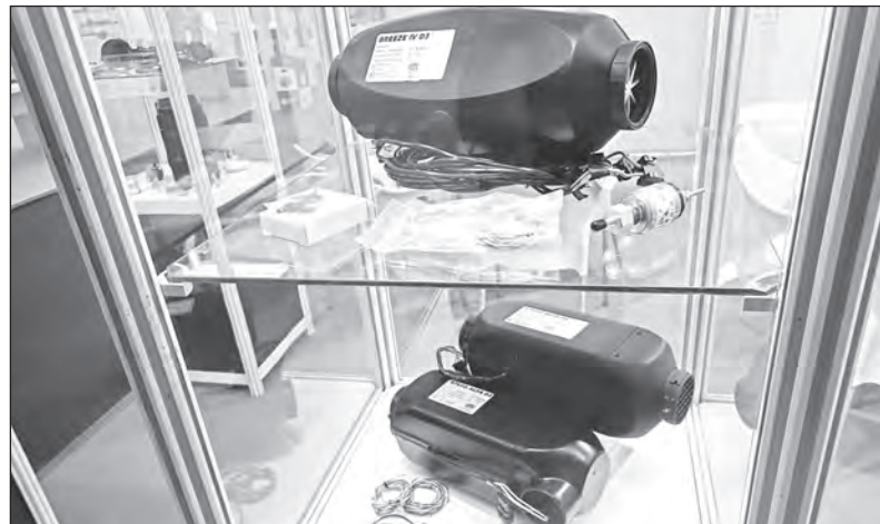
Topení, část expozice BRANO GROUP