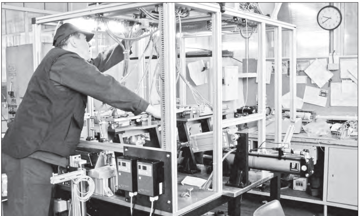
Pro všechny zaměstnance platí výhody z kolektivní smlouvy i nadále

ného vozidla Jaguar F – Pace to byly ještě vozy Audi Q5 a Volkswagen Tiguan. O vítězi rozhodovalo svým hlasováním 75 motoristických novinářů z celého světa. (mp)