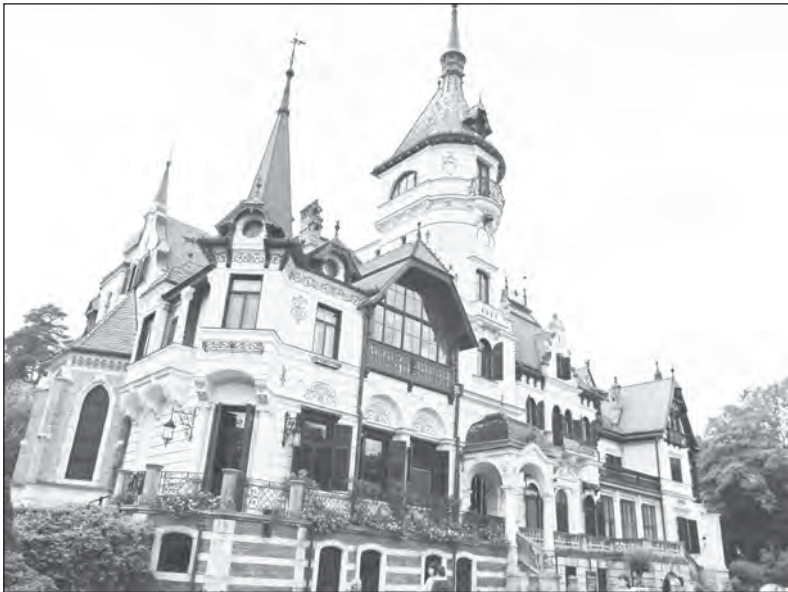
Zámek Lešná v areálu zoologické zahrady

„Číšníku, jednu bílou kávu!“ „Kolik kostek cukru?“ „Když je dobrá, tak si dávám jednu!“ „Tak tedy tři!“