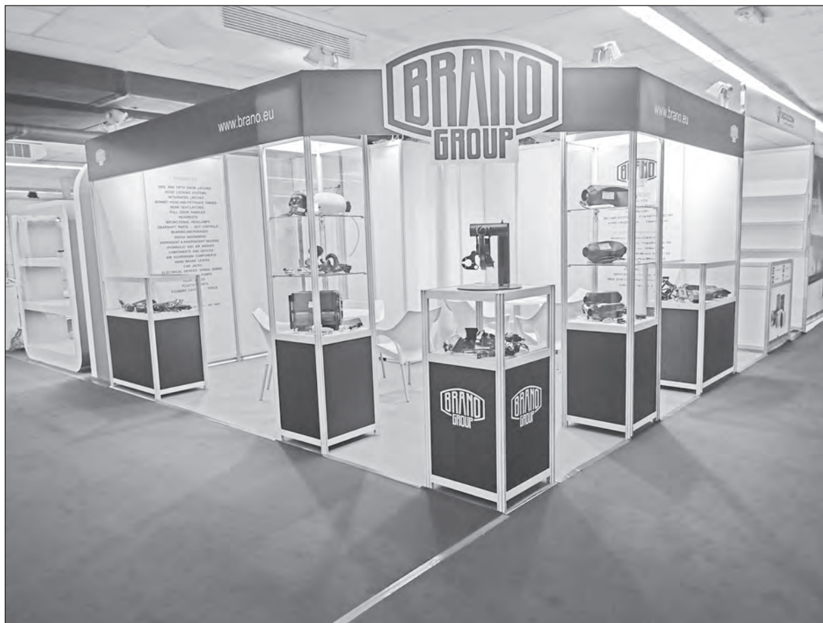
Stánek BRANO GROUP v Srbsku. Rohové pojetí je výhodné

Na stánku BRANO GROUP bylo živo, hlavně se projevil zájem o nezávislá topení, v tomto roce enormní. Také zájem o zvedáky a tlumiče byl vyšší než v minulých letech a podařilo se podchytit tři firmy k dalšímu jednání o zastupování naší značky na srbském trhu, což by bezesporu byl další velký krok pro prodeje v tomto regionu.