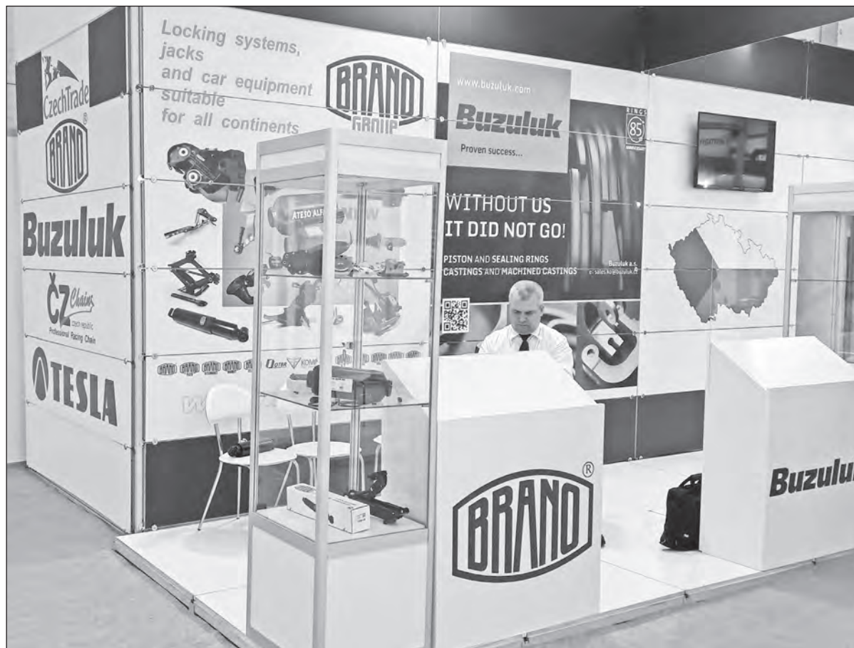
Prezentace BRANOMARKET s.r.o. v Istanbulu

Celkově jsme s účastí na AUTOMECHANICE spokojeni. Byl jsem