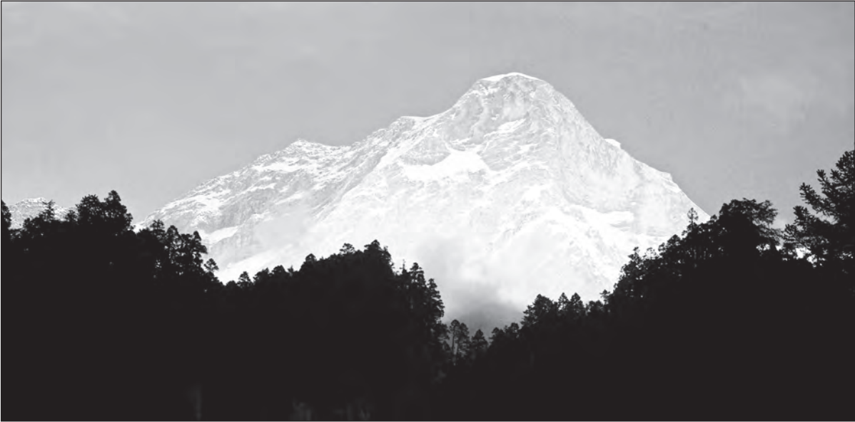
Nepál a pohoří Himálaj. Takový pohled opravdu nikdy neomrzí. Horské štíty jsou úchvatné