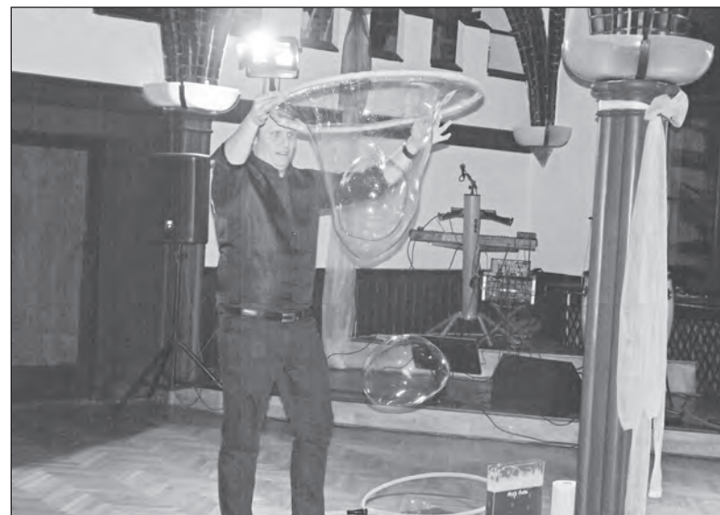
Bubble show a mistr světa