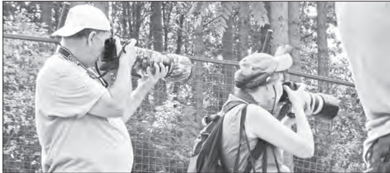
Výběh makaků a pracovní soustředění. I takový pohled je zajímavý