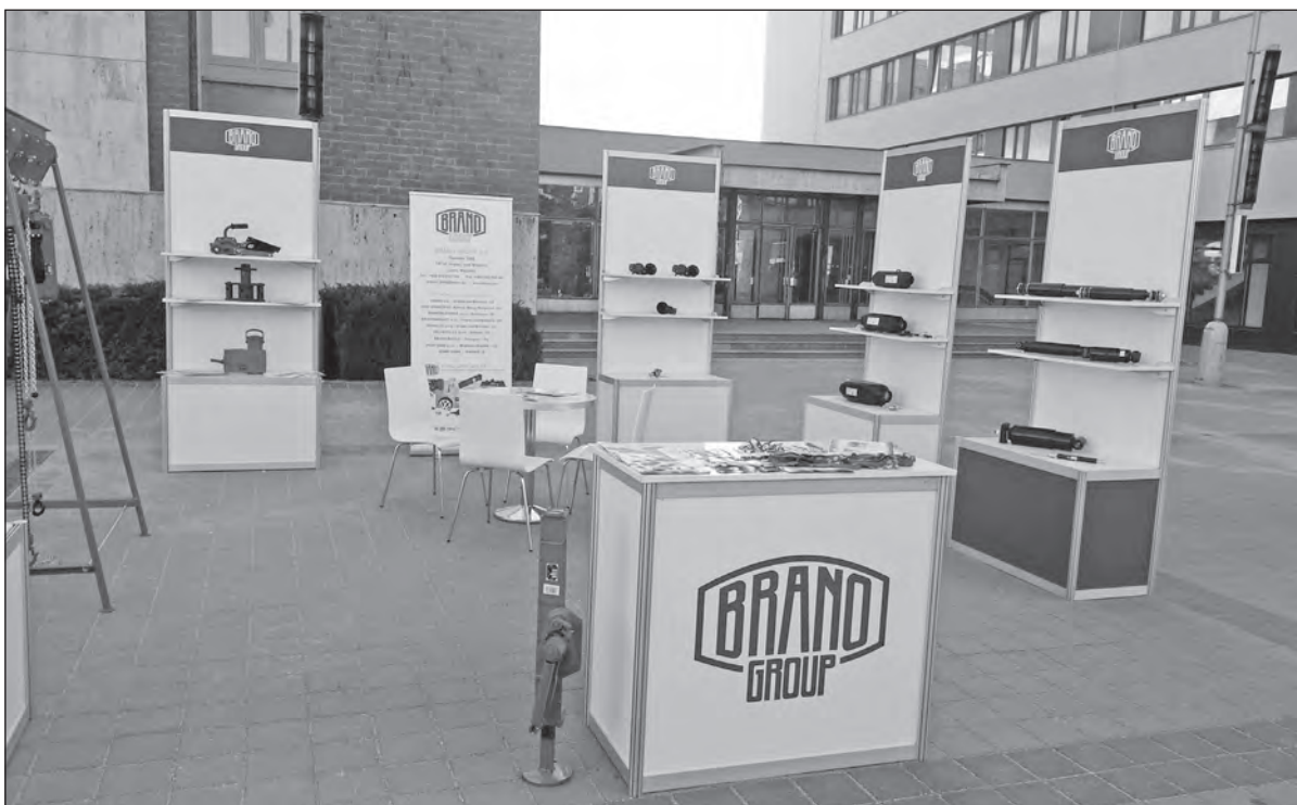
Společný prezentační stánek SBU ZZ a SBU CV ve Vyškově