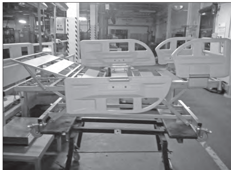
Nemocniční lůžko Linet