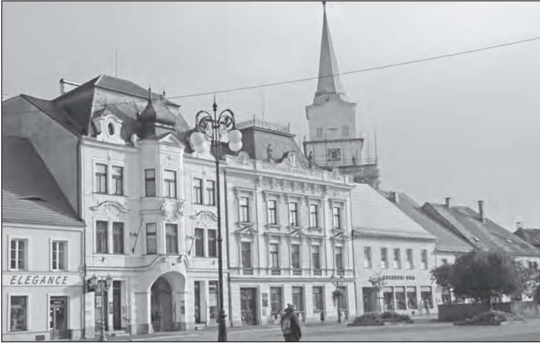
Historické náměstí s barokní radnicí

Rokycany leží v západních Čechách jen asi 17 kilometrů od Plzně. První zmínka je již z roku 1110 a jedná se o bývalé královské město. Při pobytu na Plzeňsku stojí za to se zde zastavit.