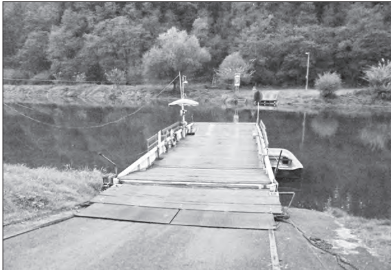
Plavba přívozem je pohodlná