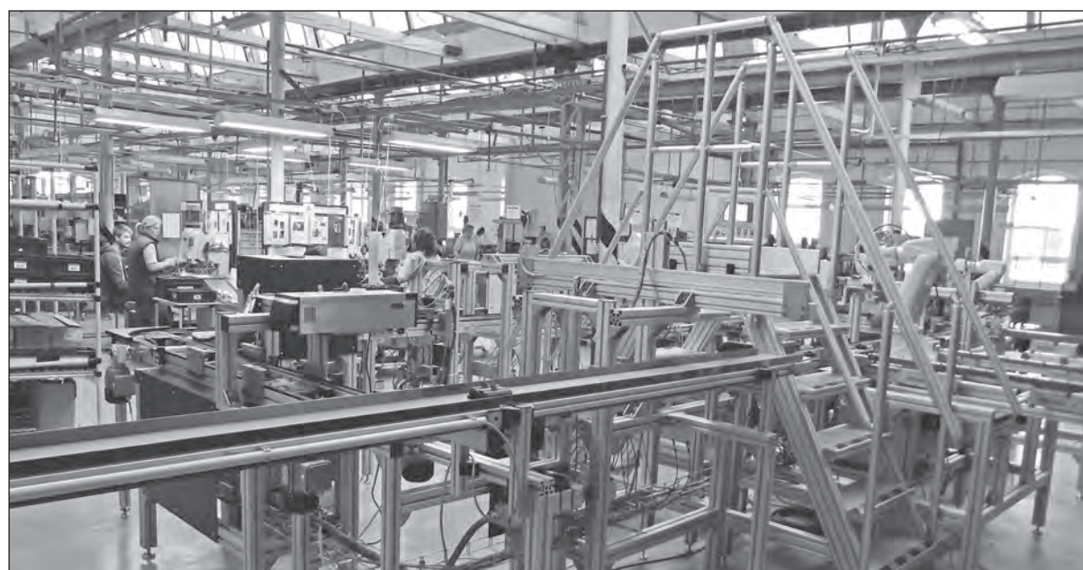
Linka KHD 13 na SBU DS patří k nejmodernějším