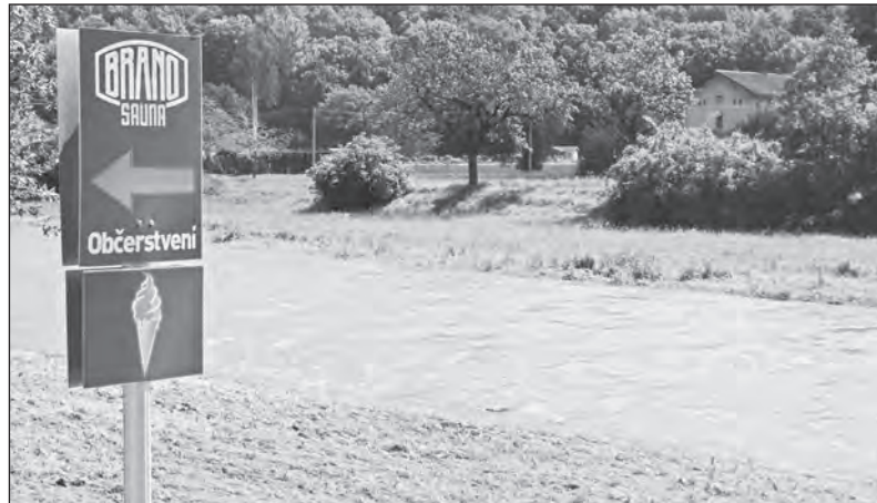
Začalo jaro. Co takhle procházka podél Moravice, okolo BRANO a.s. a s občerstvením v sauně?