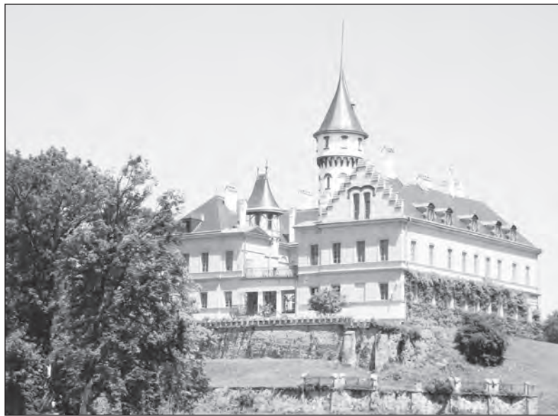
Kousek od Hradce nad Moravicí leží Raduň, kde je rovněž nádherný zámek. Hlavní zámecká sezona začíná 8. května. Vedle zámku bude přístupná i oranžerie a zámecký park