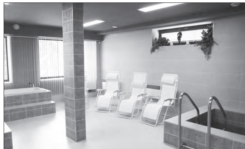
Hostům hotelu je k dispozici rovněž wellness

Program Odbory Plus, který je realizován odboráři na celostátní úrovni, nabízí svým členům různé výhody. V rámci cestování s Odbory Plus je do programu zařazena rovněž možnost rekreačního pobytu