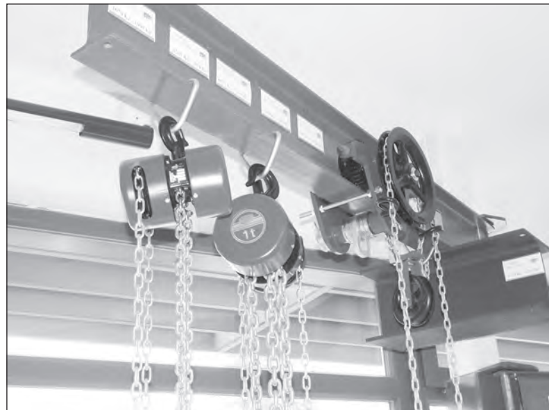
Před 65 lety, tedy v roce 1951, byla zahájena výroba ručních kladkostrojů