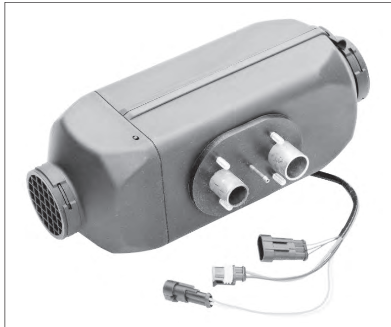
Nový model topení z produkce SBU CV Jilemnice