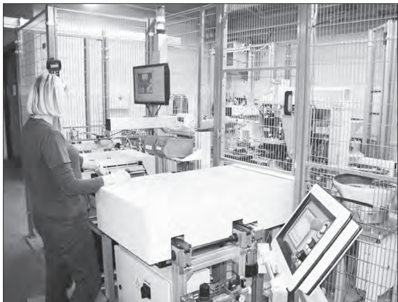
Práce je nyní v Rakovníku víc než dost