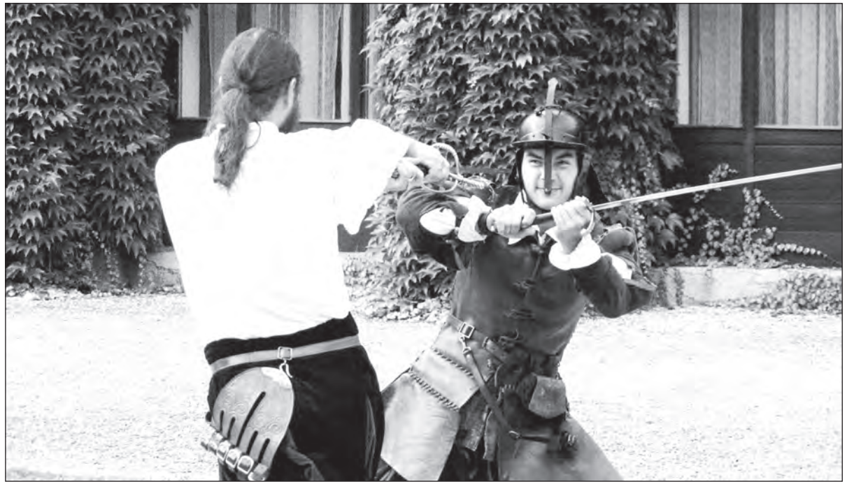
V areálu hradeckého zámku lze zažít vskutku zajímavou podívanou