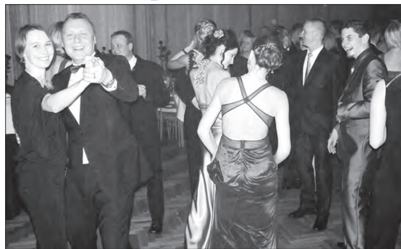
Úsměvy na tváři hovoří za vše