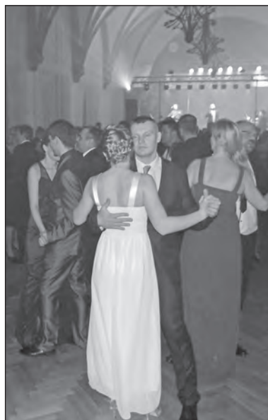
Tanec prostě vládí