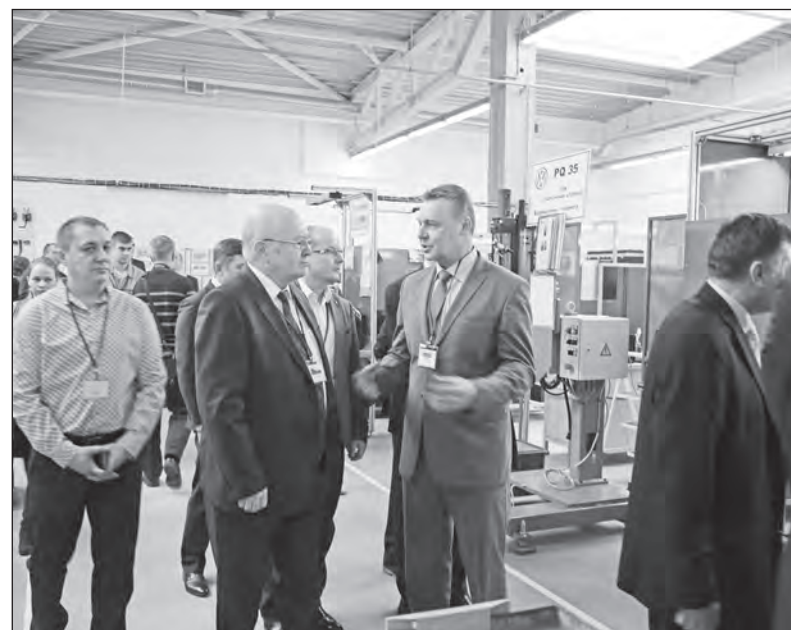
Při prohlídce nového závodu

„Historie vztahů mezi Českou republikou a krajem Nižný Novgorod je dlouhodobá a produktivní. Pevně doufám, že i přes některé vnější obtíže, se naše spolupráce bude dále vyví-