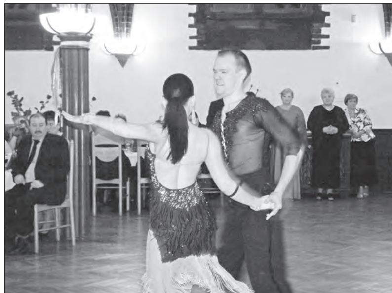
Taneční mistři ukázali, že umí