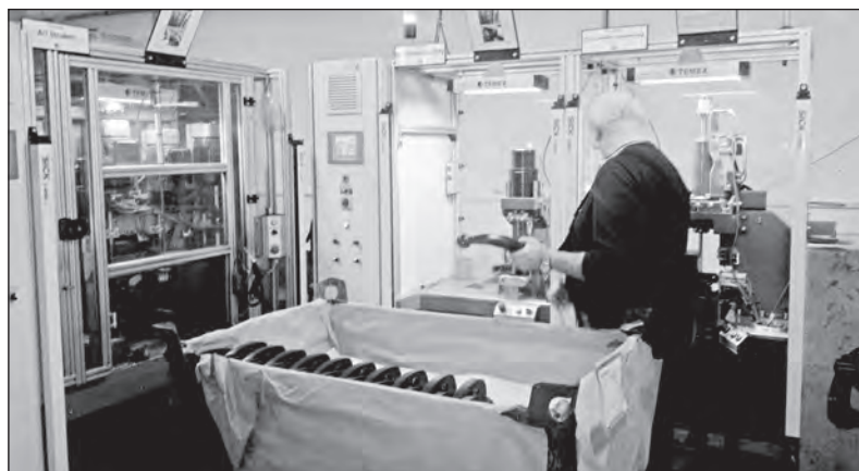
Pohled na část současného provozu PROF SVAR