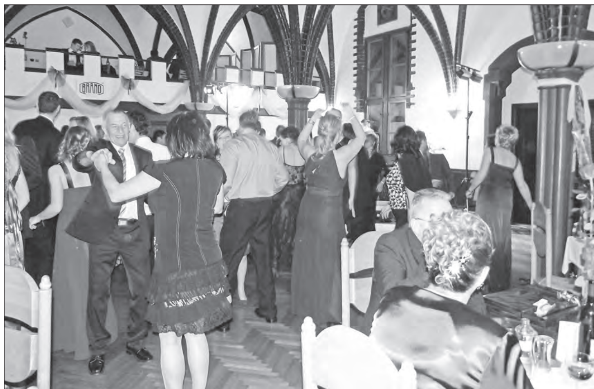
Lidé se skvěle bavili po celou dobu konání plesu