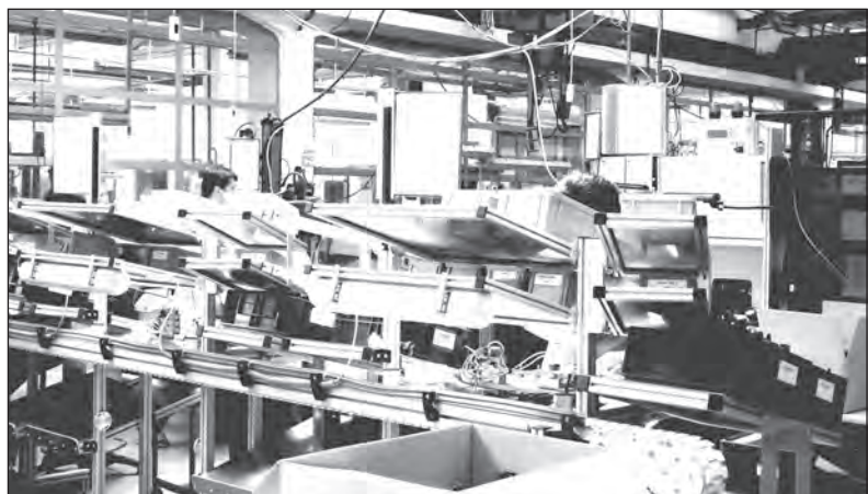
Linka zámků Alfa na SBU DS