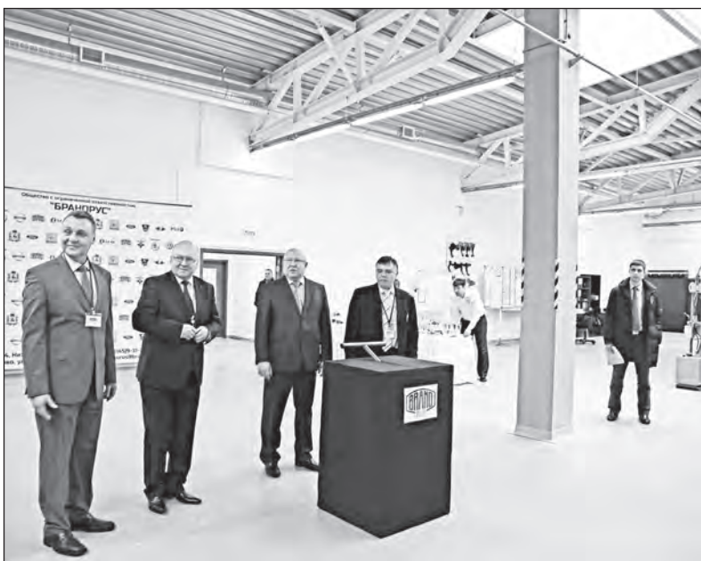
Krátce před oficiálním „spuštěním“ provozu

Největší investiční akce BRANO GROUP v minulém roce je definitivně ukončena. Ve čtvrtek 4. února došlo ke slavnostnímu oficiálnímu otevření nové haly BRANORUS v Rusku, která se nachází v Kstovu, oblast Nižného Novgorodu.