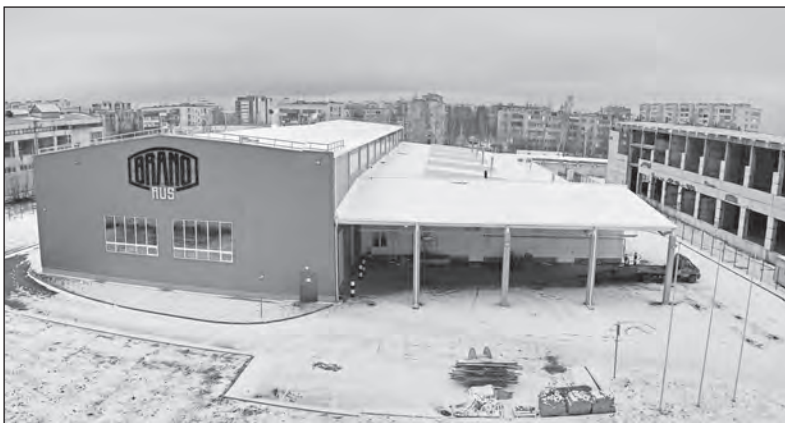
Tady už má objekt nějakou tvář