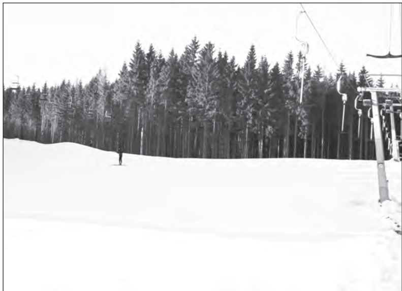
Svazek kousek od hotelu BRANS v Malé Morávce. Výborné lyžařské podmínky