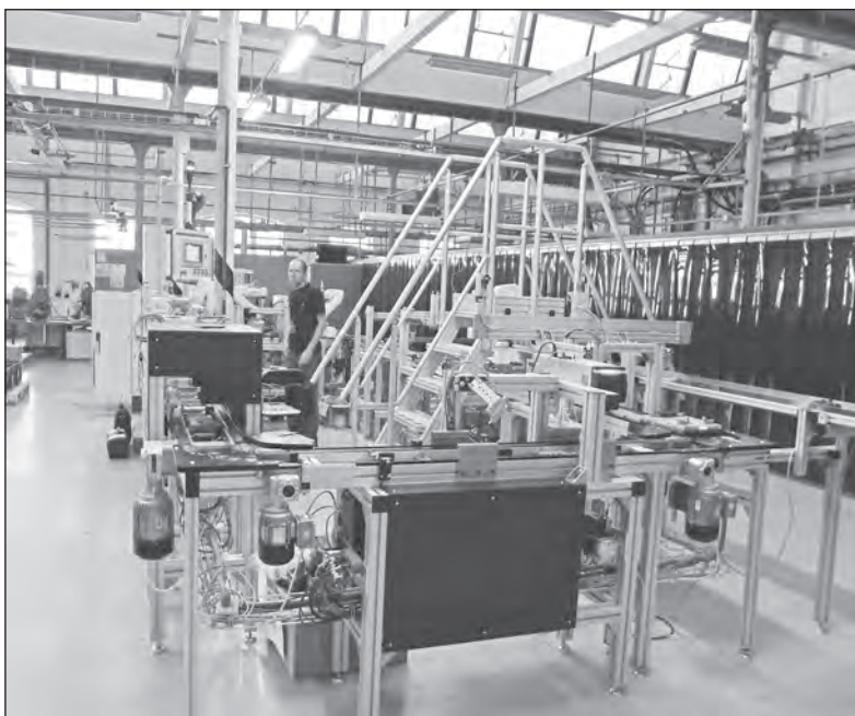
Linka KHD 13, jedna z velkých změn roku 2015