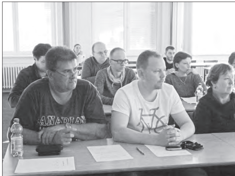
Delegáti odborové konference