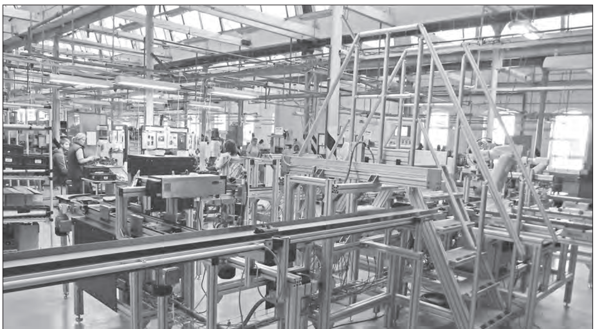
Moderní linka KHD 13 na SBU DS