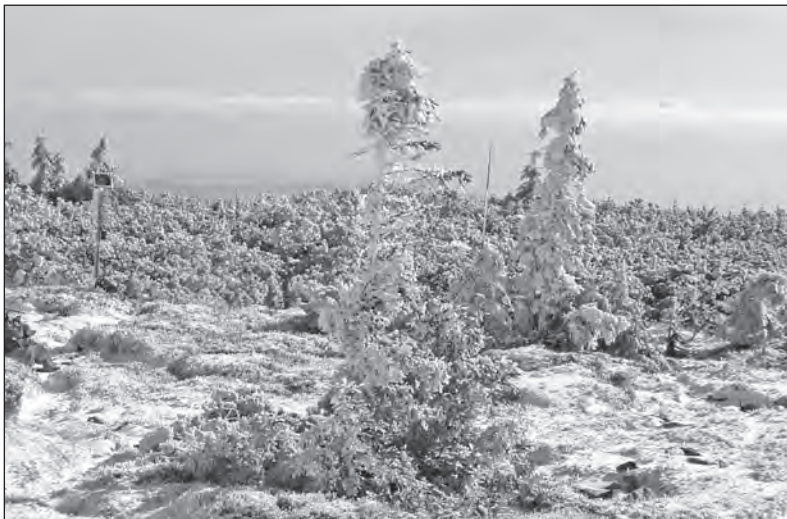
Na hřebeni Jeseníků

I přes mírný dotek civilizace, je okolní jesenická krajina velmi nádherná. Vzhledem k nadmořské výšce můžete mít krásný rozhled na blízké i vzdálenější hřebeny a vrcholky. Prakticky se jedná o ideální místo pro rodinnou dovolenou s dětmi, a to vlastně v kteroukoliv roční dobu. Pokud jsme se zmínili o křižovatce tras, je dobré si připomenout, že se nejedná vůbec o nadsázku. Možnosti je celá řada. Pěší turisté tady vyrážejí na Skřítek, Mravenčík, Keprník, Ovčárnu, Ramzovou, Karlovu Studánku, k přečerpávací nádrži Dlouhé Stráně, případně na Naučné stezky Bílá Opa a Velký kotel. Po červené turistické značce se po hřebeni dá dobře dojít až na nejvyšší horu Jeseníků Praděd (1492 m n. m.) a odtud eventuálně pokračovat přes Ovčárnu do lázeňského střediska Karlovy Studánky. Pokud však mohou doporučit, je dobré se projít Naučnou stezkou Keprník - Šerák. Začíná přímo na Červenohor-