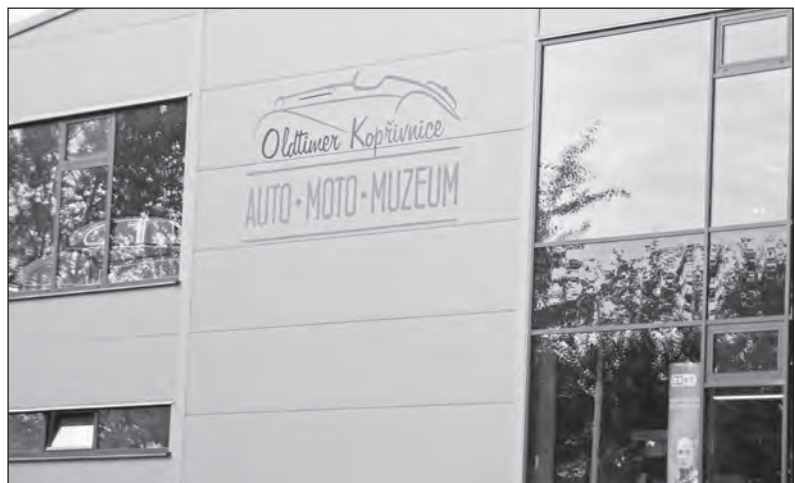
Nedávno otevřené soukromé muzeum v Kopřivnici. Nejen Tatrou zde žije!