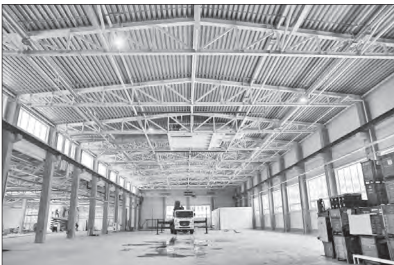
Pohled na výrobní halu