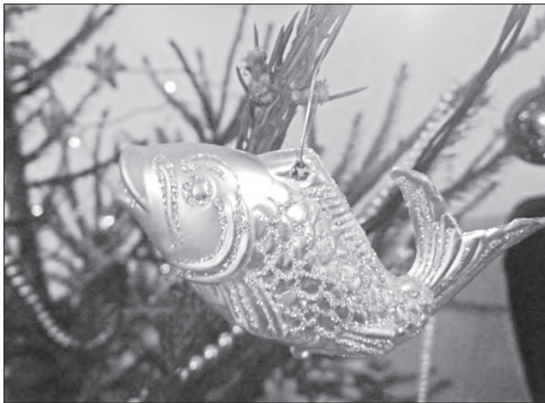
Zlatá rybka prý plní přání. Tak si do roku 2016 něco přejte.

Fotograf mlčel. Když odcházel, řekl: „Velmi děkuji, večere byla vynikající. Máte zřejmě velmi kvalitní hrnce...“