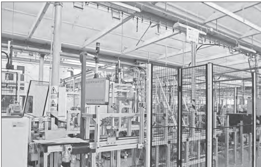
Nová tvář části haly SBU DS