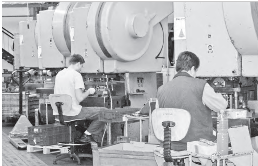
Historický pohled na již neexistující lisovnu