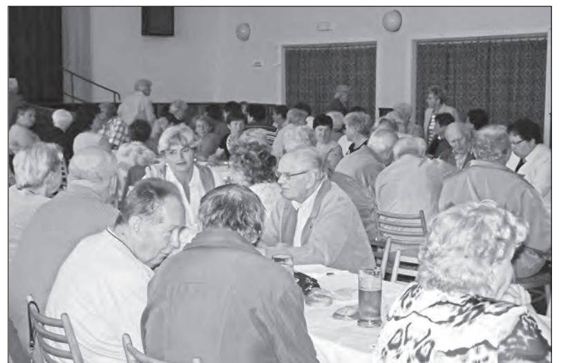
Snímek přibližuje loňské setkání

Ani v letošním roce se nezapomíná na pravidelné setkání důchodců – bývalých zaměstnanců BRANO a.s. v Hradci nad Moravicí. Tentokrát