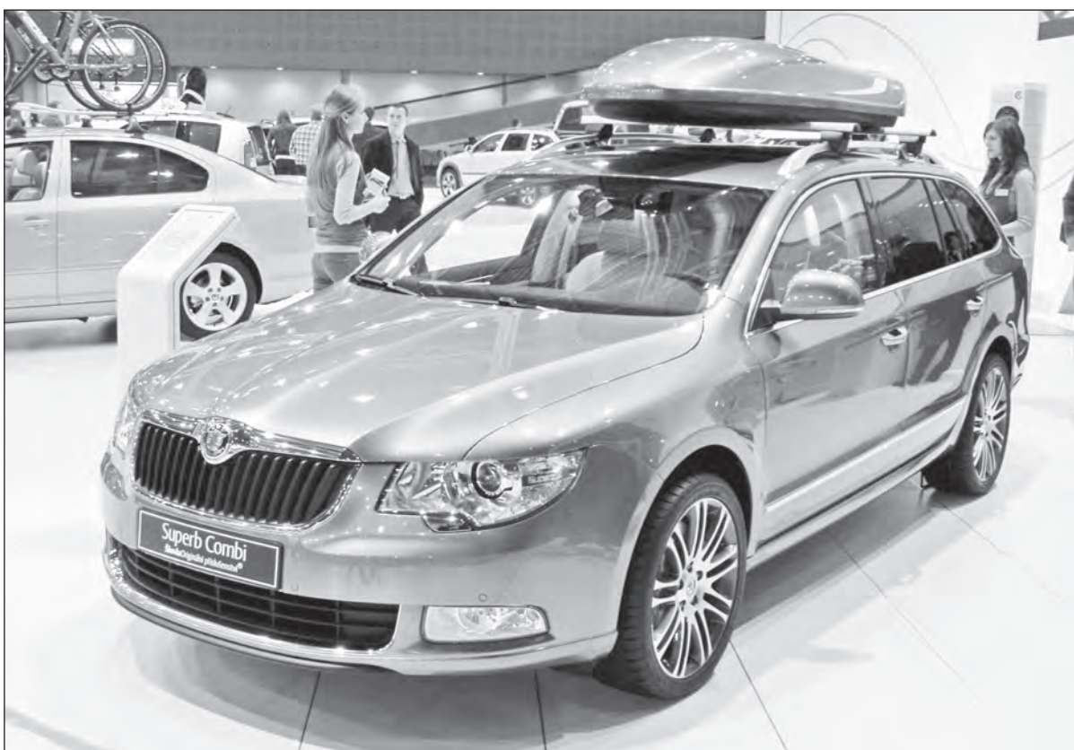
V minulosti mohli návštěvníci na brněnském výstavišti vidět například vůz Superb Combi