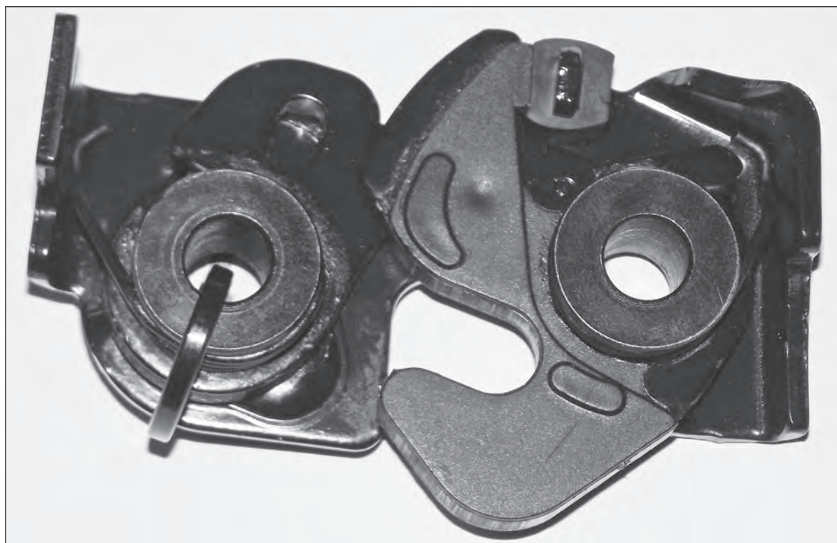
Jedním ze stěžejních produktů je dvacetiprocentní zámek

Dobře se rozjíždí také stávající projekty. V roce 2016 dojde u zámku Alfa 940 k navýšení výroby, a to na celkové 2,2 mil. kusů za rok, což vyžaduje investice do nástrojů a výrobní linky. K navýšení příští rok dojde také na lince PL7 (dvacetiprocentní