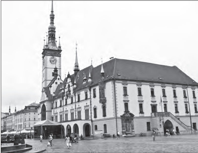
Historické centrum dokáže zaujmout

Miroslav Pospíšil