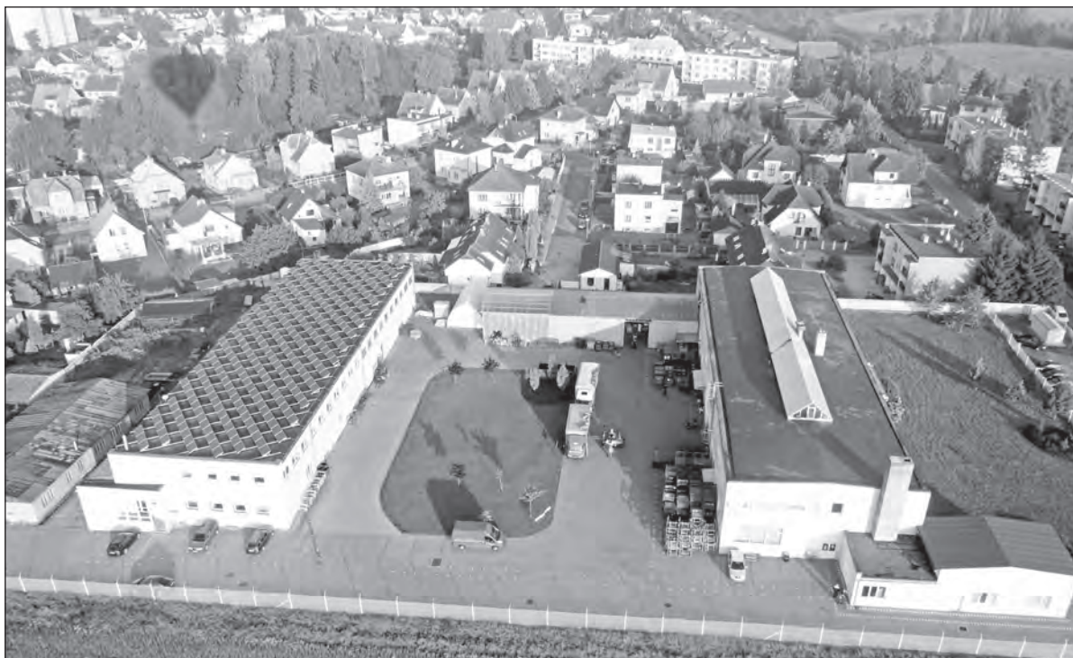
Sídlo společnosti PROF SVAR v Mnichově Hradišti