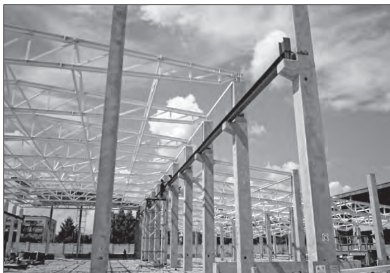
Práce na výstavbě nového závodu BRANORUS v Rusku pokračují. Takto vypadala stavba na počátku léta. Hotová by měla být letos na podzim