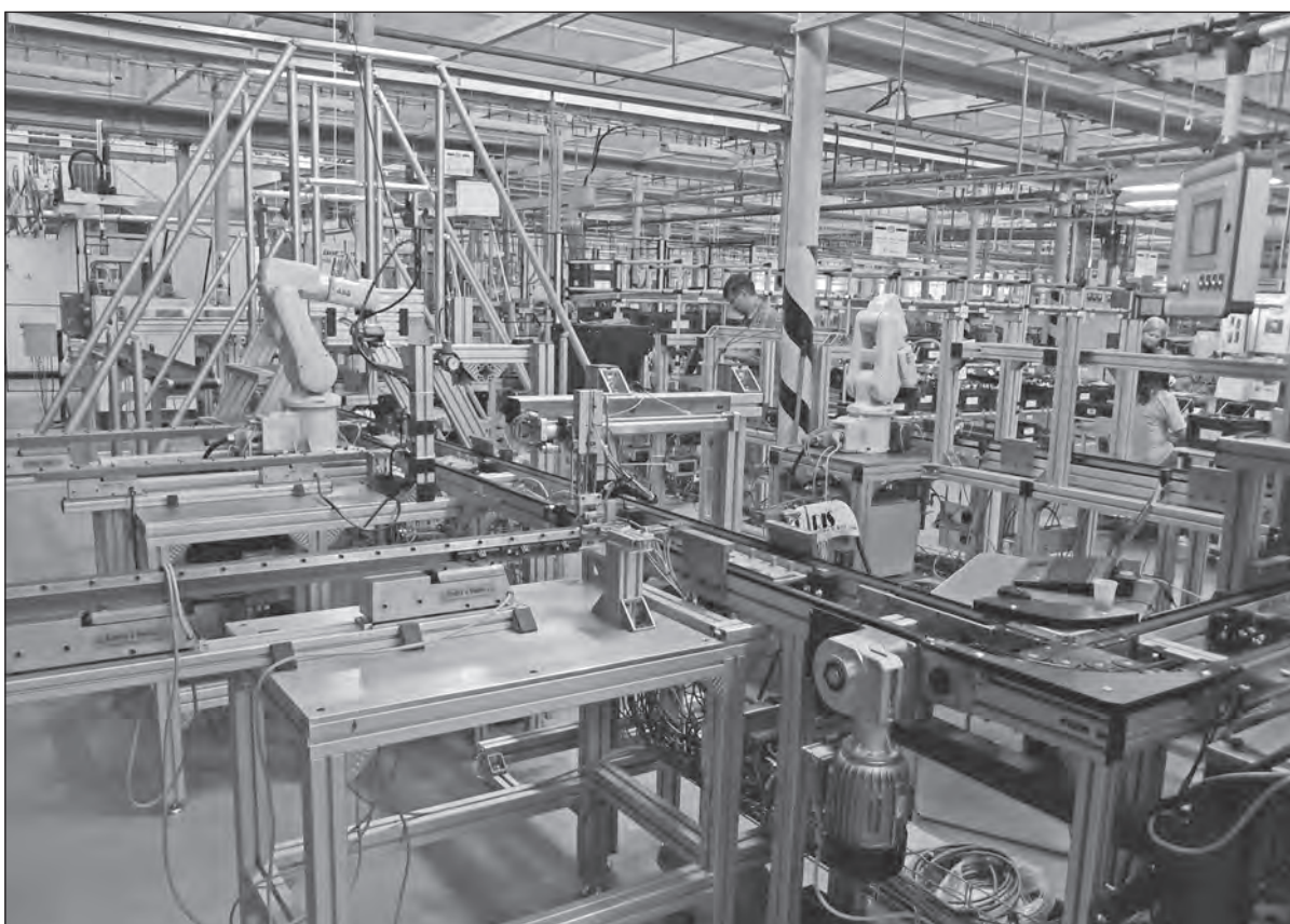
Celkový pohled na moderní linku KHD 13