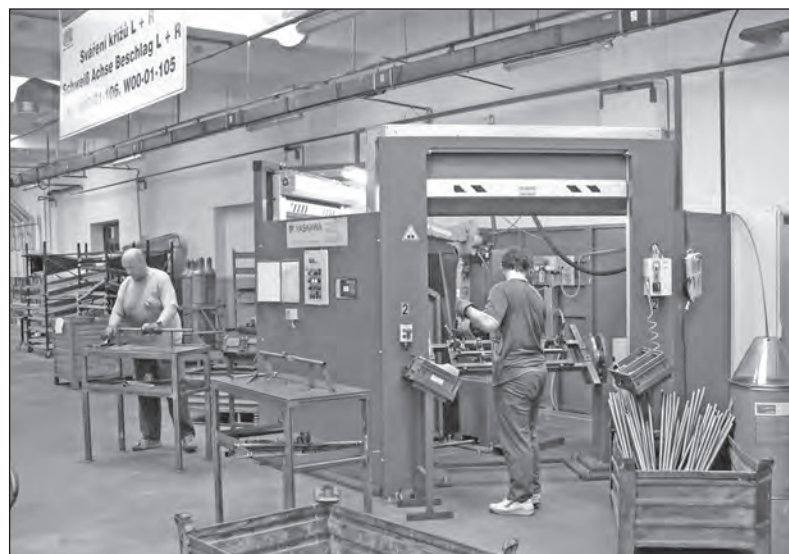
Příprava zařízení pro výrobu podélníků Linet