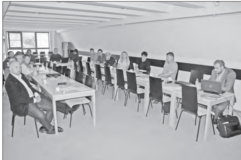
Pohled na účastníky konference nákupu