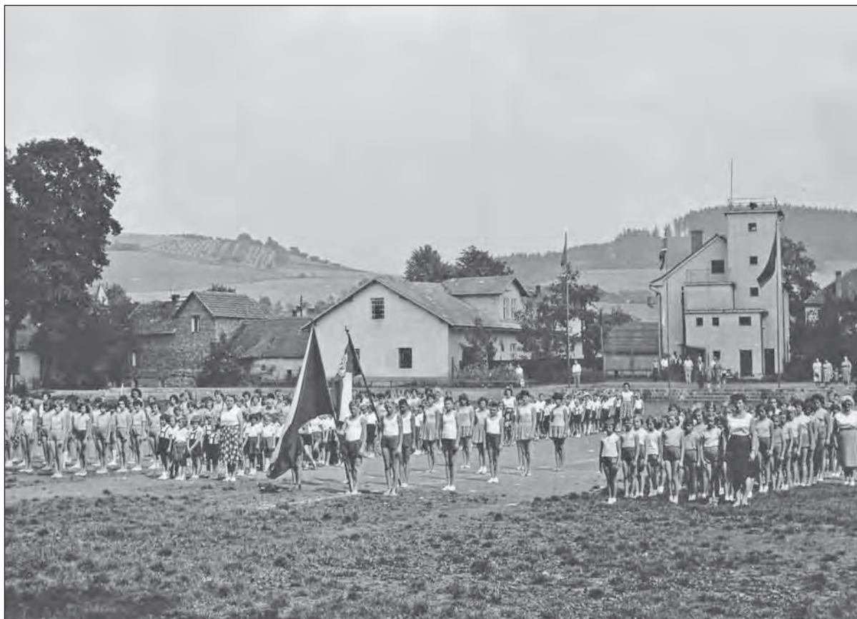
Při 100. výročí firmy BRANO v roce 1962 proběhla v rámci oslav sportovní slavnost. Jak je vidět na snímku, za hojné účasti mládeže