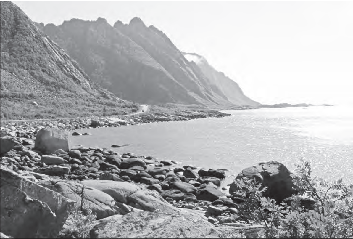
Za severním polárním kruhem. Souostroví Lofoty, nádherná příroda, která láká mnohé cestovatele. Všechny zdejší ostrovy jsou velmi hornaté a s velkým počtem fjordů. Největší ostrovy jsou spojeny mosty