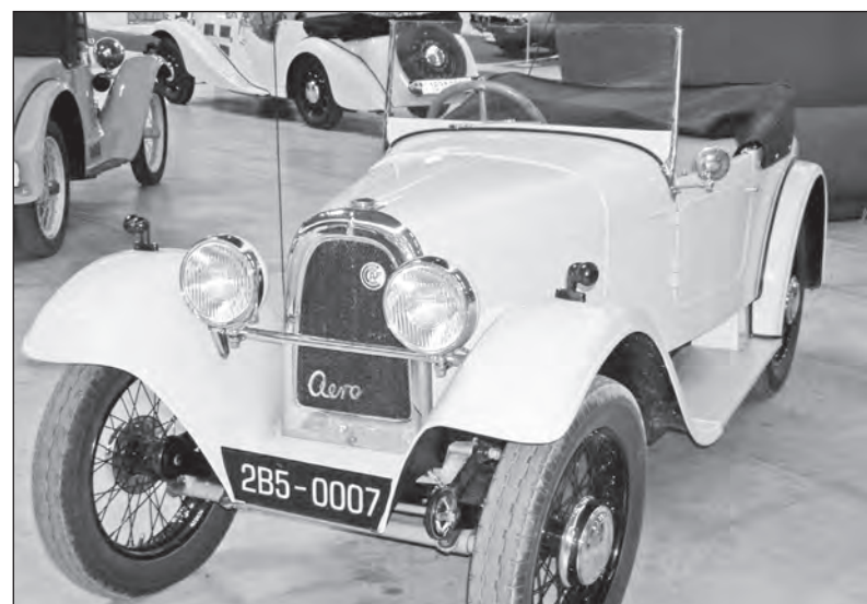
Vůz Aero, kdysi slavná značka

Patrně málokdo ví, že první kroky, či vlastně krok, rodičů se českých automobilových dějin začal již před 200 lety. V roce 1815 předvedl veřejnosti Josef Božek v pražské Stromovce svůj parní vůz. Jednalo se zároveň o jeden z prvních takových strojů v Evropě.