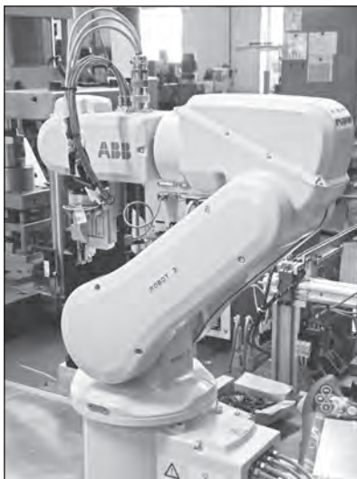
Jeden z robotů na nové lince KHD 13, která je na SBU DS