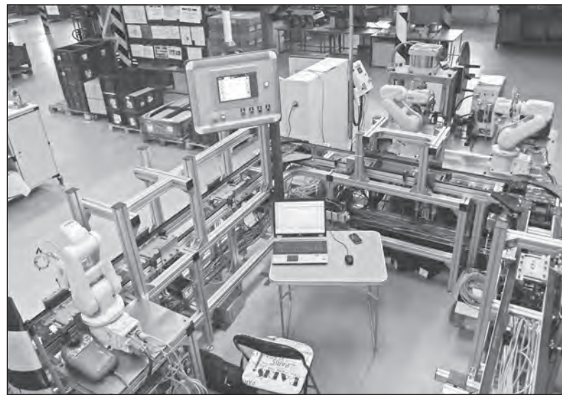
Linka z pohledu, tzv. zevnitř