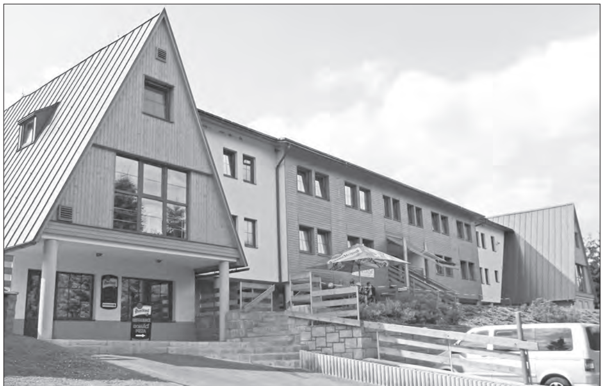
Kdo sem zavítal na Borůvkové hody, jistě nelitoval