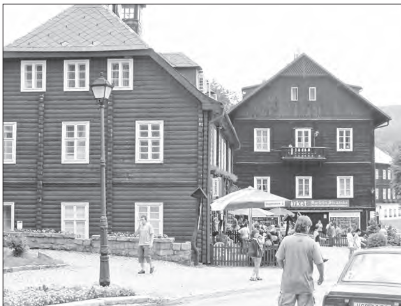
Typické domy Karlovy Studánky

Zdejší lázně se specializují na nemoci dechového ústrojí, některá onkologická onemocnění, cévní nemoci, nemoci pohybové, páteřní a kloubní. Pacientům je nabízena komplexní lázeňská léčba, příspěvková lázeňská