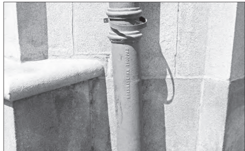
Okapová roura Obecního domu v Opavě, někdejší výrobek BRANO. Stavba je z let 1914 – 1918