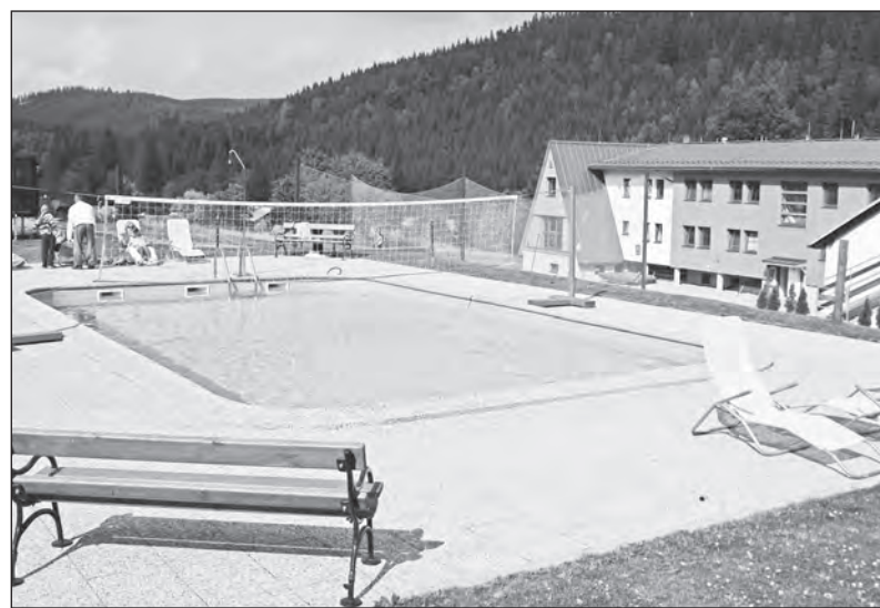
V létě je relaxace v bazénu příjemná