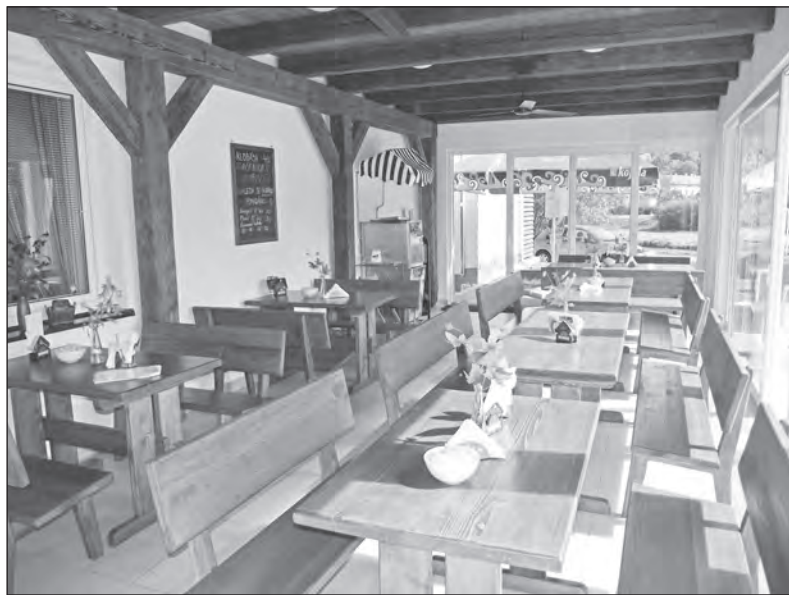
BRANO SAUNA s letní terasou nabízí osvěžení všem příchozím.