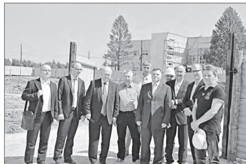
Na místě výstavby nového závodu