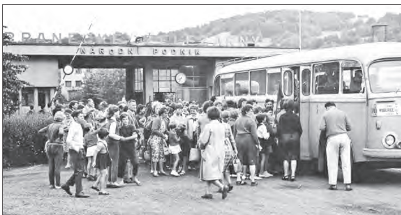
I takový vzhled měl vchod do areálu BRANO v Hradci nad Moravicí. Nahoře ještě bez nástrojárny