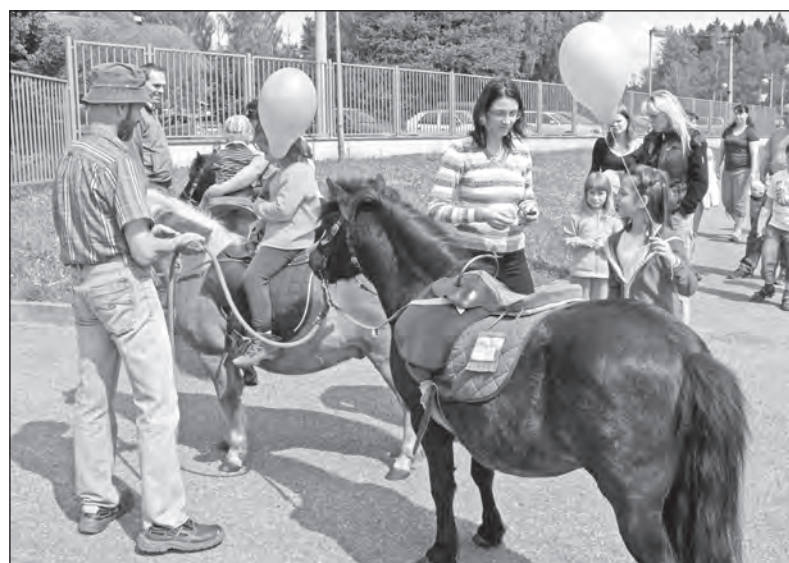
Takto se bavily děti v Jilemnici