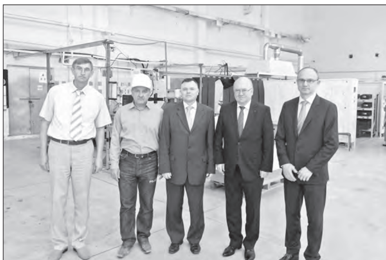
Při prohlídce výroby rámců sedaček

Velvyslanec České republiky v Rusku Vladimír Remek navštívil BRANORUS v Kstovu u Nižného Novgorodu. Prohlédl si zde stávající výrobní prostory, areál výstavby nového závodu a zavítal rovněž na radnici v Kstovu. „Den před setkáním proběhla Podnikatelská mise v Nižném Novgorodě. Této příležitosti jsem využil a Vladimíra Remka jsem pozval já. Návštěvu Kstova a našeho závodu jsme plánovali již loni, když jsme se setkali na velvyslanectví v Moskvě, kde proběhla prezentace firem Niž-