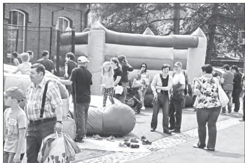
Atmosféra pátečního odpoledne ve fotografiích