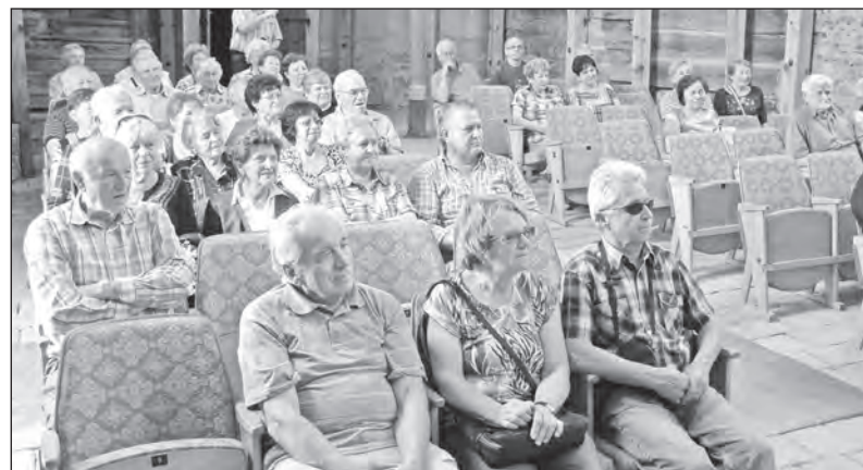
Senioři z Jilemnice na své letošní akci

Následoval oběd v Kongresovém centru ALDIS v Hradci Králové. Po malém odpočinku na terase, mají na