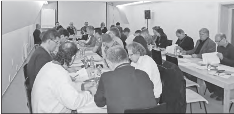
Záběr na jednu z dřívějších konferencí

Řádná konference ZO OS KOVO BRANO Hradec nad Moravicí je naplánována na polovinu května. Zároveň se v těchto dnech připravuje rozpočet základní organizace.