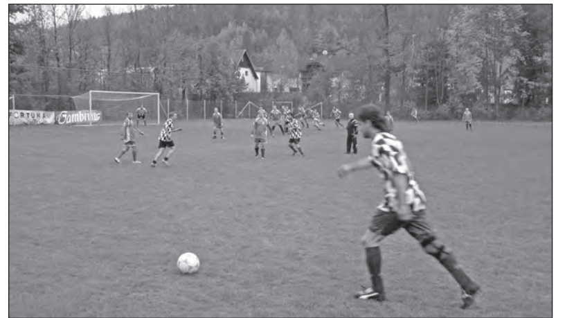
Ve sportovních i dalších aktivitách chtějí v SBU CV pokračovat