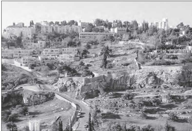
Jeruzalém – pohled na město

Město leží v Judských horách, na hranici Středozemního a Mrtvého moře a na okraji Judské pouště. Slovo Jeruzalém v hebrejštině znamená Město pokoje (někdy taky Město Davido-vo), v arabštině pak To svaté město. Základem původního Jeruzaléma je Staré Město. Zde najdeme Chrámovou horu, baziliku Svatého hrobu a další památky. Společně s dochovanými hradbami je tato čtvrť zapsána do seznamu Světového dědictví UNESCO. Chrámová hora je nejposvátnějším