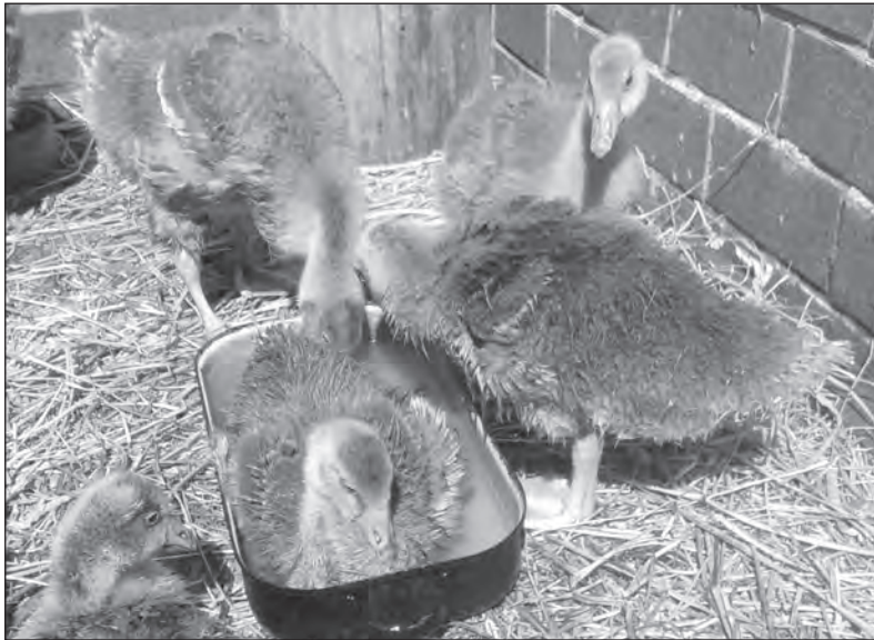
Už trénují na pekáč...