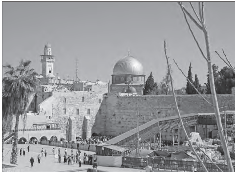
Svaté místo – Chrámová hora

místem judaismu a třetím nejposvátnějším místem islámu. Část západní stěny tvoří pověstná Zeď nářků. Na vrcholu Chrámové hory je mimo jiné Skalní dóm a mešita al-Aksa.