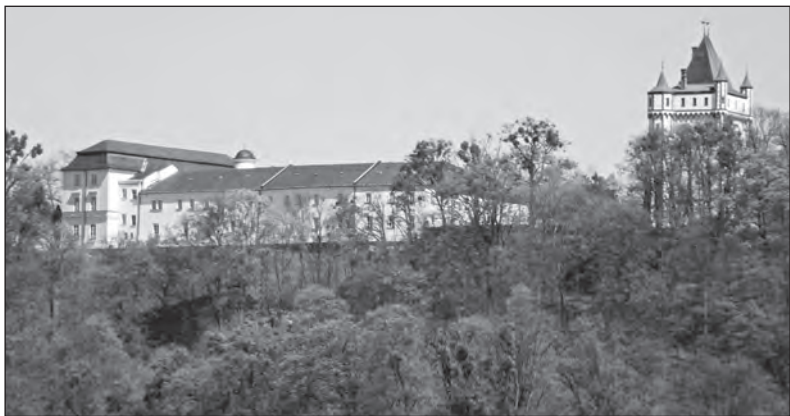
Nádherný zámek v Hradci nad Moravicí.