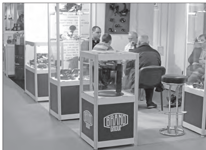
Jednání na braneckém stánku

BRANOMARKET rozšířil svou nabídku sortimentu. Počátkem dubna zařadil do prodeje nové nezávislé topení BREEZE IV a WIND IV. Zákazníci se s těmito braneckými výrobky mohou seznámit rovněž prostřednictvím e-shopu BRANOMARKETu. (mp)