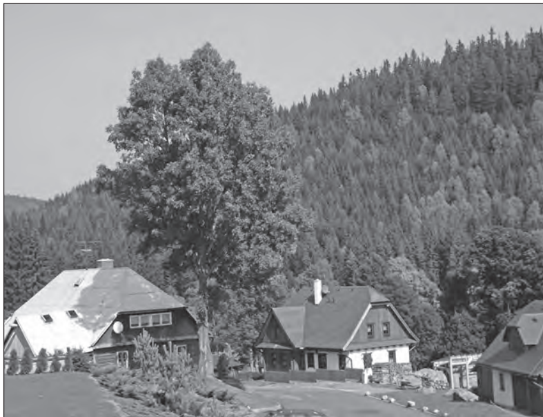
Malebné okolí hotelu BRANS v Jeseníkách