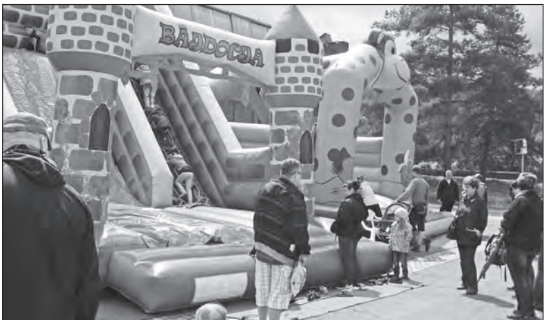
Den otevřených dveří spojený s Mezinárodním dnem dětí proběhne v BRANO a.s. v pátek 29. května.