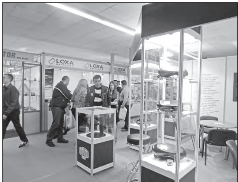
Stánek BG přilákal pozornost návštěvníků