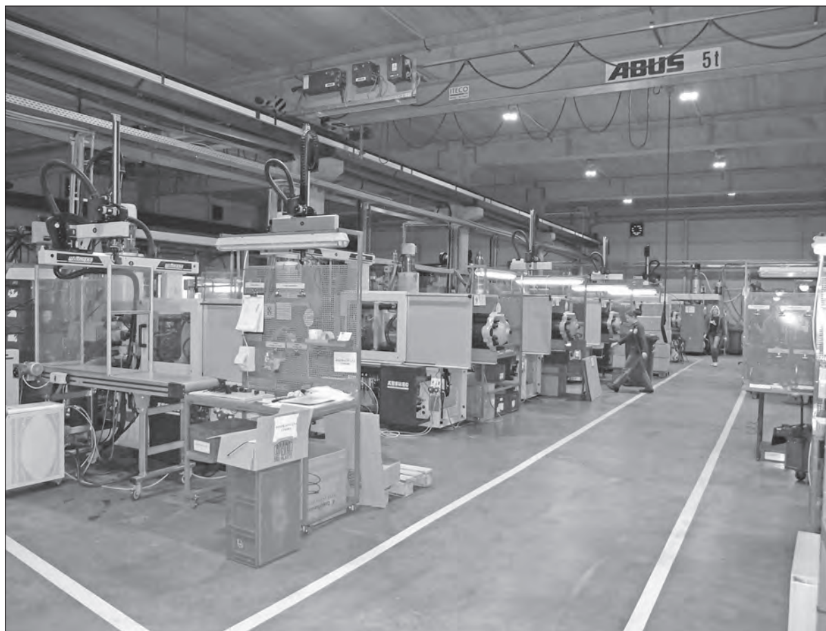
V Zubří již jsou mezi nejlepšími dodavateli VW