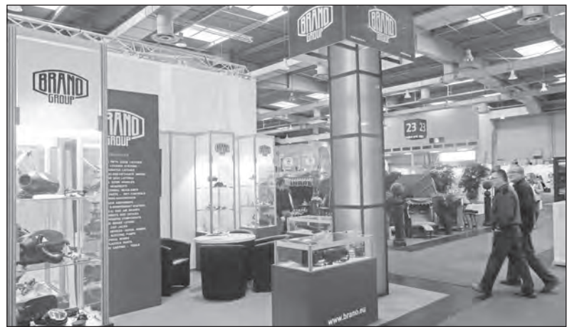
Tímto stánkem se prezentovala skupina BRANO GROUP v Hannoveru