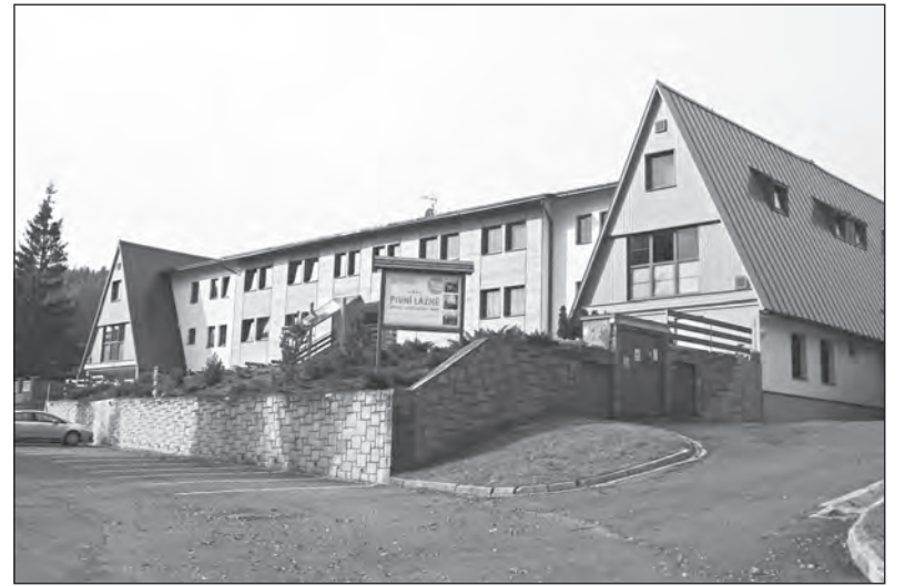
Hotel BRANS zaujme na první pohled

ji dopřejte. Milujete pobyt ve vířivce? Neváhejte a namočte své tělo do obřívany. Chcete vyzkoušet některý z parafrinových zábalů a jen tak v klidu chvíli ležet? I to se dá splnit. Vrcholem relaxační nabídky je pak pivní lázeň. Strávit nějaký čas v kádi s horkým roztokem a mít možnost si u toho i načepovat pivo, je docela lákavá představa. A což až ji vyzkoušíte naostro, a to doslova.