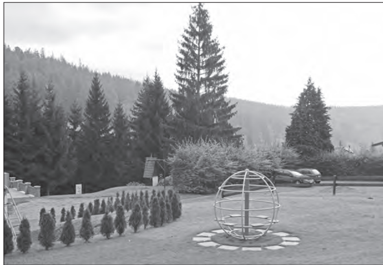
Pečlivě upravené okolí hotelu