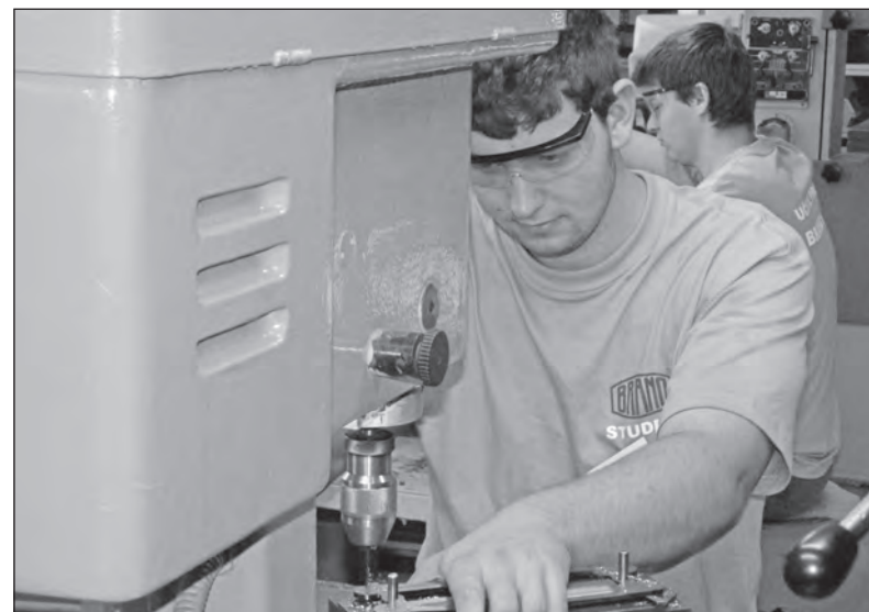
BRANO a.s. je jednou z firem, které se do podpory technického vzdělávání aktivně zapojují

a je to škoda. Ať už sportujete nebo máte nějakého zajímavého koníčka, dejte nám o sobě vědět. Upozorníte na své kolegy, o kterých by stálo za to napsat v novinách BG. Zajímaví lidé jsou mnohdy nesmíšní a jen pár zasvěcených ví o jejich nadání. Noviny BG dávají šanci jak poznat branečáky i z jiné stránky, než jen z té pracovní. Lidé, o nichž jste si zatím mohli přeciť, jsou toho dokladem. Napište na pospisil.mirek@seznam.cz. (mp)