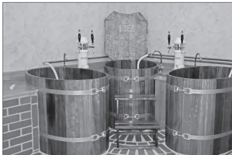
Pivní lázně pro celkovou relaxaci