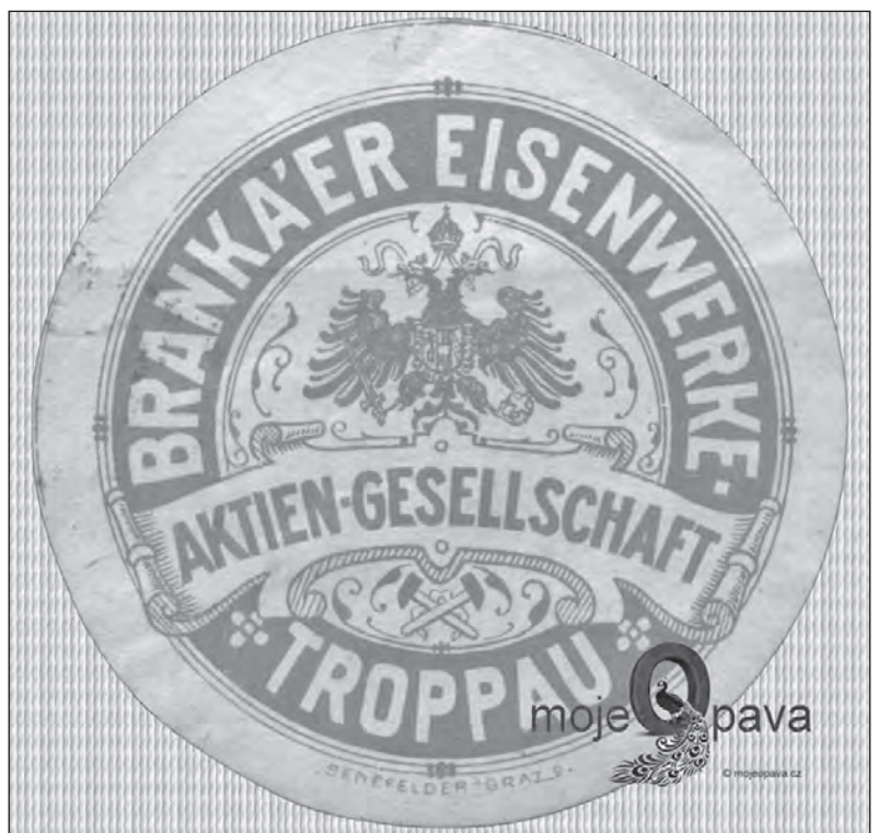
Pečeť BRANO z počátků existence firmy. Dokonale propracované a graficky zvládnuté