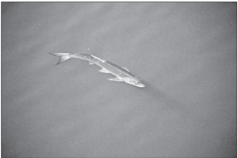
Bolen dravý ve vodách Kružberské přehrady. Tvor budící respekt a krásu