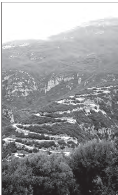
Jako had se klikatí horská cesta. Hory jsou zde nádherné