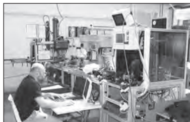
Magazín Autofox píše rovněž o zakázkách pro Jaguar. Na snímku linka Jaguar