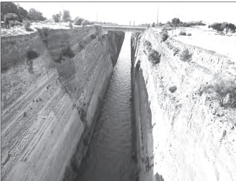
Korintský průplav spojuje Peloponés s řeckou pevninou