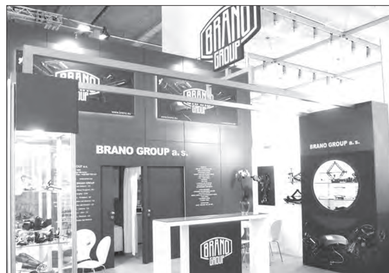
Prezentační stánek BRANO GROUP na veletrhu IAA

Na rozdíl od mnoha předchozích IAA Autosalonů jediné co letos zklamalo, bylo počasí, takové snad bylo