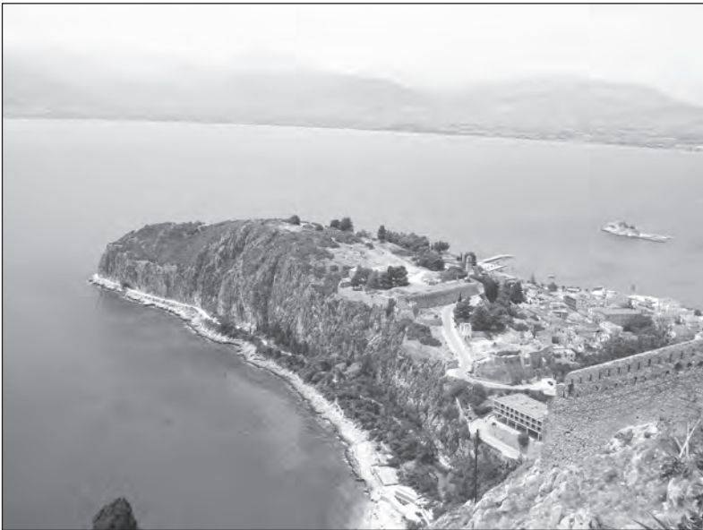
Pevninský výběžek do moře. No, není to pěkný pohled?