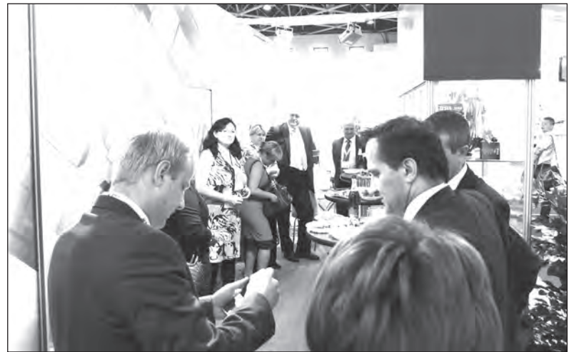
Společenské setkání na stánku BRANO GROUP