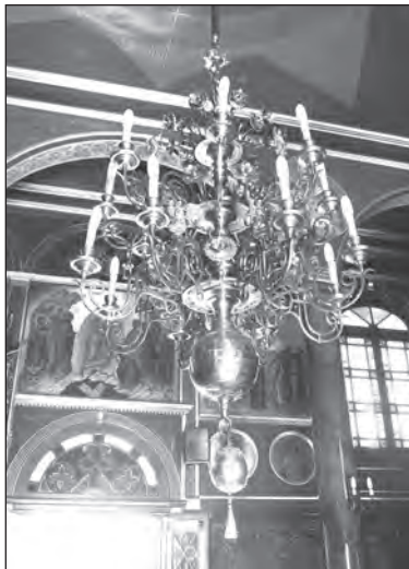
V pravoslavném chrámu. Výzdoba je přímo okouzlující, a to po všech stránkách