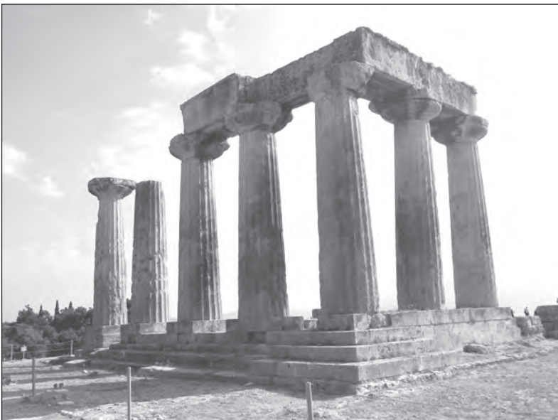
Zbytky antického chrámu. Takových památek je zde hodně