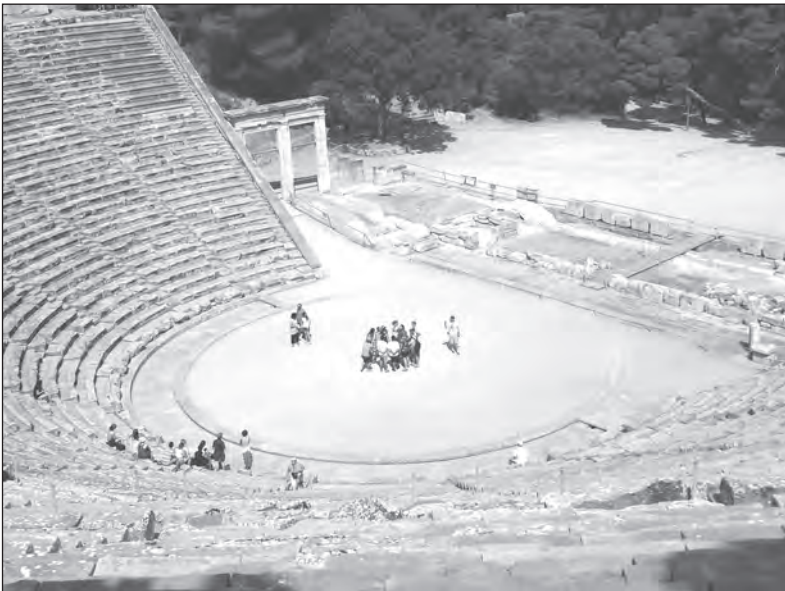
Amfiteátr - chcete být diváky nebo herci?