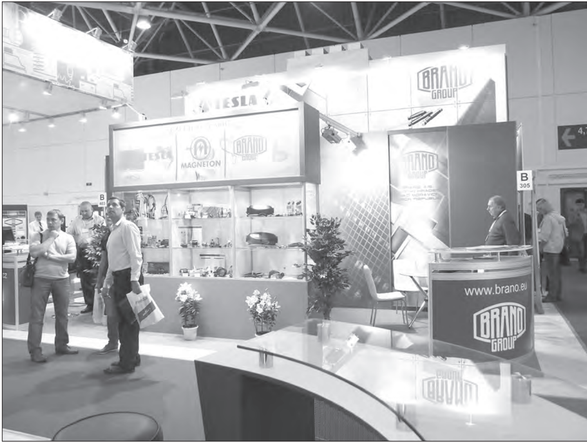
Opět nápadité pojetí prezentačního stánku BRANO GROUP v Moskvě