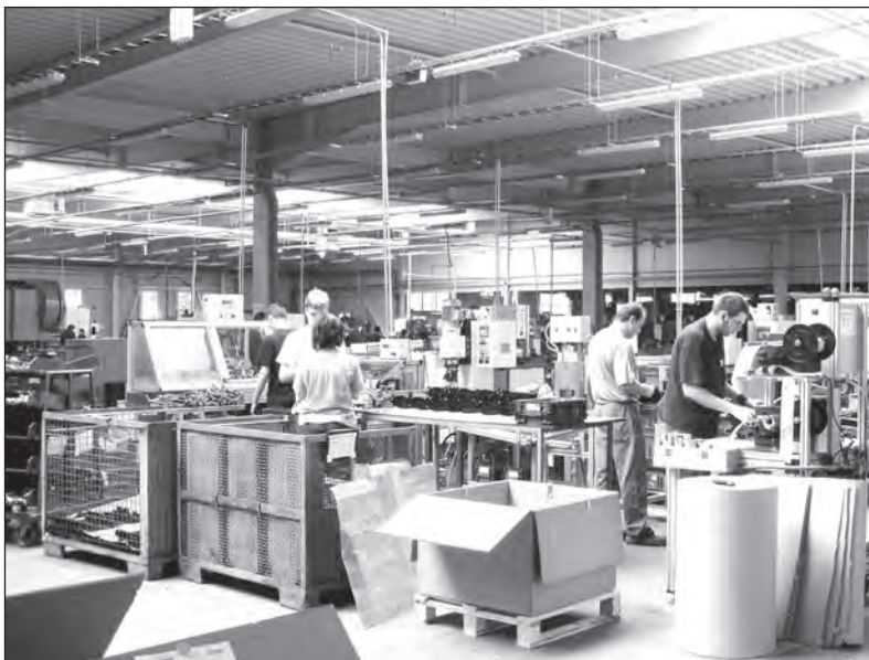
Kolektivní smlouva 2013 je plněna

Největší růst průměrné mzdy byl zaznamenán na SBU CJ (108,47 %), následuje SBU Plasty (107,78 %), SBU TOOLS (106,89 %), SBU CS (106,79 %), SBU CV (103,47 %), správa (102,28 %), SBU DS (102,01 %) a HS služby (101,95 %). K meziročnímu poklesu mzdy došlo na SBU ZZ (na 98,42 %) a výrazně na SBU Slévárna (na 93,23 %). Procentuel-