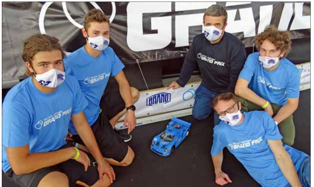
Členové soutěžního týmu se svým vozem