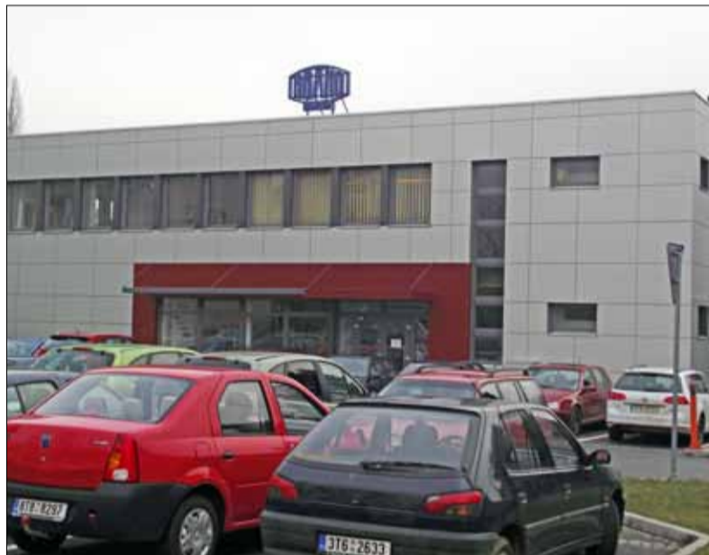
Branomarket má příští rok své výročí

Na rok 2021 připadá několik důležitých výročí z historie BRANO GROUP. Zde předkládáme jejich přehled.