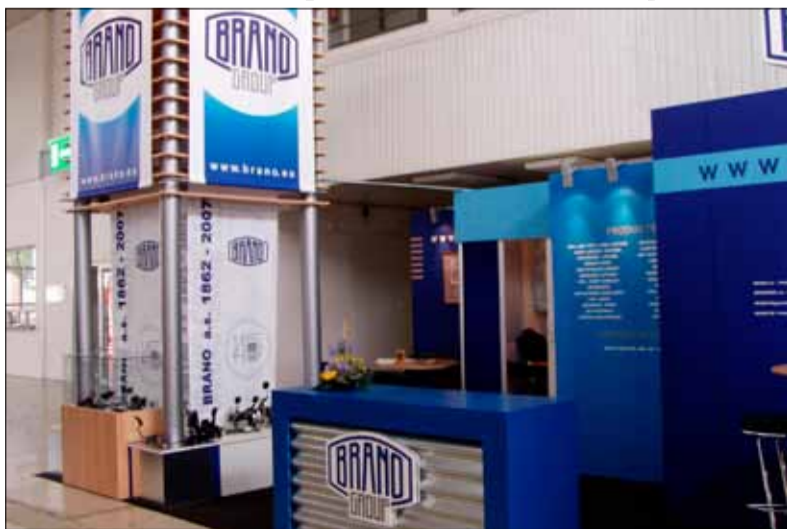
Na rok 2021 nejsou zatím v plánu žádné veletrhy, kterých by se skupina BRANO GROUP zúčastnila