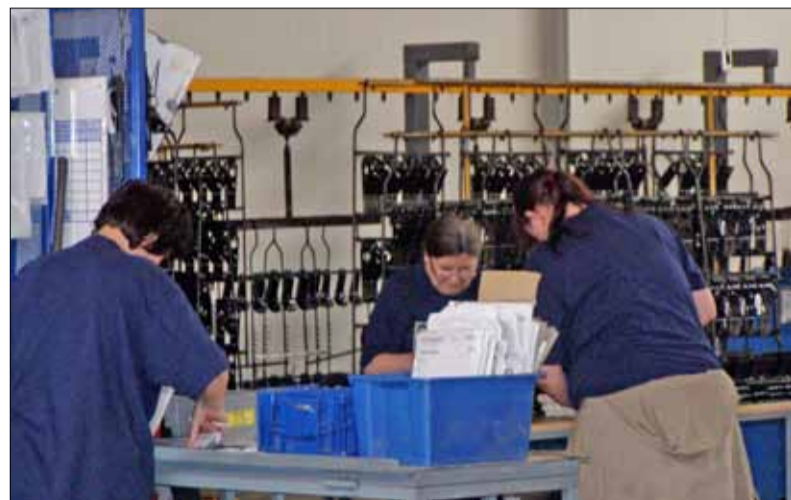
Kolektivní smlouva platí pro všechny zaměstnance