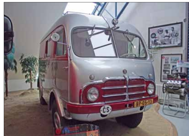
Expediční vůz Jiřího Hanzelky a Miroslava Zikmunda v Muzeu Tatra Kopřivnice