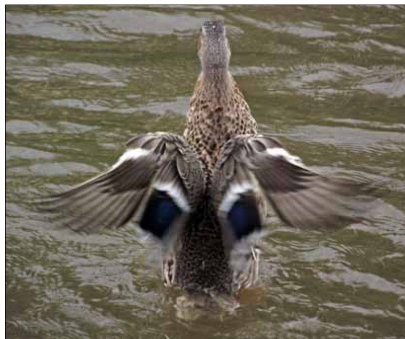
Když se tak v létě touláte kolem řeky a kachna se začne předvádět