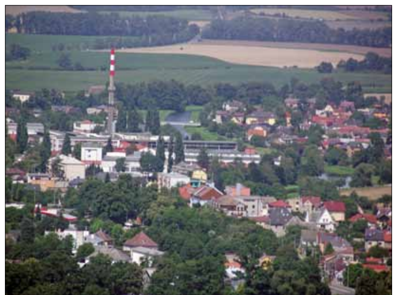
Areál BRANO a.s., Hradec nad Moravicí, Branka u Opavy. Pohled z Bezručovy vyhlídky v zámeckém parku se nikdy neomrzí. Máme to tady pěkné, kam jen oko dohlédne