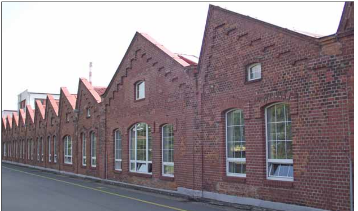
Historická tradiční výrobní hala v Hradci nad Moravicí