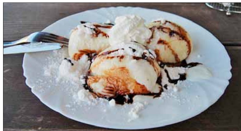
Borůvkové knedlíky, největší pochoutka

Borůvkových hodů se rok co rok účastní nejen náš hotel BRANS, ale společně s ním i dalších patnáct hotelů, penzionů a restaurací, a to v Malé Morávce, Karlově pod Pradědem a na samotném nejvyšším vrcholu Jeseníků Pradědu.