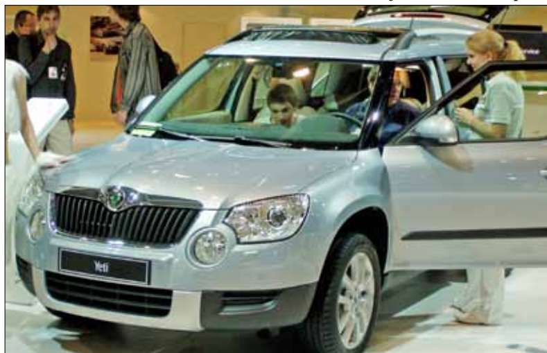
Yeti, jeden z vozů ŠKODA AUTO