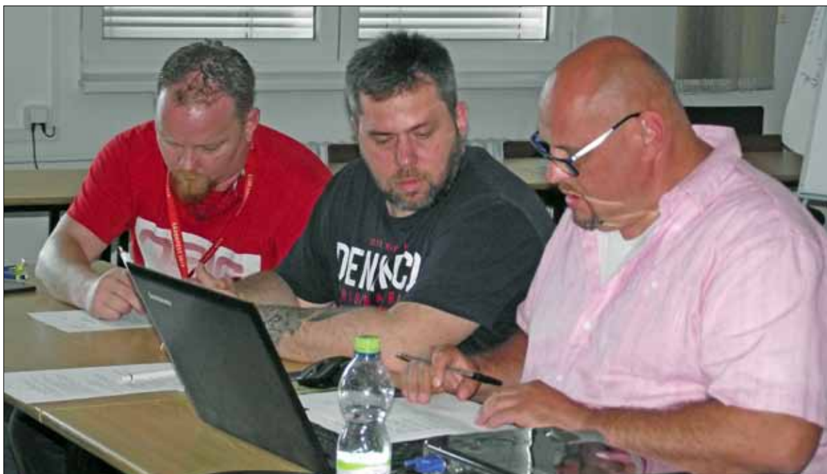
Pracovní předsednictvo konference