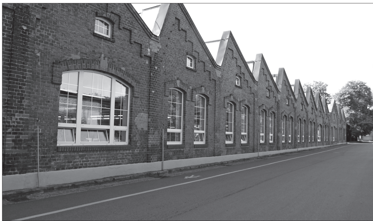
V celé skupině BRANO GROUP platí preventivní opatření

O co všechno se jedná? Platí zákaz vysílání lidí na služební cesty leteckým druhem přepravy. Zákaz vysílání lidí na služební cesty do rizikových oblastí. Zákaz přijímání návštěv s leteckým druhem přepravy. Zákaz přijímání návštěv z rizikových oblastí. Omezení návštěv do společnosti skupiny BRANO GROUP, omezení služebních cest. U evidence čerpání dovolených zaměstnanců BRANO GROUP je nutné evidovat v jakých oblastech se budou během dovolené nacházet. Karanténa 14 dní u příchozích zaměstnanců z krizových oblastí. Rozšířená je evidence osob a vozidel přijíždějících do areálů BRANO GROUP, a to i o evidenci odkud přijíždějí. Režim ve skladech, na příjmu zboží a na vrátnicích: vybavení zaměstnanců ochrannými prostředky – respirátory a dezinfekčními prostředky, v případě příjezdu vozidla do společnosti skupiny BRANO GROUP nesmí řidič opustit