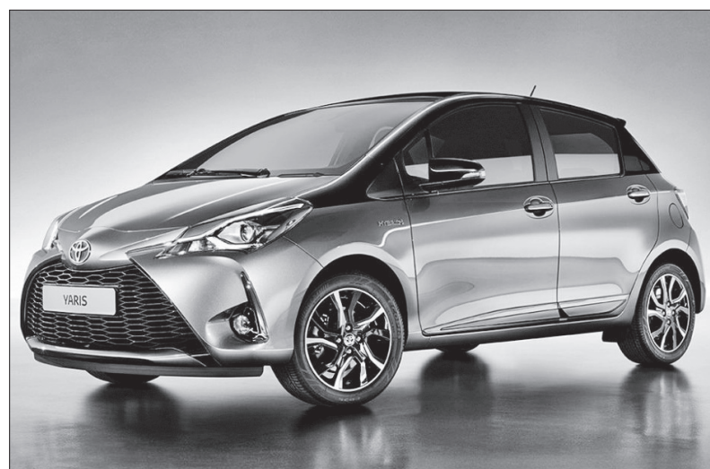
Toyota Yaris. Pro tento vůz postupně začnou sériové výroby komponentů (pedálové ústrojí) v OTSUKA BRANO v Olomouci. V příštím roce pak začne výroba i pro Toyota Aygo (páka ruční brzdy)