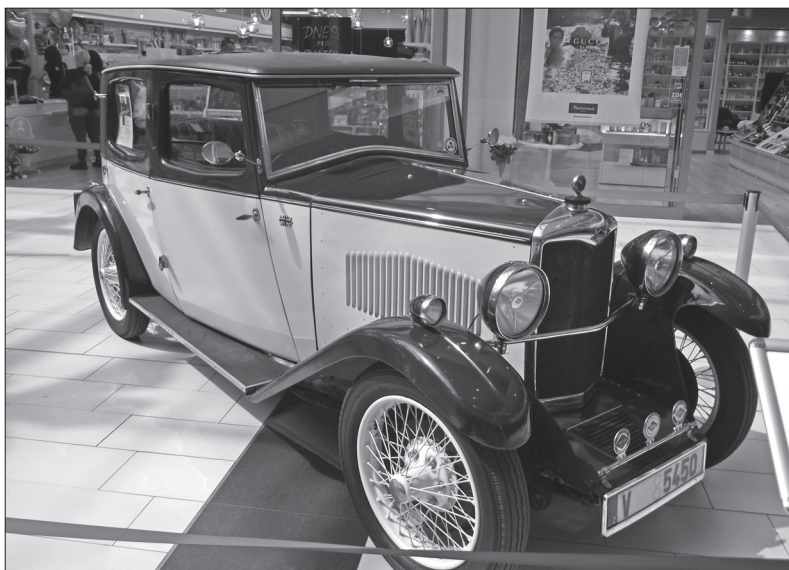
Vůz Riley Nine z roku 1928. Jak se vám líbí?