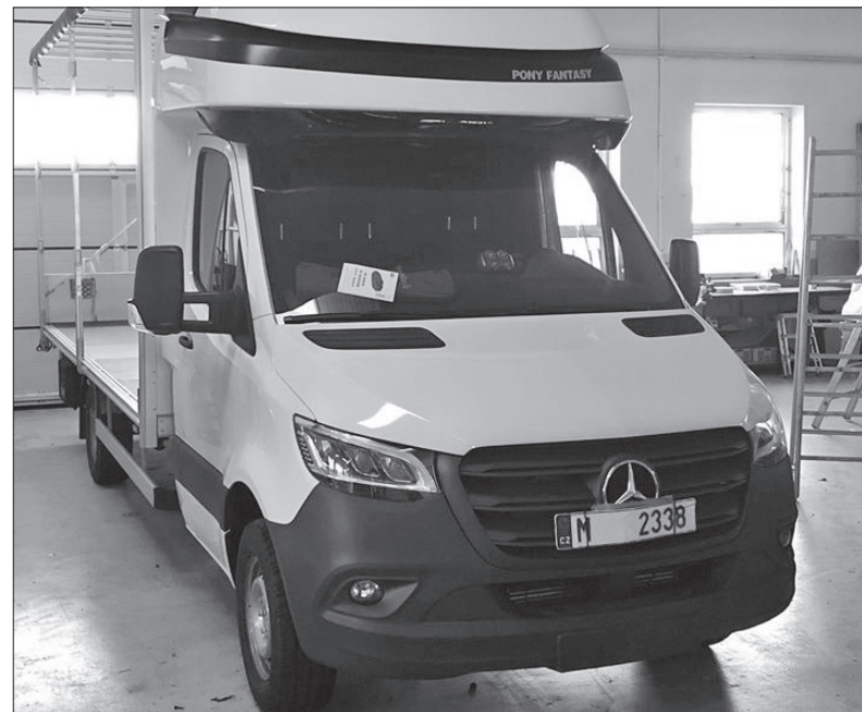
Mercedes Sprinter, vůz do kterého se montuje naše nezávislé topení z SBU CV Jilemnice