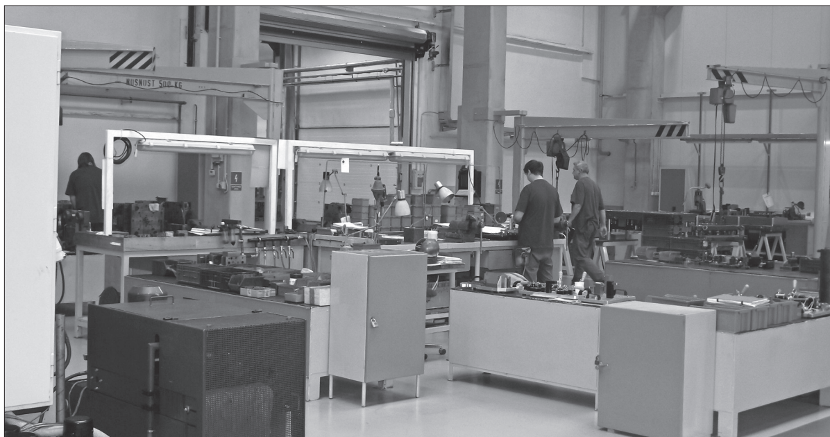
Každému branečákovi přejeme dostatek síly a osobní motivace