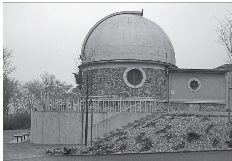
Hvězdárnu rozhodně nepřehlédnete