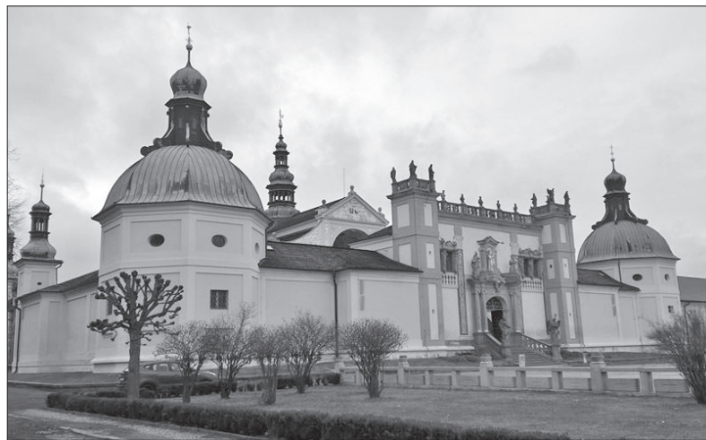
Velmi zajímavý objekt

Pozoruhodná stavba na fotografii je Svatá Hora u Příbrami. Na zdejších vrchu (586 m n. m.) stojí barokní areál, který je známým poutním místem. Navštívit ho může ovšem každý, ne jen věřící.