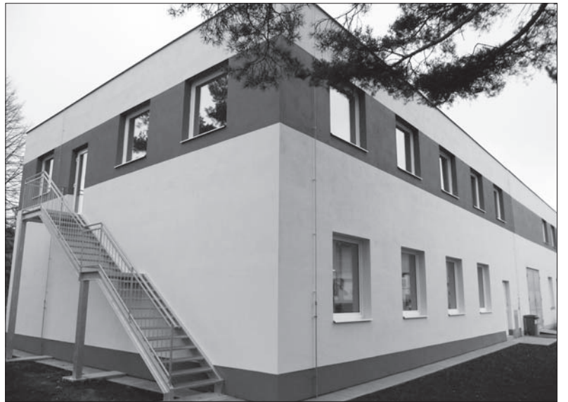
Nová přístavba sídla vývojářů v Hradci nad Moravicí