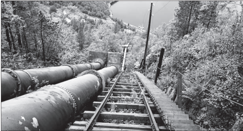
Troufli byste si na takový výstup?