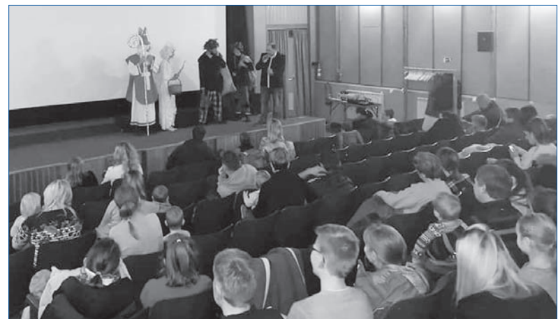
Mikuláš, anděl a čerti potěšili děti zaměstnanců BRANO a.s. v Hradci nad Moravicí. Stalo se tak 4. prosince. Akci připravila ZO OS KOVO BRANO Hradec nad Moravicí