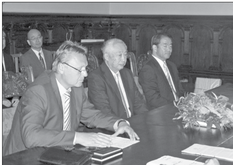
Od založení OTSUKA BRANO uplyne 10 let. Smlouva byla podepsána na zámku v Hradci nad Moravicí

Na rok 2020 připadá několik dílčích výročí z historie BRANO GROUP. Zde je jejich přehled.