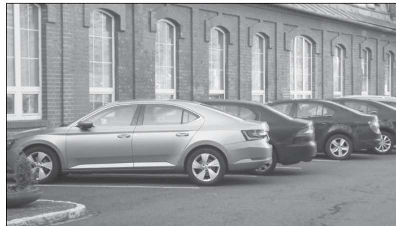
O svěřené vozy je třeba se starat