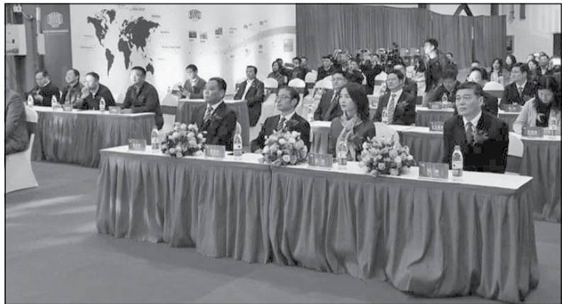
Akce se zúčastnilo mnoho pozvaných hostů