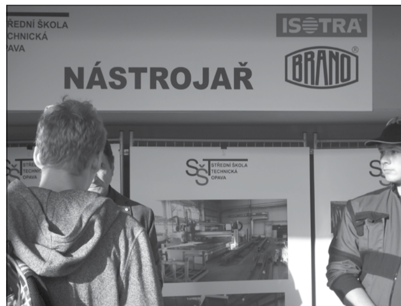
Na nedávném Veletrhu podnikání v Opavě propagovala BRANO Střední technická škola Opava. Ve spojitosti se slovem nástrojář šlo o příznačnou propagaci školy i naší firmy