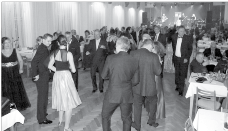
23. reprezentační ples BRANO a.s. proběhne 22. února 2020