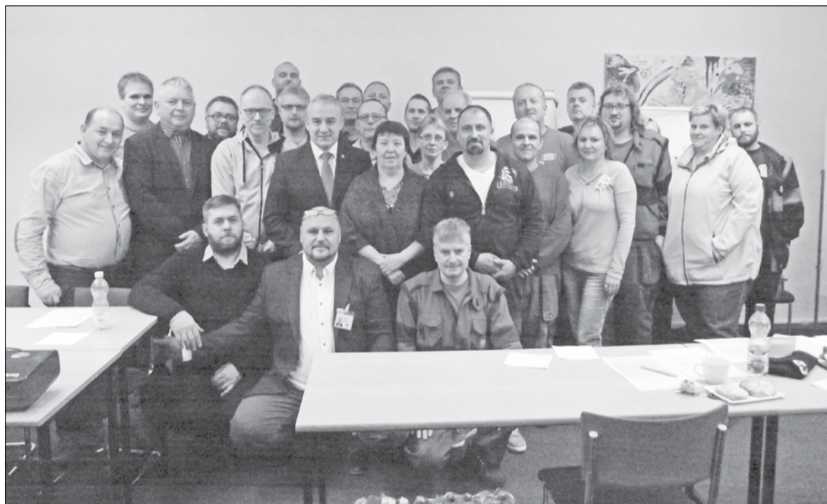
Účastníci odborové konference v Hradci nad Moravicí