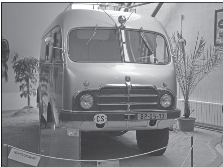
V Technickém muzeu Tatra Kopřivnice můžete do 30. dubna vidět výstavu o cestách Jiřího Hanzelky a Miroslava Zikmunda. Na snímku je expediční vůz a mapa cest panů H+Z. Stojí za shlédnutí