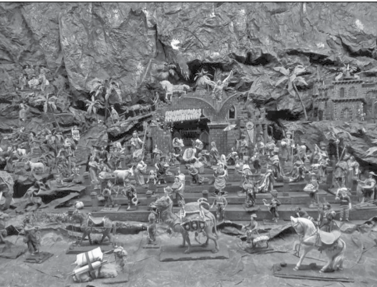
Jesličky vskutku stojí za pozornost

Mladá slečna píše inzerát do novin: Výměním dvoulůžkový stan za dětský kočárek. Stan je jen jednou použitý. Zn.: Spěchá!