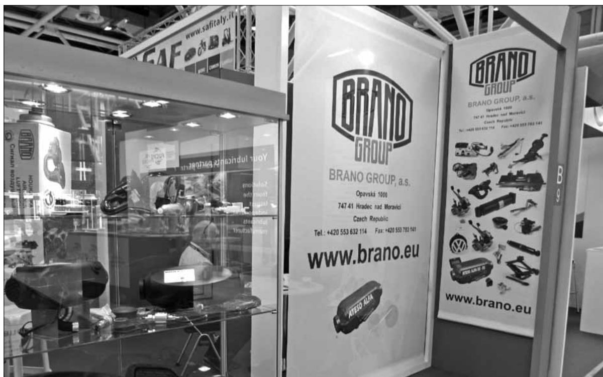
Část branecké prezentace v Bologni

Autopromotec také v tomto roce přilákal široké publikum profesionálů a nadšenců díky speciálním iniciativám, jako byl „Hybrid & ADAS Village“, což je oblast věnovaná demonstracím a testům nejnovější generace systémů ADAS na hybridních vozech, vytvořených ve spolupráci s Quattroruote. Profesionální „Autopromotec Motorsport“ a na druhé straně iniciativa sponzorovaná společností ACI Sport a ANFIA-Motorsport, oslavila vztah