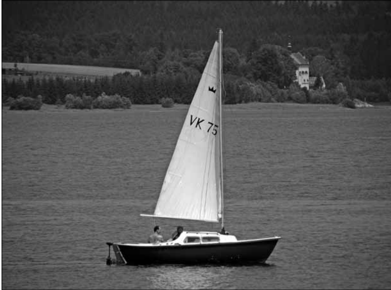
Plavby na lodi jsou samozřejmostí

Přehrada slouží primárně k výrobě elektrické energie a Otmuchowské jezero k rekreačním účelům. Na