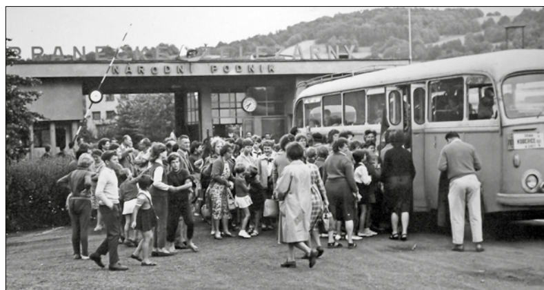
Opět pohled do historie. Branečáci jeli na zájezd. Snímek není datován, ale mohlo by jít o 60. léta