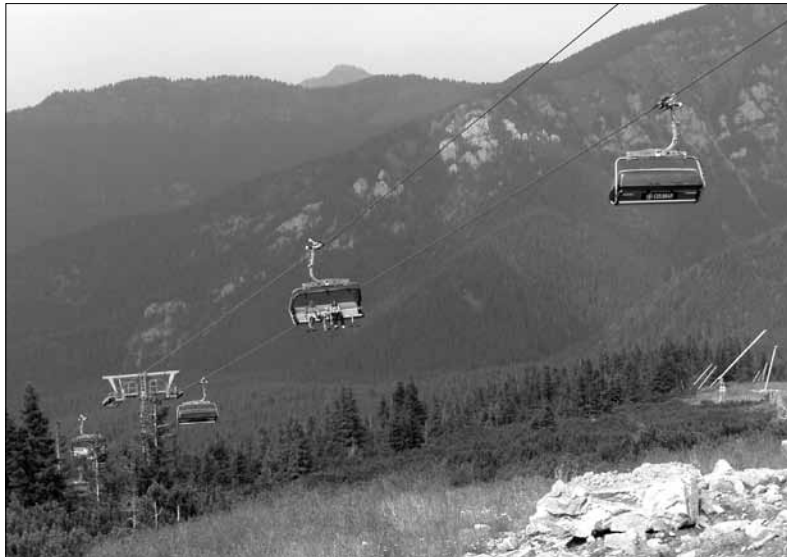
Do Tater je odsud blízko