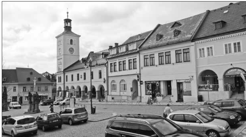
Jilemnické náměstí s historickou radnicí

Pojizerský pacifik směřuje do zastávky Vichová nad Jizerou v údolí