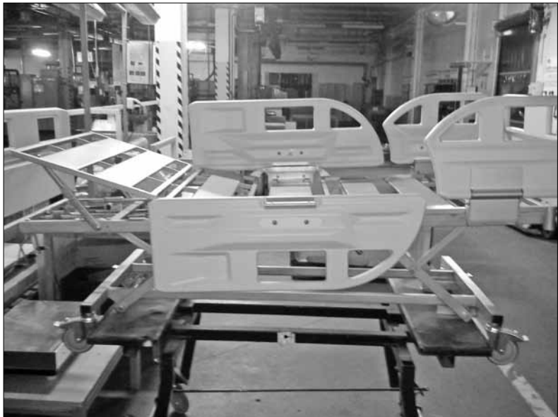
Nemocniční lůžko, na kterém se pracuje v SBU CS