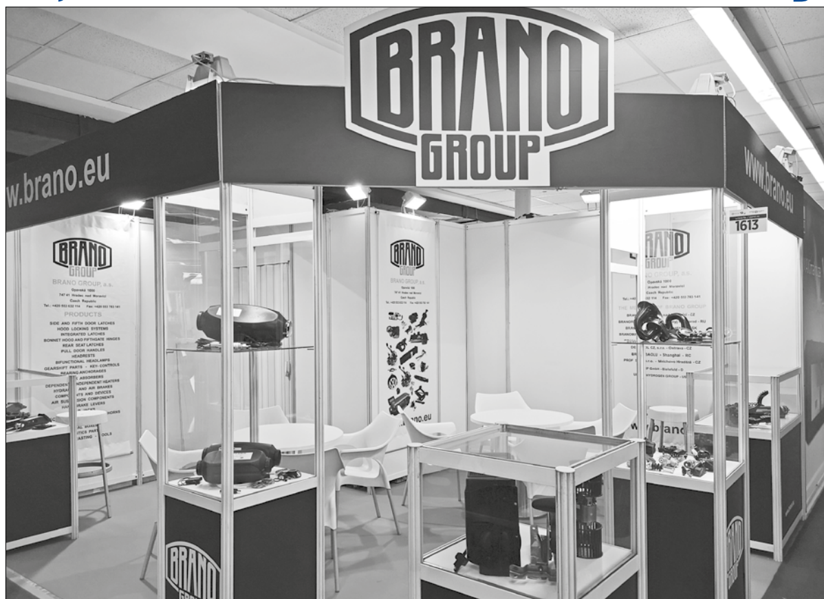
Prezentační stánek BRANO GROUP v Srbsku

Na Showroomu bylo vystaveno vše, co se v Srbsku prodává, včetně nejluxusnějších značek Rolls Royce, Jaguar, Mercedes a BMW. Největší zájem byl o první SUV Rolls Royce, ke kterému se nešlo celý den probíjet, jak byl obklopen zájemci o shlédnutí. BMW se dokonce se svojí prezentací rozlezlo po celém druhém pavilonu. Zahraniční vystavovatelé tímto nebyli dotčeni, takže my jsme ve svém stánku, tradičně vždy v pavilonu 1A, mohli opět vystavit celou produkci naší skupiny BRANO GROUP. Současně s autosalonem byl otevřen také mezi-