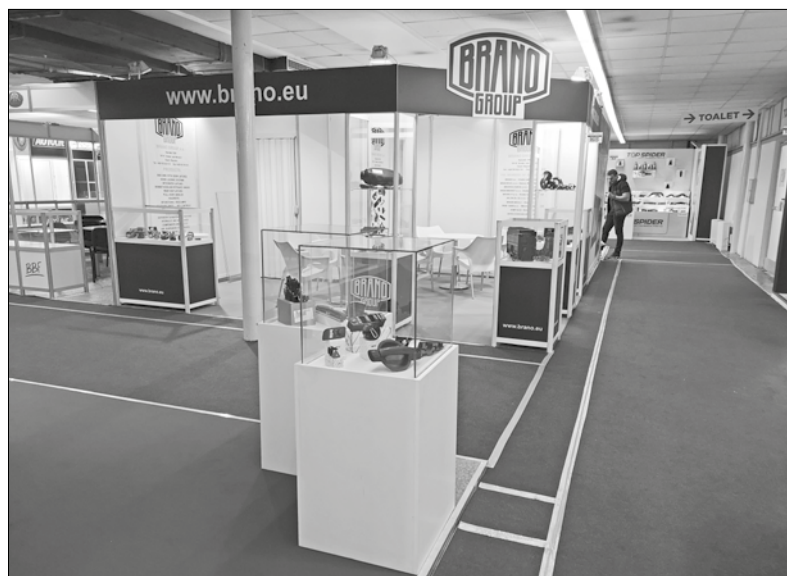
Branecký stánek z jiného pohledu