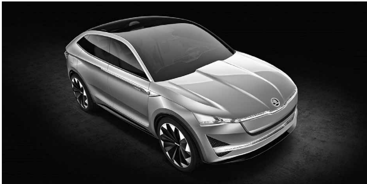
Jeden z konceptů budoucích elektrovozdů Škoda Vision E