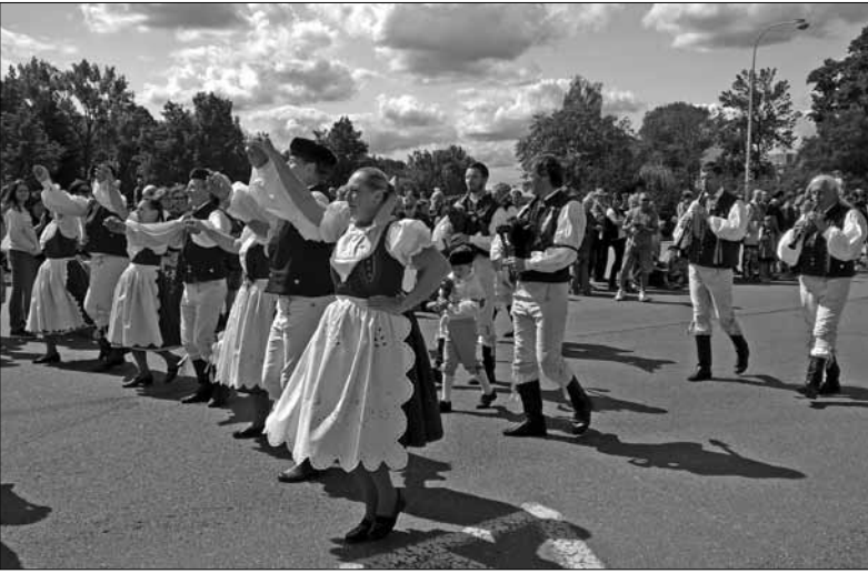
Dudácký průvod městem

Strakonice najdete v jižních Čechách, a to na soutoku řek Otavy a Volyně v nadmořské výšce od 390 do 430 metrů. Počátky města sahají do 13. století. Mnozí z vás si jistě v souvislosti se Strakonice vzpomenu na Švandu dudáka. Tato tradice zde žije dodnes.