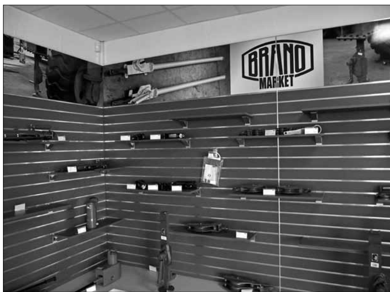
Pohled na vystavený současný sortiment