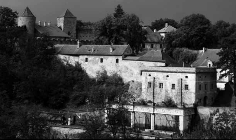
Hradní areál je celkem rozsáhlý

Znáte hrad Veverí? A víte, kde ho vůbec hledat? Je to snadné, nachází se v Jihomoravském kraji, a to v městské části Brno - Bystrc. Toto dřívější sídlo moravského markraběte ční na skalním ostrohu nad Brněnskou přehradou, tedy Prýglem.