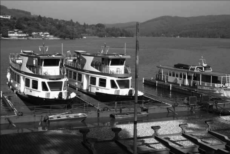
Po přehradě je možné se projet lodí

Baví se dva kutilové: „Představ si, že u mě včera ve tři v noci zvonil soused! Nekecám, ve tři v noci přišel a zazvonil... Jsem se tak lekl, že mi normálně vypadla vrtačka z ruky.“