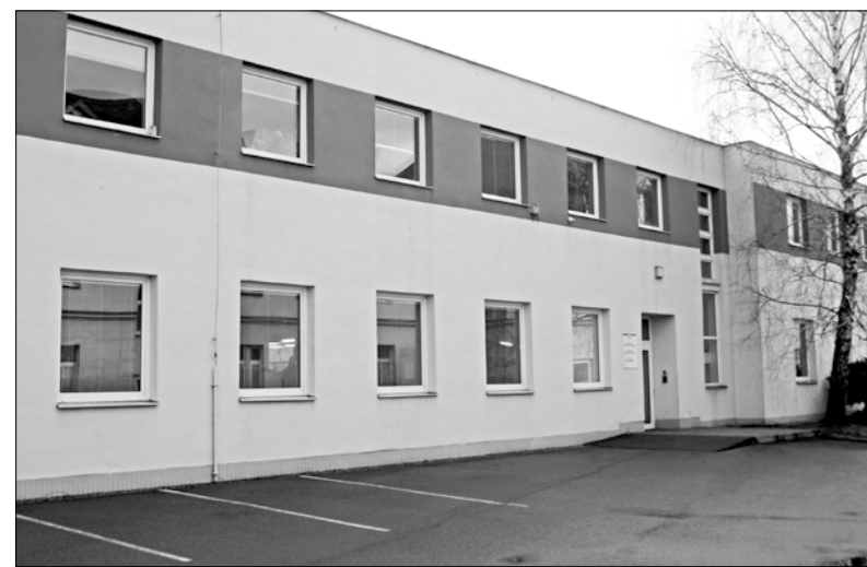
Stávající sídlo vývoje má být rozšířeno

Ač BRANO GROUP na autosalonu v Ženevě nevystavuje, přesto se zde letos o nás vědělo. Právě v Ženevě totiž došlo k představení Door Protectoru (ochrana bočních dveří) na vozech Škoda Kamiq, který je vyvíjen v Hradci nad Moravicí.