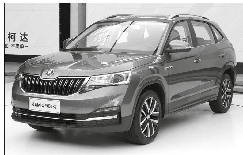
Ani Škoda Kamiq se neobejde bez dílů BRANO