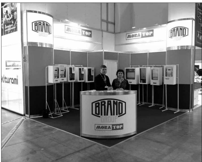
Prezentační stánek SBU Heating v Moskvě

SBU Heating Uničov se představila ve dnech 12. až 15. února na výstavě Aqua-Therm v Moskvě. Naše účast proběhla ve spolupráci s dceřinou společností TD MORA-TOP.