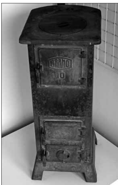
Kdysi jsme vyráběli i taková kamna