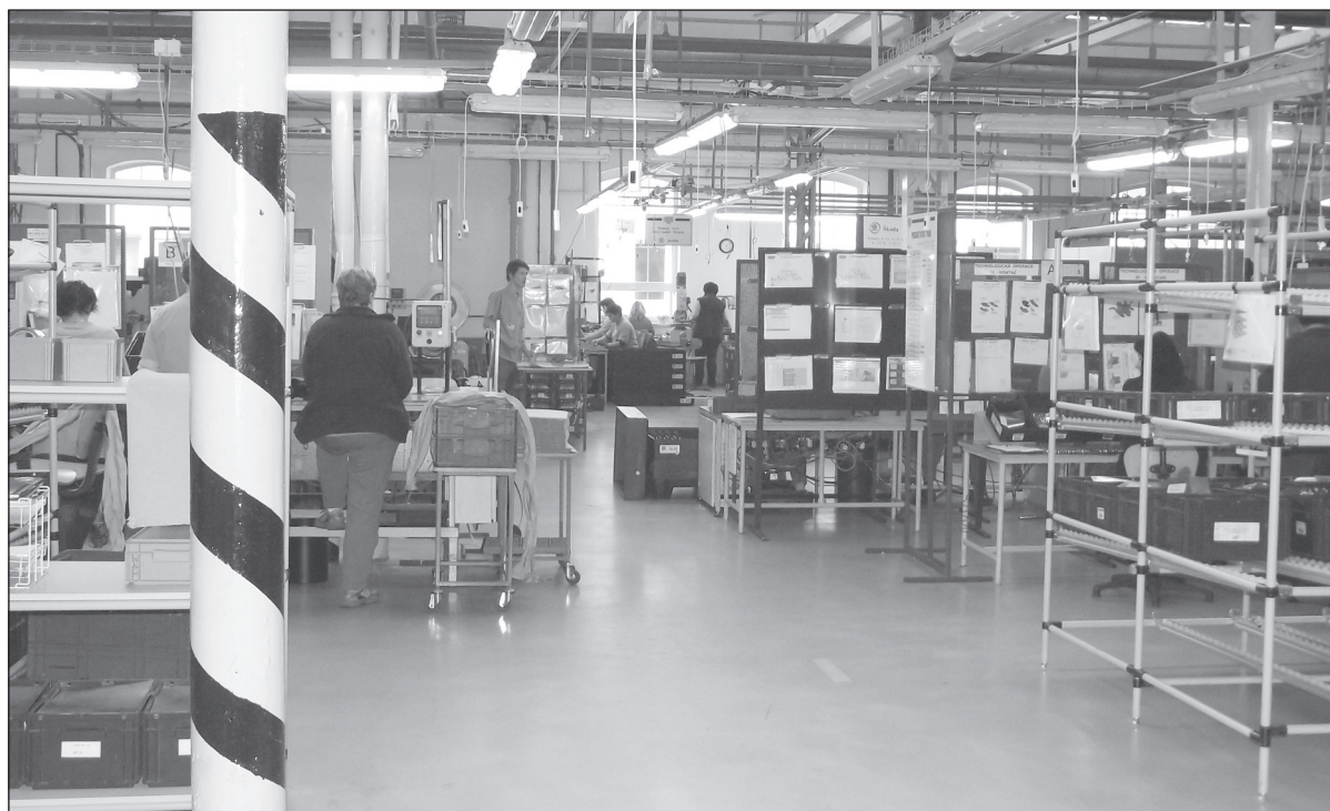
Všechna SBU již mají certifikační audity za sebou

Výsledky jednotlivých lokalit: Hradec nad Moravicí (SBU DS, SBU ZZ, SBU Slévárna, BU CJ, SBU TOOLS, Vývoj) – 2 kritické odchylky, 2 nekritické odchylky, 0 doporučení. SBU CV Jilemnice – 0 kritických, 4 nekritické, 0 doporučení. SBU Plasty Zubří – 0 kritických, 6 nekritických, 0 doporučení. SBU CS Rakovník – 0 kritických, 5 nekritických, 0 doporučení. Vývoj