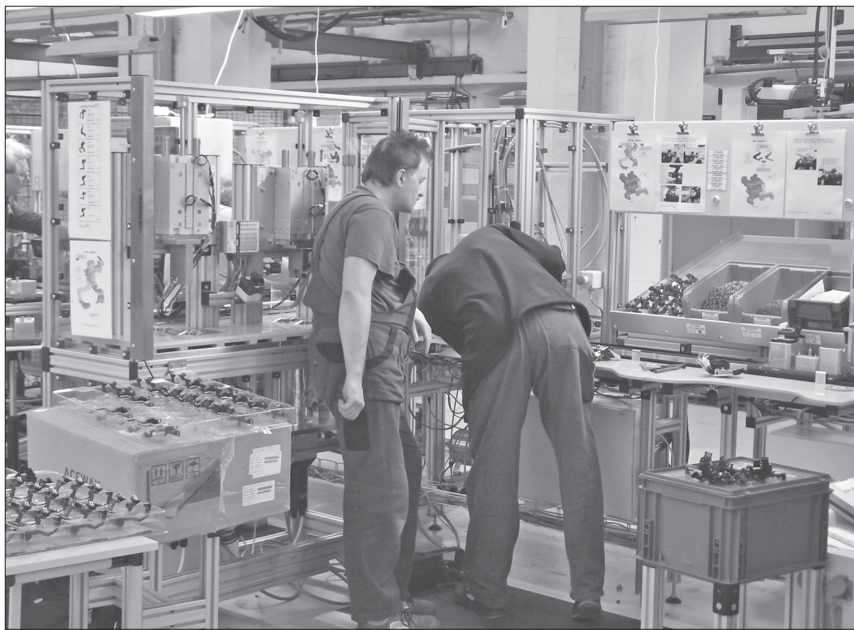
Linka MQB – zámky 5. dveří a aktuátory na SBU DS v Hradci nad Moravicí