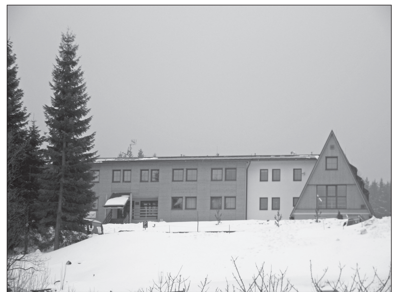
Letošní zima byla na sněh bohatá, což se projevilo i na hotelu BRANS v Jeseníkách. Zdejší prostředí je ideální pro zimní pobyty