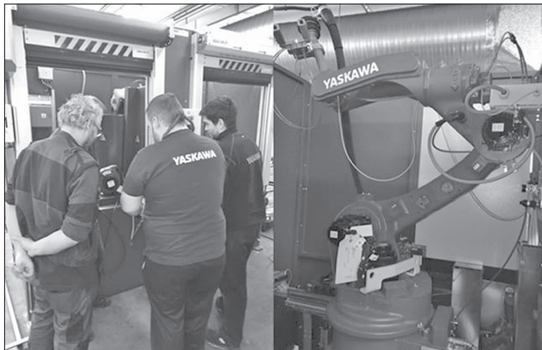
Na počátku února proběhla v SBU CV v Jilemnici instalace nových svařovacích center od společnosti Yaskawa.

„Ještě během února máme v plánu zavést a předat centra do sériové výroby. Instalace těchto center je první realizace