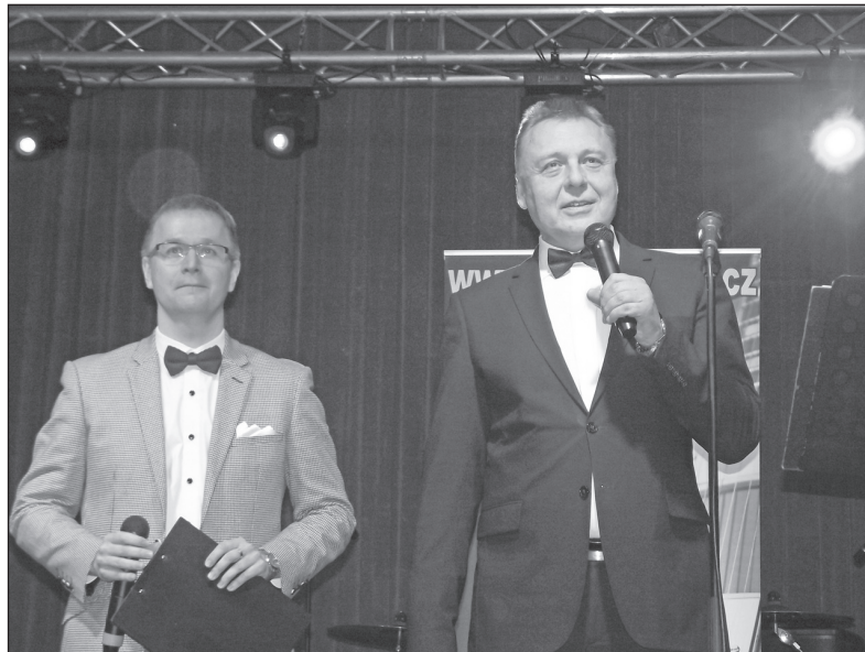
Zahájení plesu BRANO a.s.