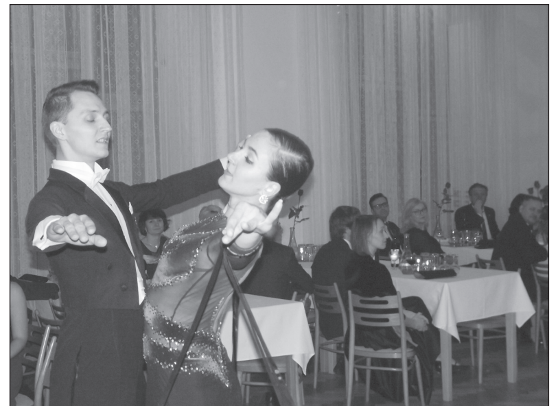
Taneční mistři při vystoupení