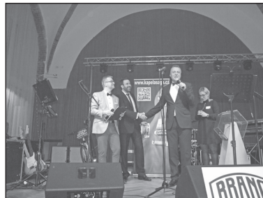
Šťastný výherce první ceny – zájezdu podle svého výběru