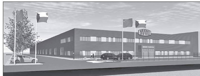
Takto by měl vypadat náš nový závod v Tajvanu v Číně. Letos v lednu byl položen základní kámen výstavby. Po dokončení závod významně rozšíří branecké aktivity v Asii