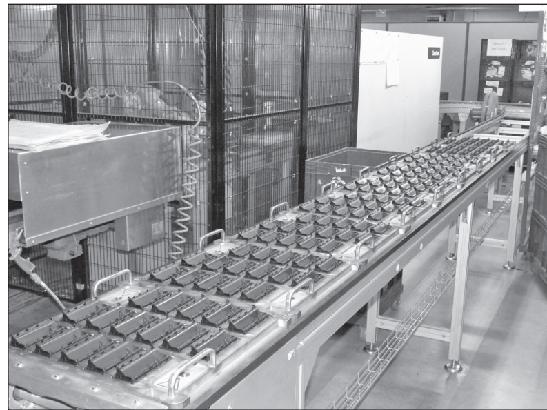
Stávající kapacity budou brzy posíleny SBU PLASTY

Nová hala v SBU Plasty Zubří se brzy stane plnohodnotnou součástí této naší branecké lokality. Kolaudace je zde doslova za dveřmi.