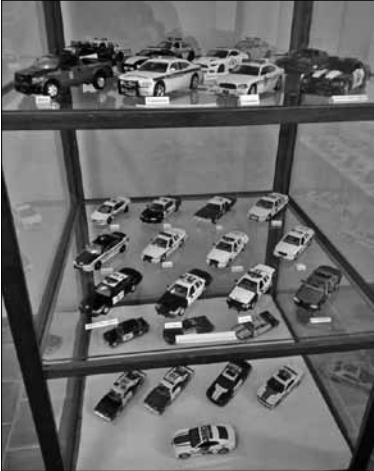
Část sbírky policejních autíček

První policie, tak jak ji známe dnes, vznikla ve Francii za vlády krále Ludvíka XIV. Velitelem byl generální policejní poručík, který měl k dispozici 44 policejních komisařů a několik desítek policistů-pomocníků. První moderní policie pak vznikla roku 1798 ve Velké Británii a jednalo se o Londýnskou říční policii (první policejní britská jednotka).