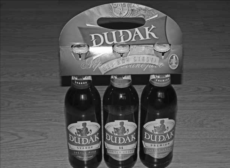
Dudák není jen muzikant

Cestování je krásná věc, jestliže máme domov a máme se kam se vrátit.