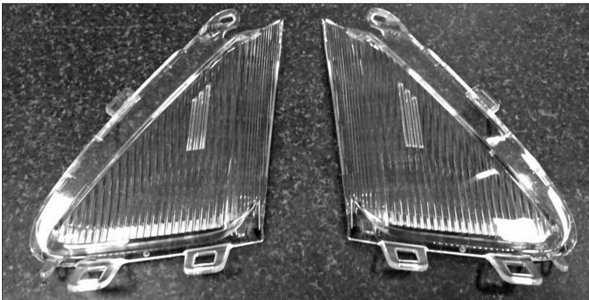
Díly pro přední světlomet Ford Focus: z produkce SBU PLASTY