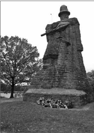
Památník v Sudoměři

Miroslav Pospíšil